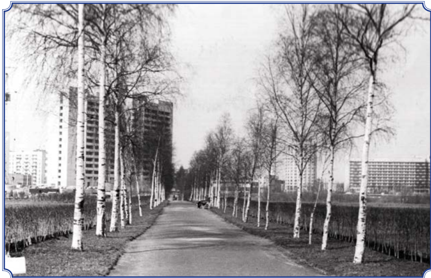
Аллея Славы. Вид на пр. Ветеранов, 1970-е годы