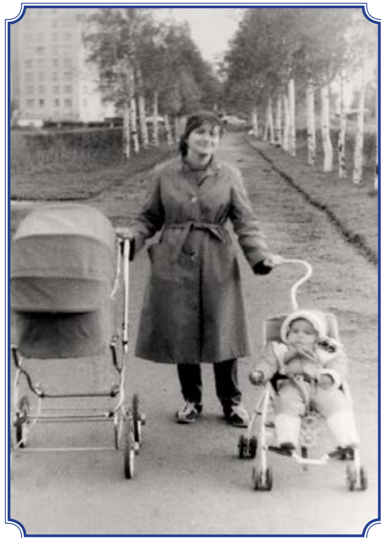
Аллея Славы, 1988 год, пр. Маршала Жукова и ул. Стойкости, Кировско-красносельская граница