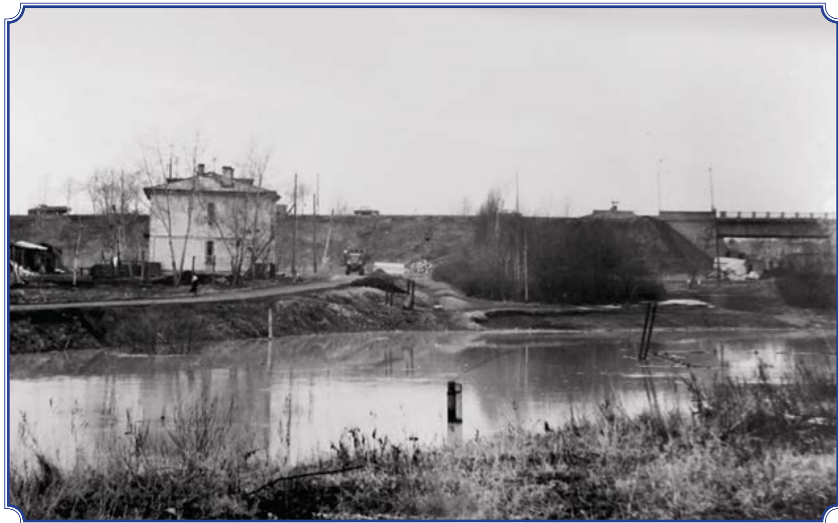
Посёлок Старо-Паново, река Дудергофка разлилась. На заднем плане Лиговский ж/д путепровод и насыпь Таллинского шоссе, весна 1979 года