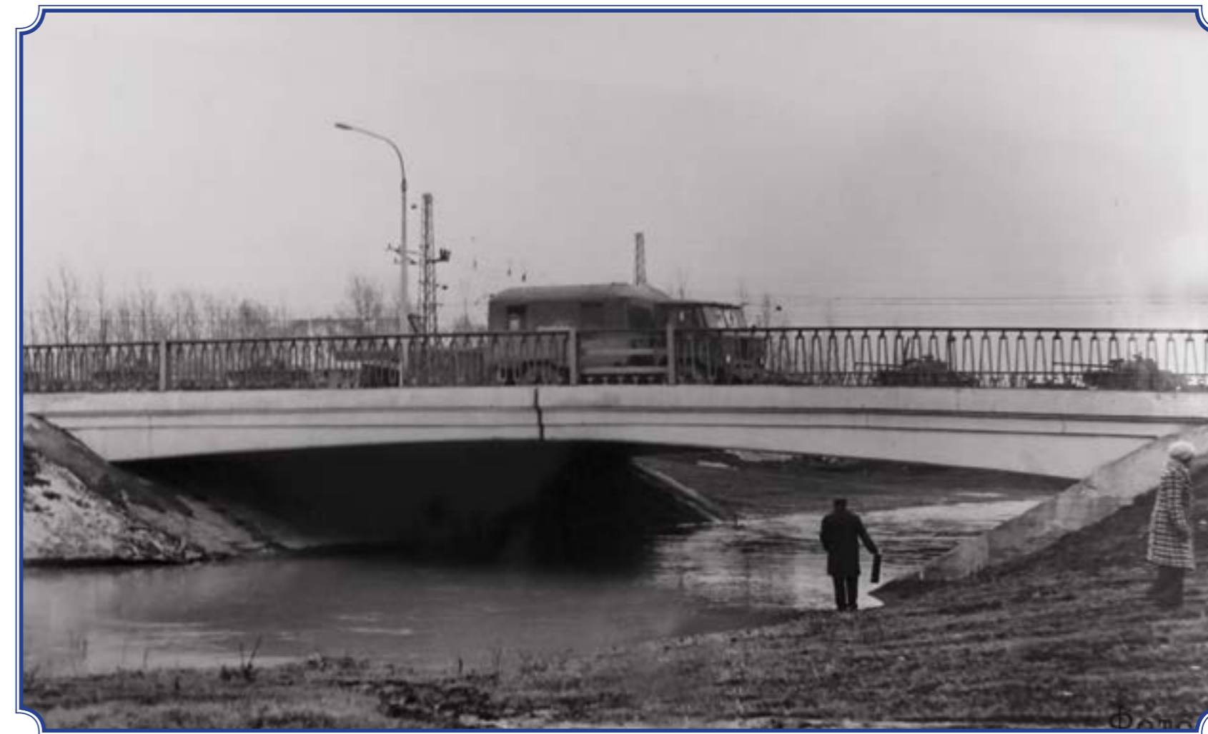
Мост через реку Дудергофку в створе пр. Народного Ополчения, вид со стороны Мемориала, до строительства набережной. На заднем плане виден состав с танками с ремзавода «Красные Зори» (сейчас 61 бронетанковый ремонтный завод), 1979 год