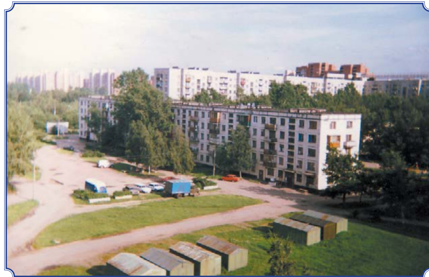
Ул. Авангардная, д. 23, середина 1990-х годов