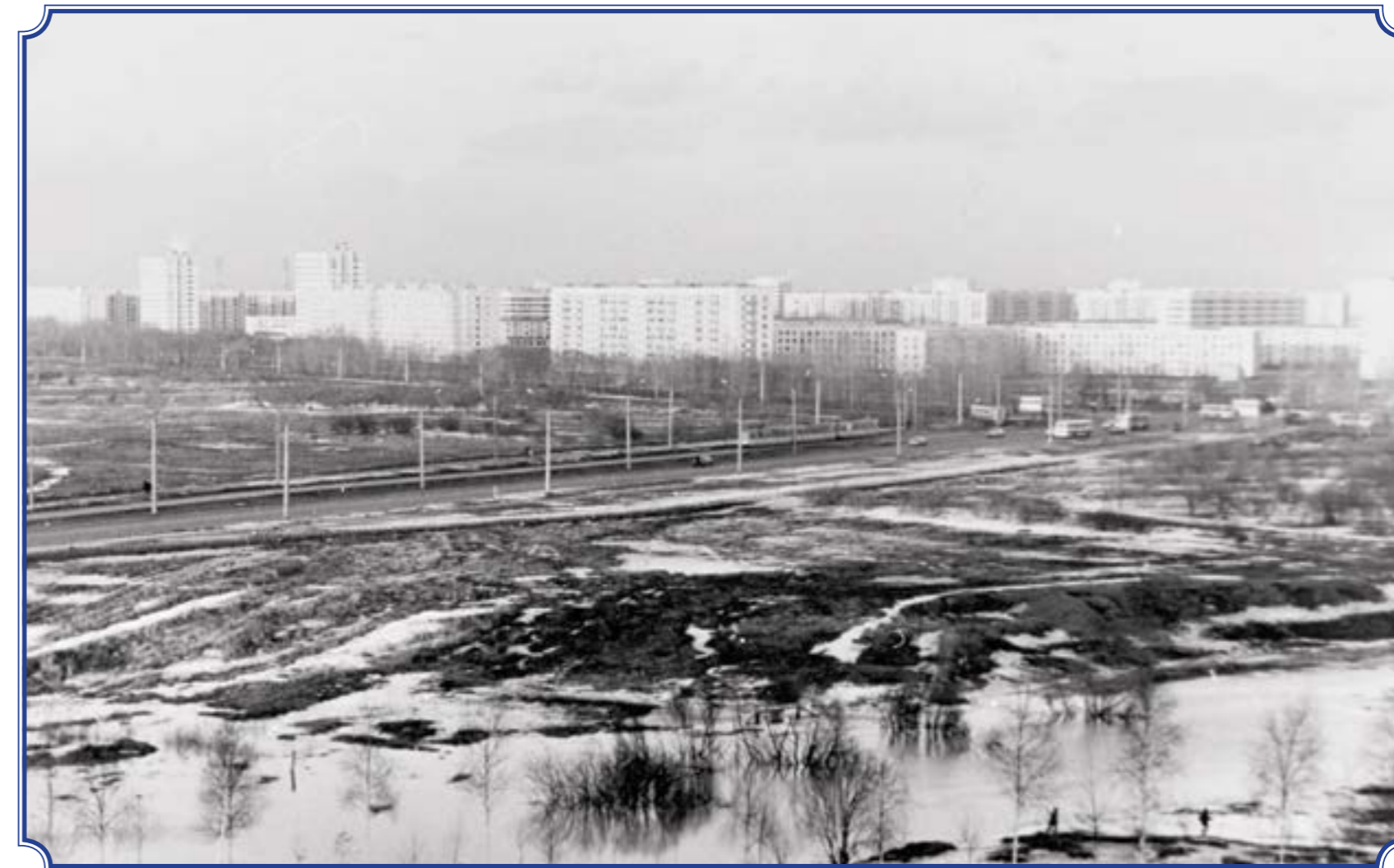
Вид из окна дома по адресу ул. Авангардная, д. 20, корп. 2 на пр. Ветеранов в сторону пр. Маршала Жукова, конец 1970-х годов