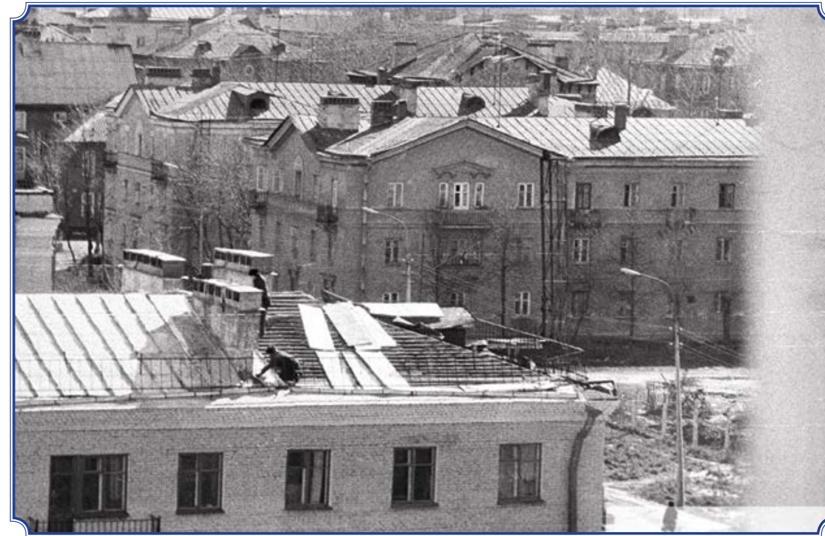
Ул. Лётчика Пилютова, 1980-е годы