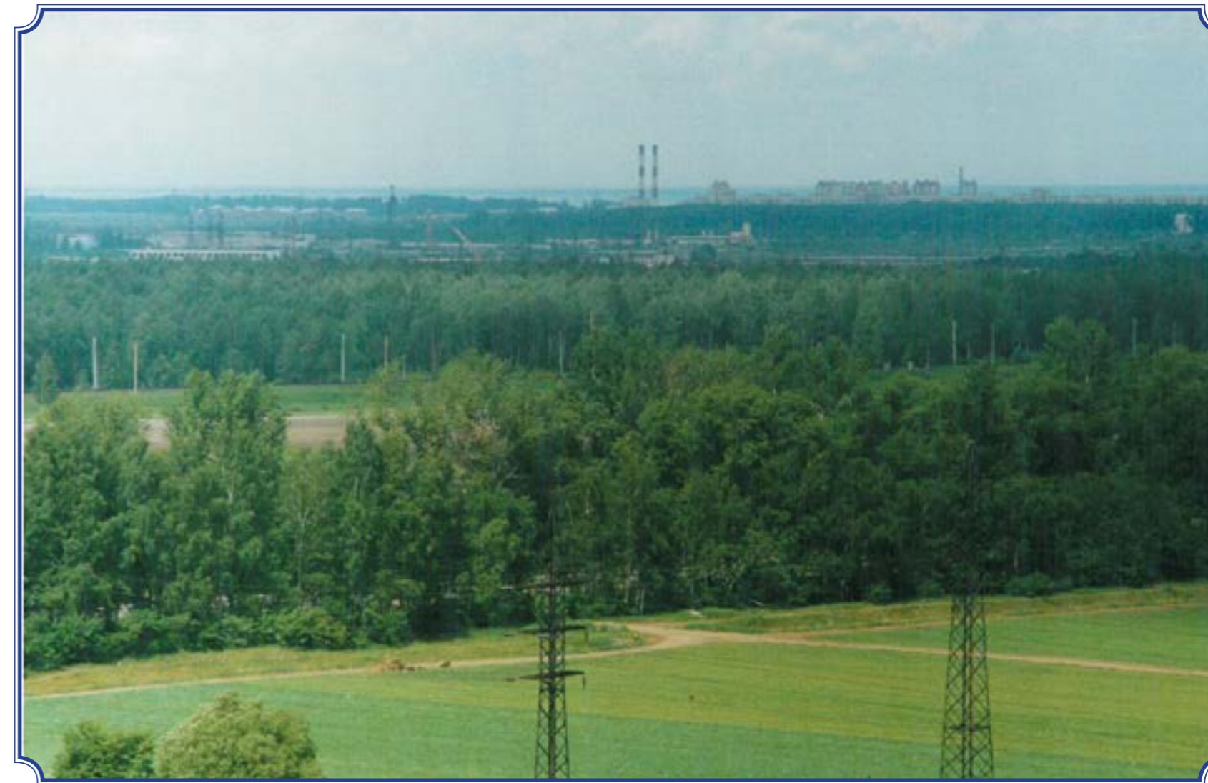
Горелово, вид на Сосновую Поляну, 1995 год