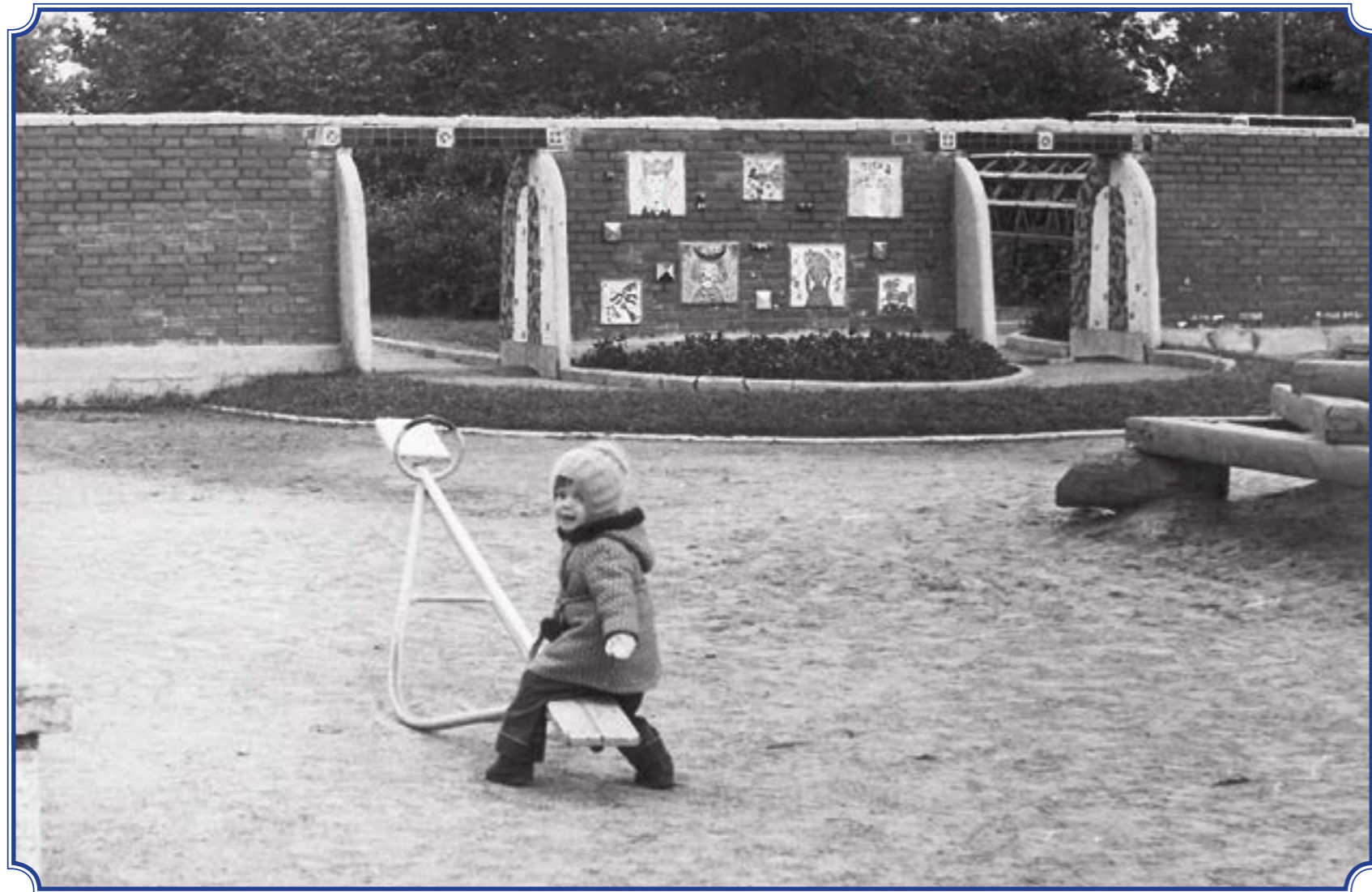
Южно-Приморский парк им. В.И. Ленина, 1978 год