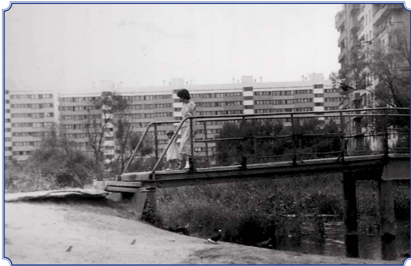
Мост через реку Дудергофку, 1990 год. Дом-корабль на ул. Авангардная, д. 20, корп. 1