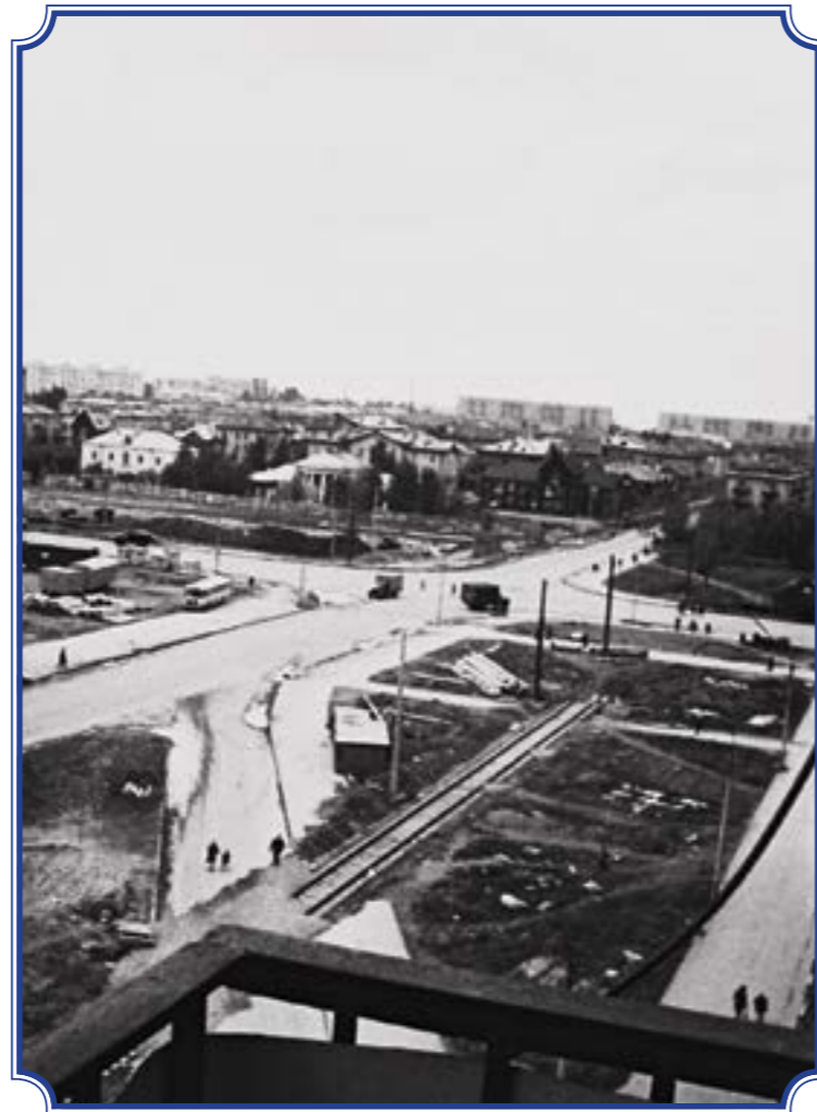
Снимок сделан с балкона дома по адресу: ул. Пограничника Гарькавого, д. 34, корп. 1, идет прокладка путей трамвая 52, 1971 год