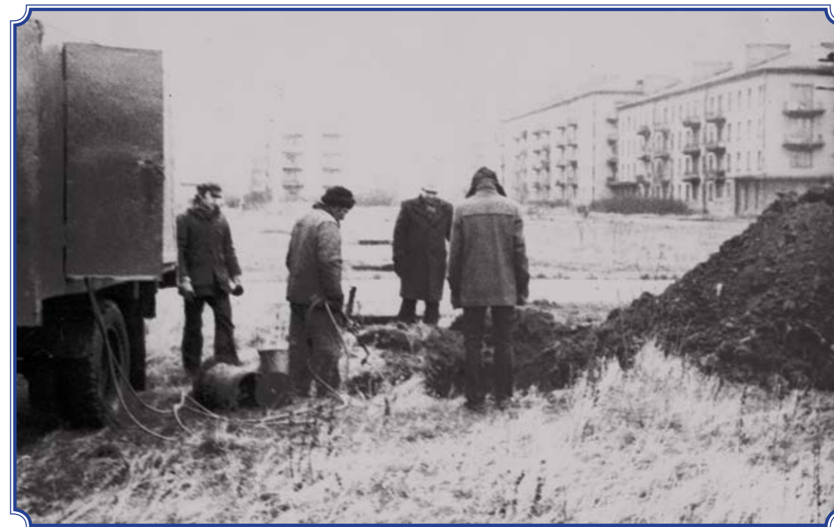
Ул. Типанова (сейчас ул. Лермонтова), участок между улицами Типанова и Массальского, 1980-е годы