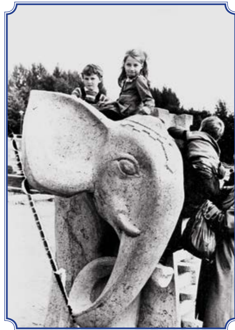
Южно-Приморский парк им. В.И. Ленина, август 1989 года