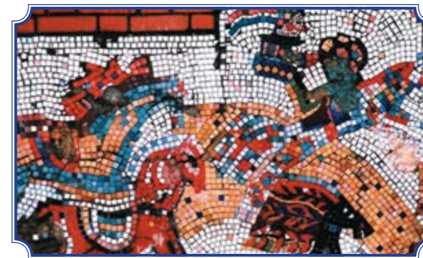
На 4-х фото представлены мозаичные панно, которыми были оформлены стены крепости на детской площадке в Южно-Приморском парке. Авторы – К.А. Петрова и Е.В. Попова. В основе панно – детские рисунки