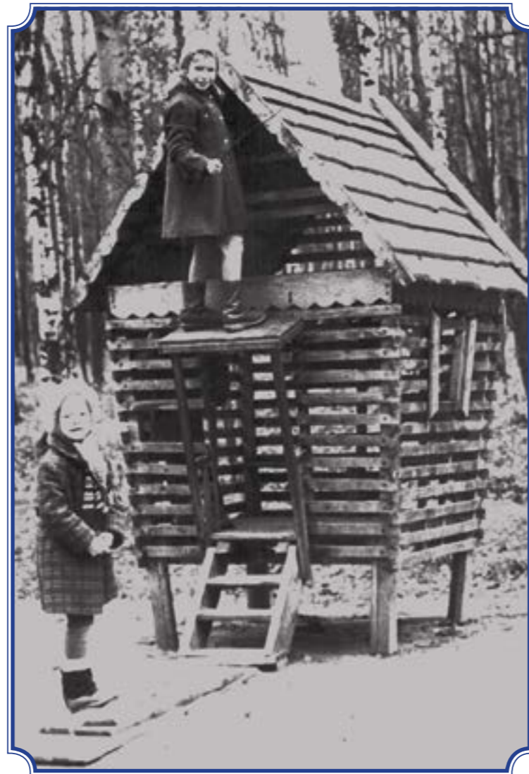
Парк «Сосновая Поляна», 1983 год