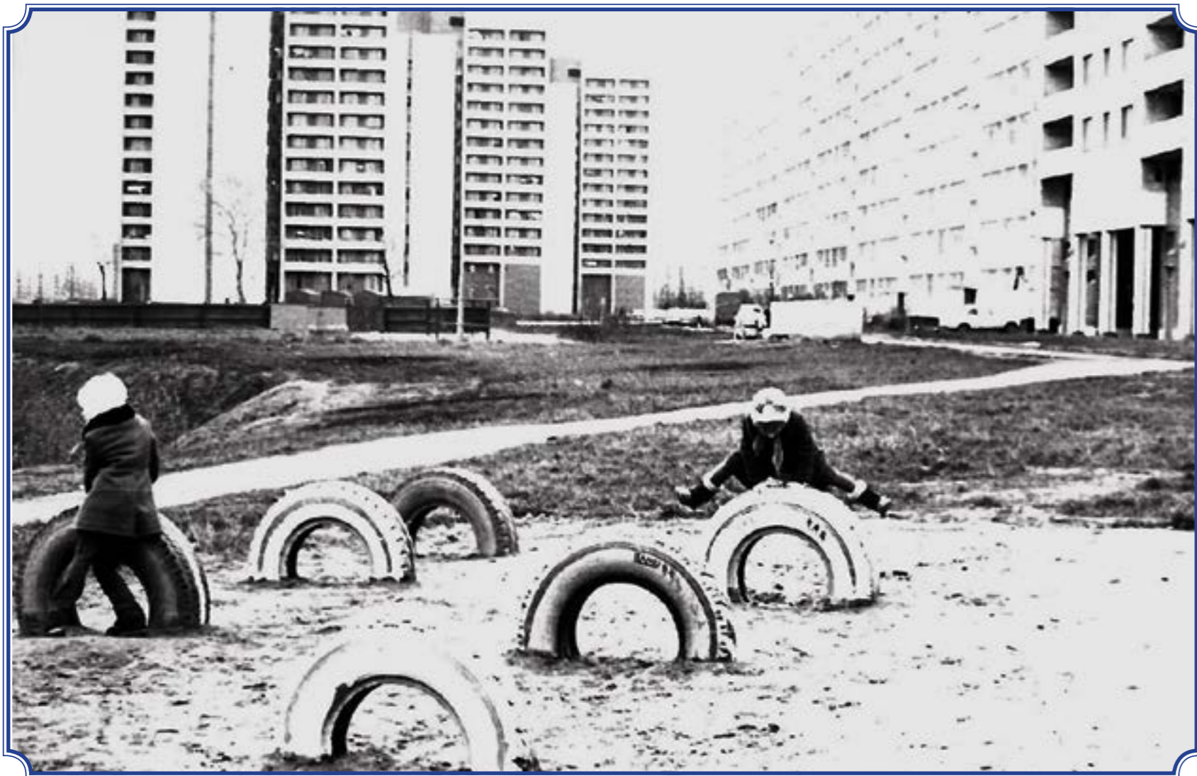
Детская площадка, ул. Здоровцева, д. 4, 1983 год. Сейчас на этом месте районный центр спорта