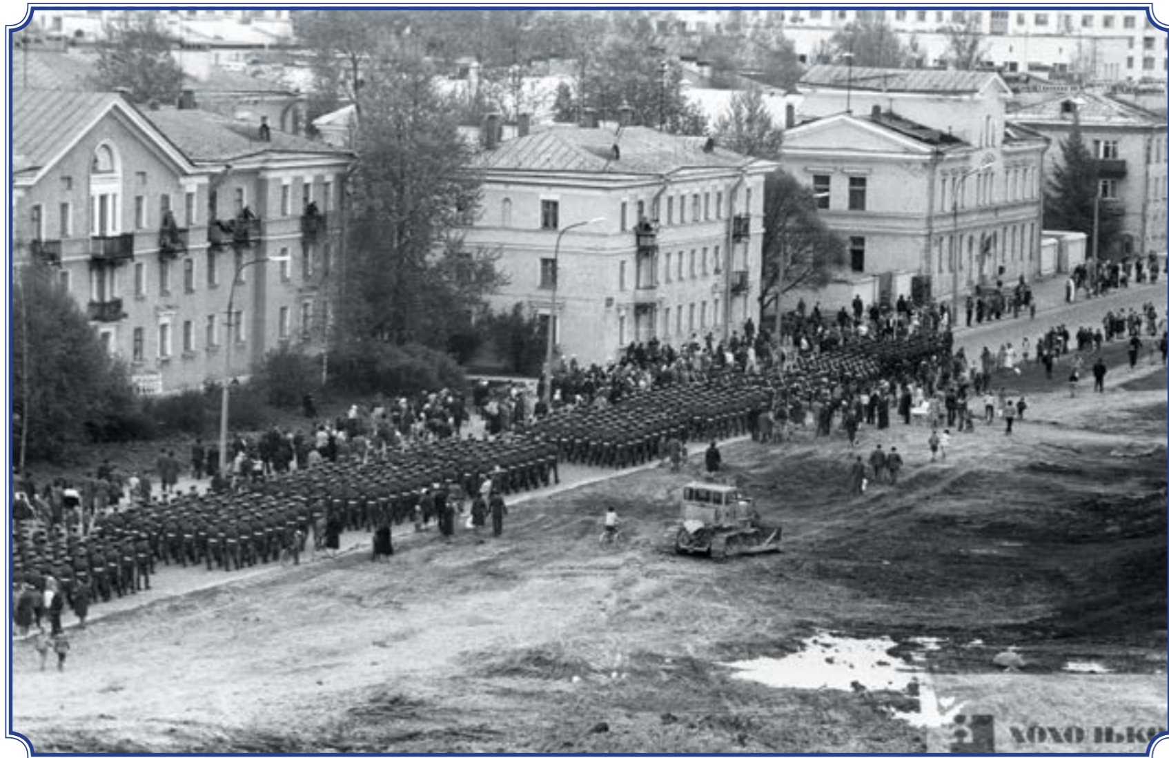
Торжественный проход курсантов Высшего политического училища по ул. Летчика Пилютова, 1980 год