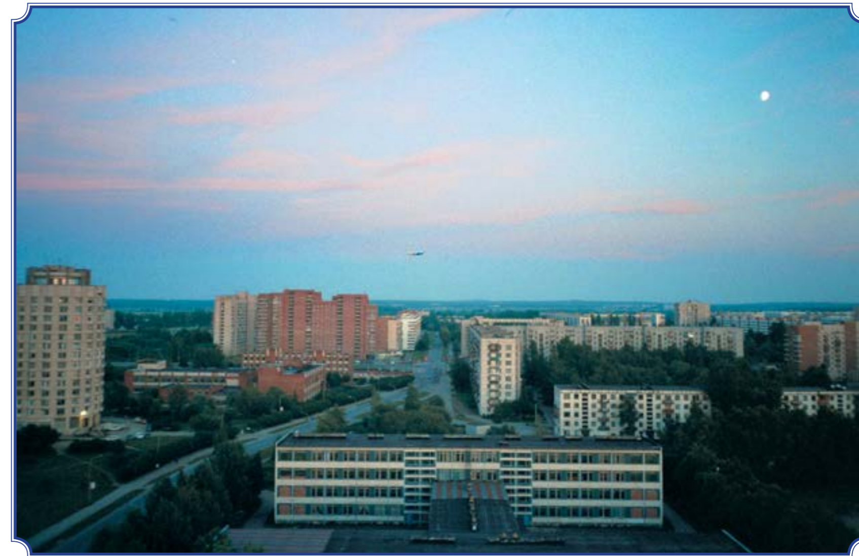
Съёмка с трубы котельной на ул. Авангардной, июль 2001 год