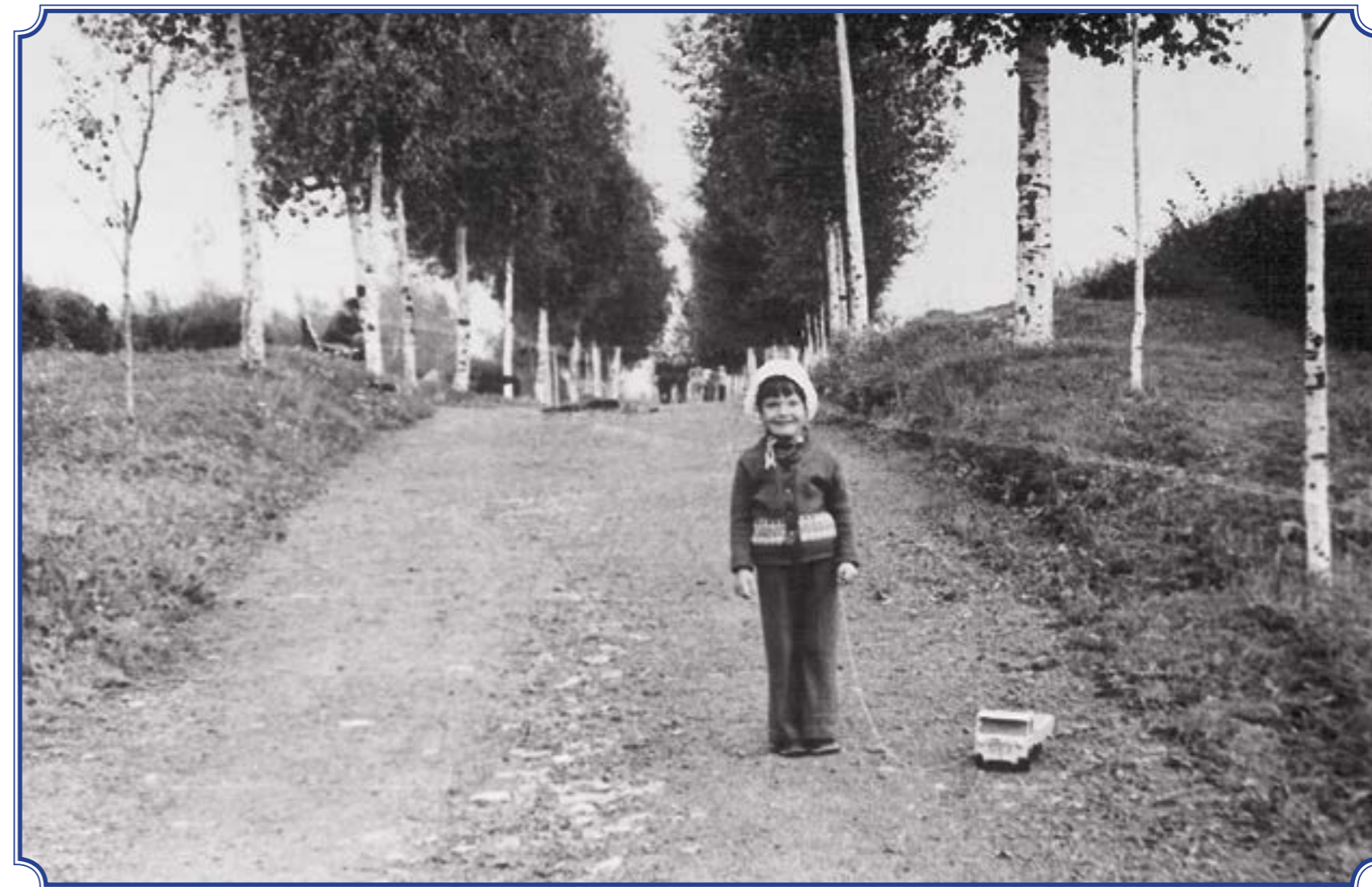
Аллея Славы, 1978 год