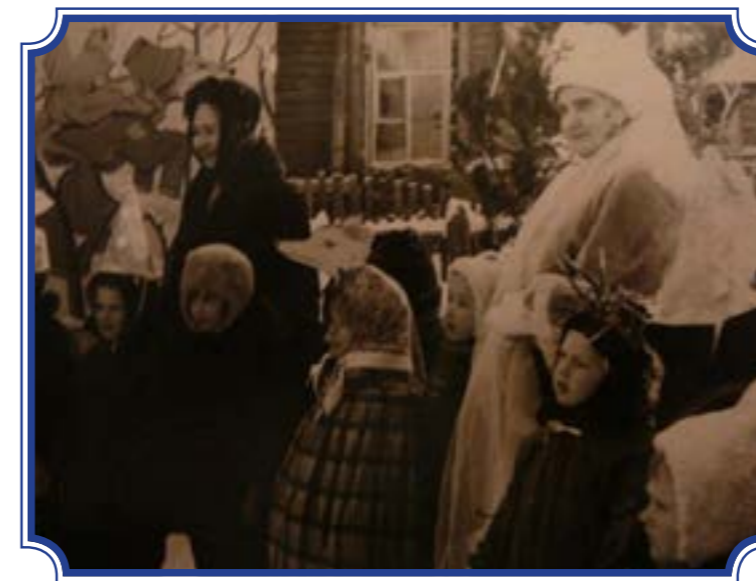
Территория деревянного здания фабричного детского сада в Фабричном поселке в Красном Селе (до постройки каменного)