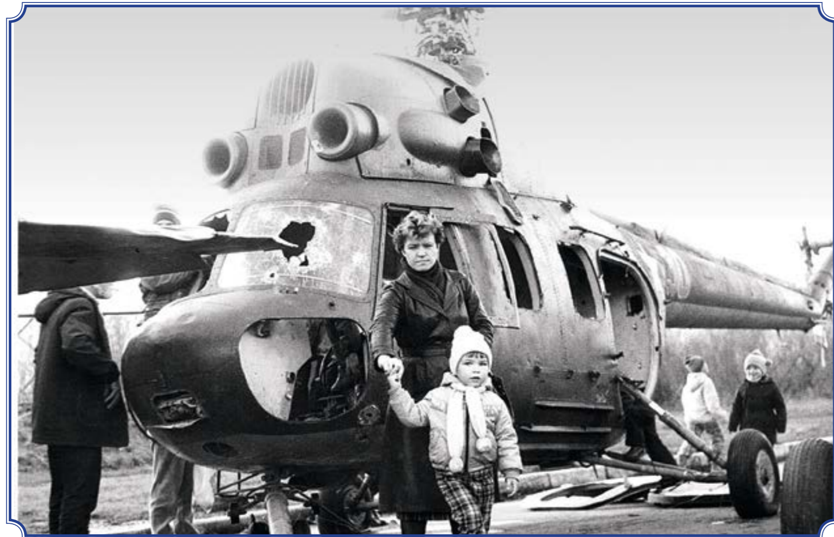
Старая военная техника около Южно-Приморского парка им. В.И. Ленина, 1989 год