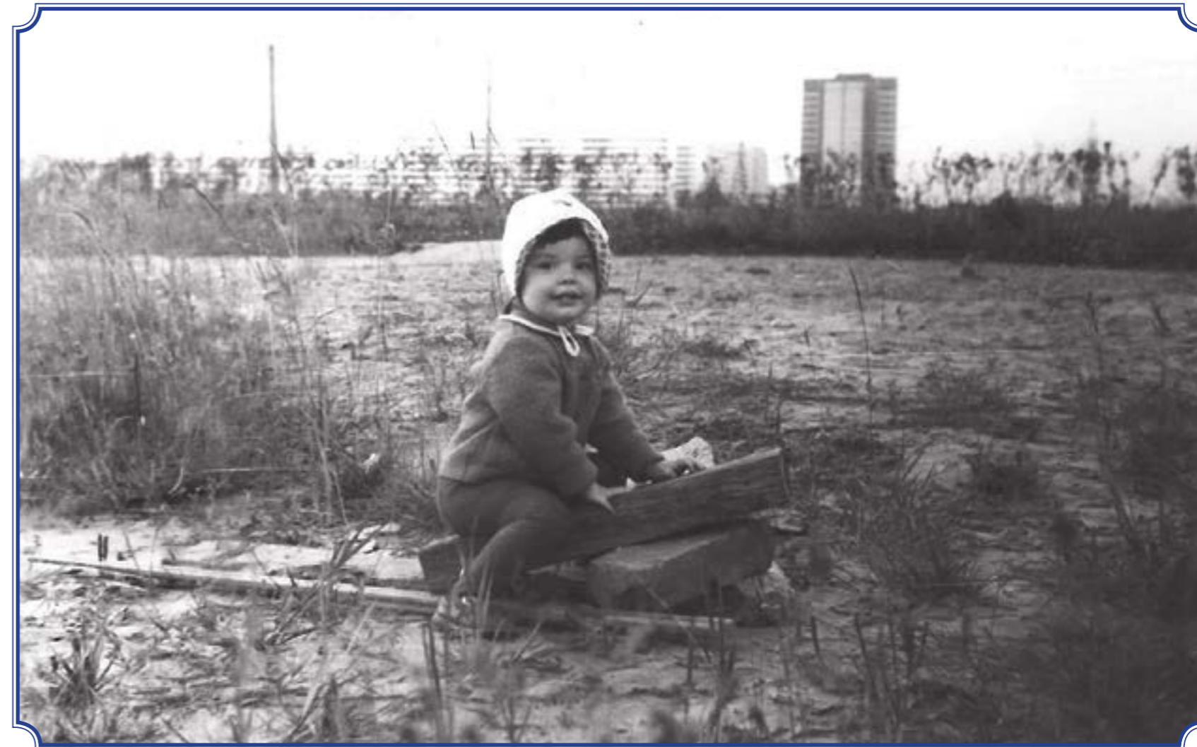
На территории киностудии «Ленфильм». Вдали виднеется фабрика «Грим». Сейчас на этом пустыре новые дома, ул. Тамбасова, д. 1, корп. 1, д. 3, корп. 1, д. 7