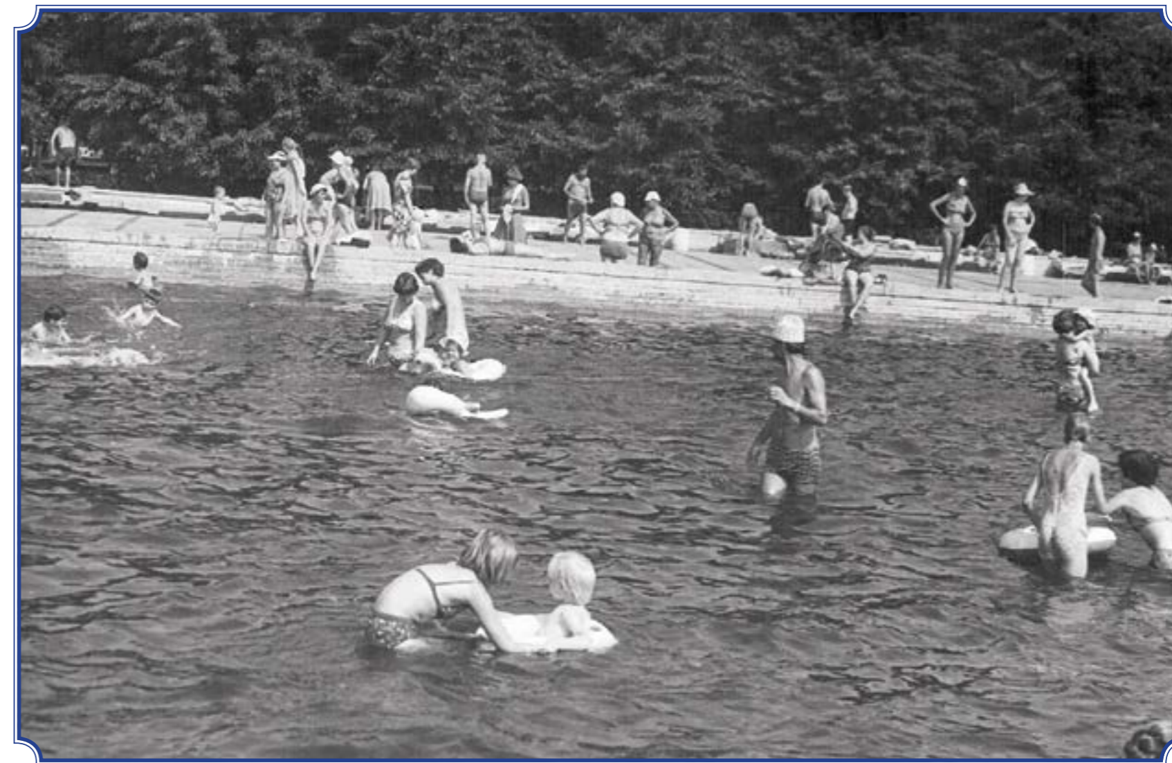
Южно-Приморский парк им. В.И. Ленина, открытый бассейн на месте нынешнего фонтана, 1980 год