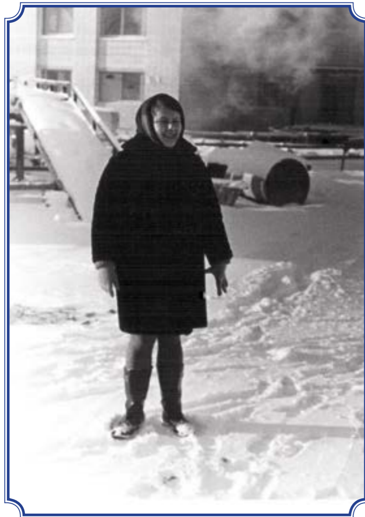
Ул. Партизана Германа, д. 37, корп. 1, около здания налоговой инспекции