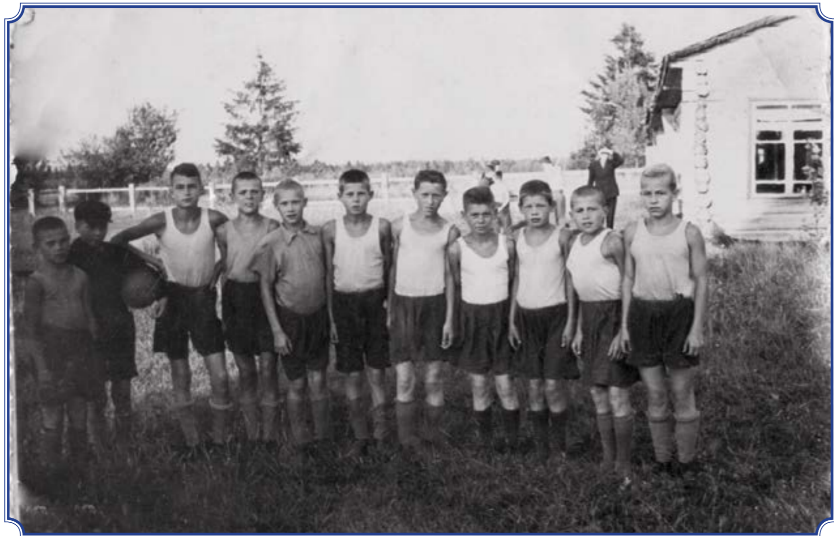
Старо-Паново, 1939 год