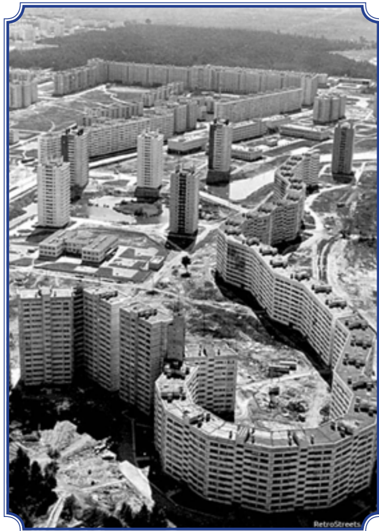
«Дом-змея» ул. Пионерстроя, д. 7, корп. 1, 2, 3, д. 15, корп. 3, д. 19, корп. 2