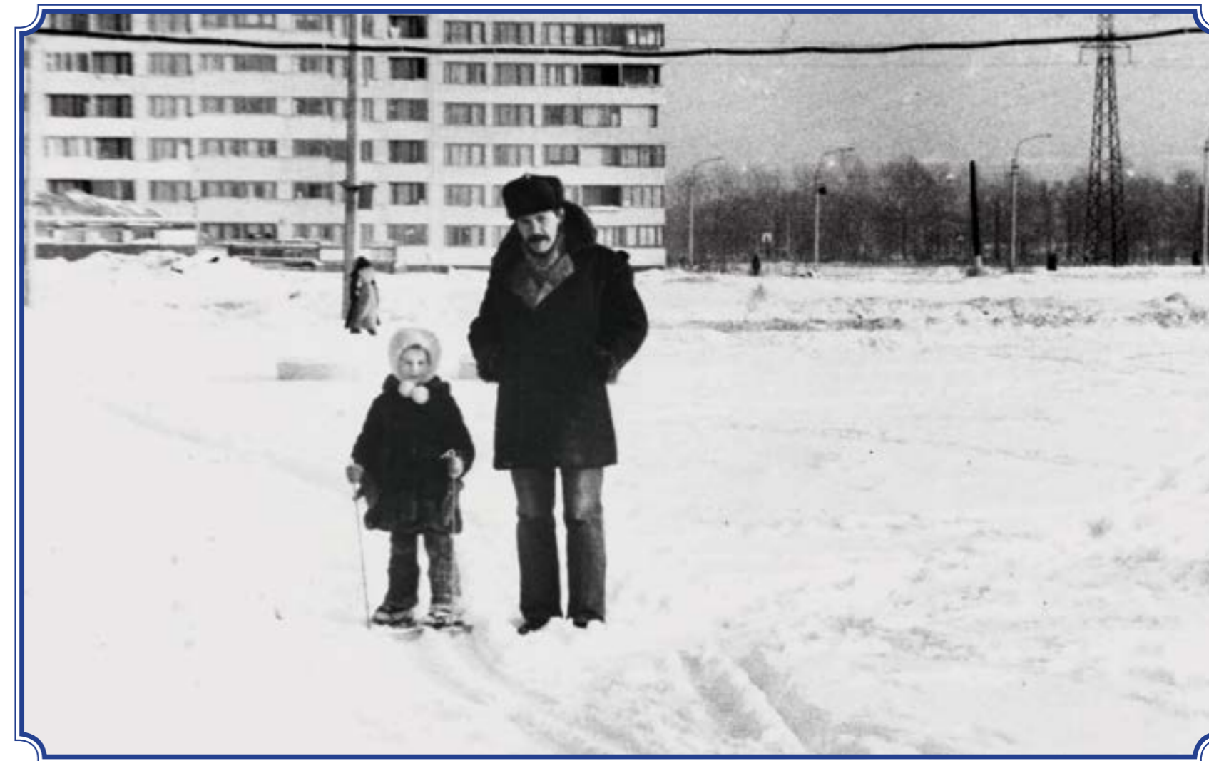
На месте будущего ЗАГСа Красносельского района (угол Петергофского шоссе и ул. Доблести), январь 1989 года