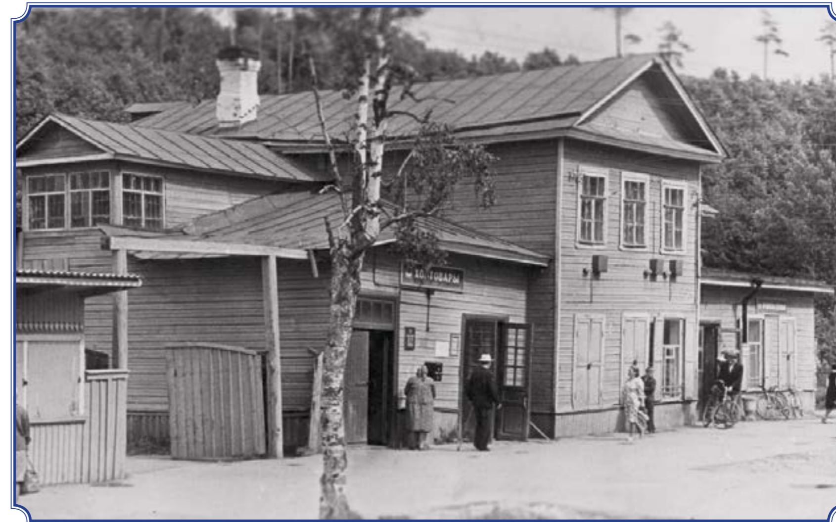
Здание с магазинами (промтовары, хозяйств. товары, продукты) по ул. Советская, 1960-е годы. Фотография со школьной экспозиции школы-интерната №289