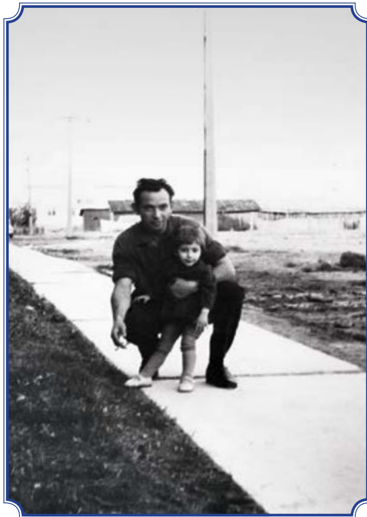
Посёлок городского типа (ПГТ) Горелово, ул. Заречная, д. 10, 1971 год