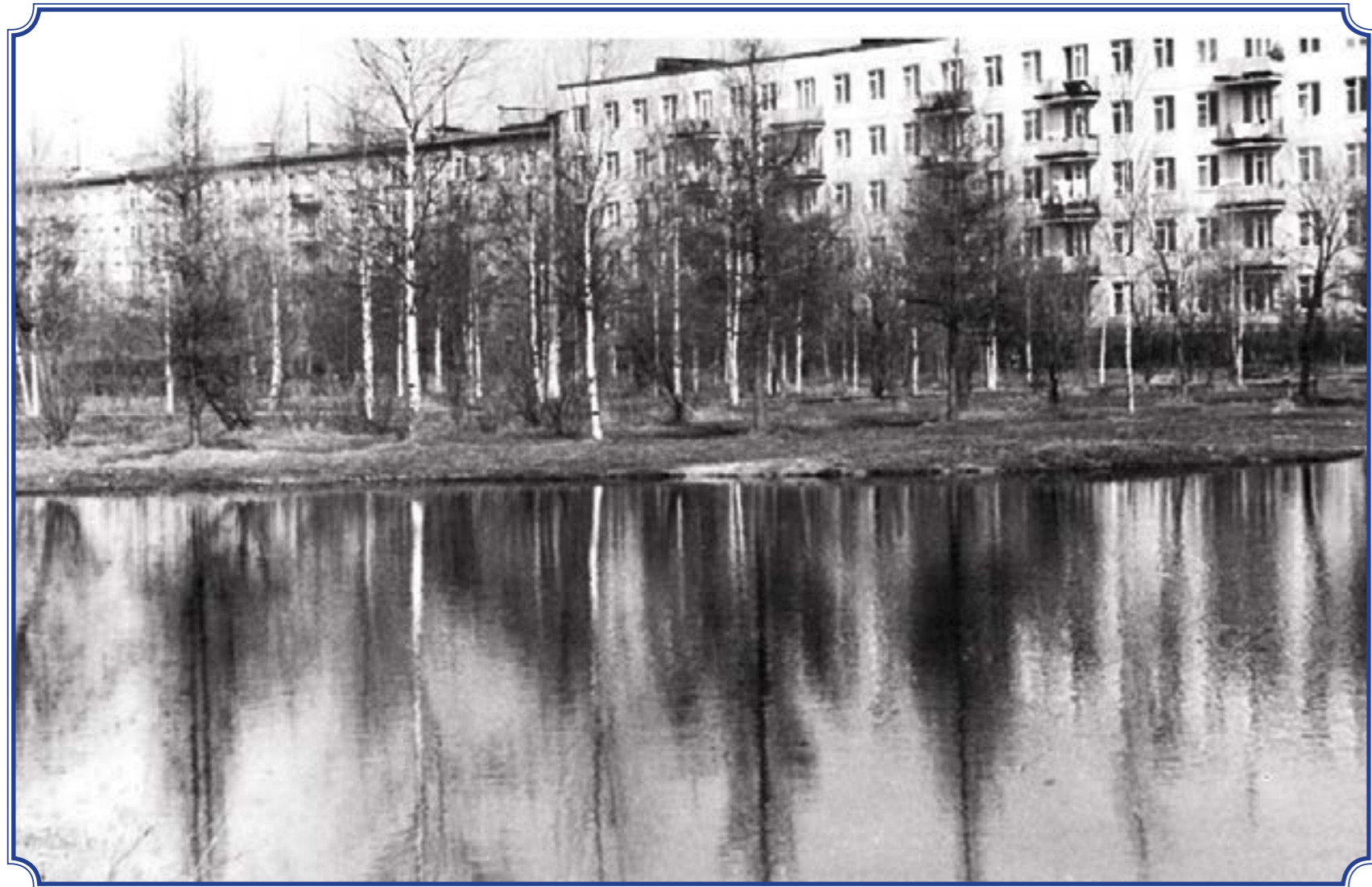
Горелово, первые пятиэтажки, 1970-е годы