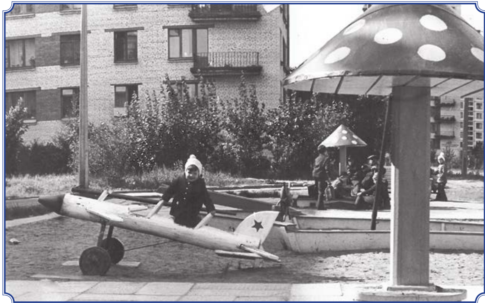
На детской площадке во дворе дома на ул. Пограничника Гарькавого. Сейчас на этом месте новый жилой д. 40, корп. 6, рядом д. 42, 1977 год