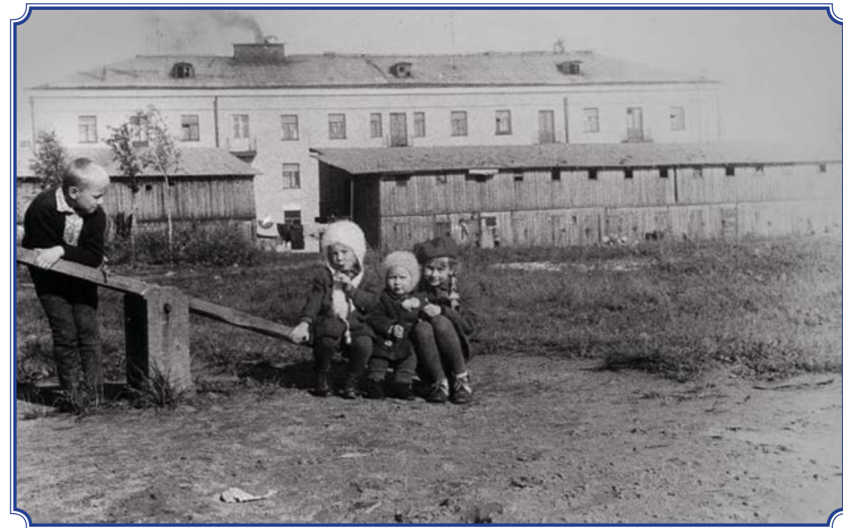
Двор за книжным магазином, пр. Ленина, д. 61. Сараи для дров, в квартирах были деревянные печи. 1967-1968 года