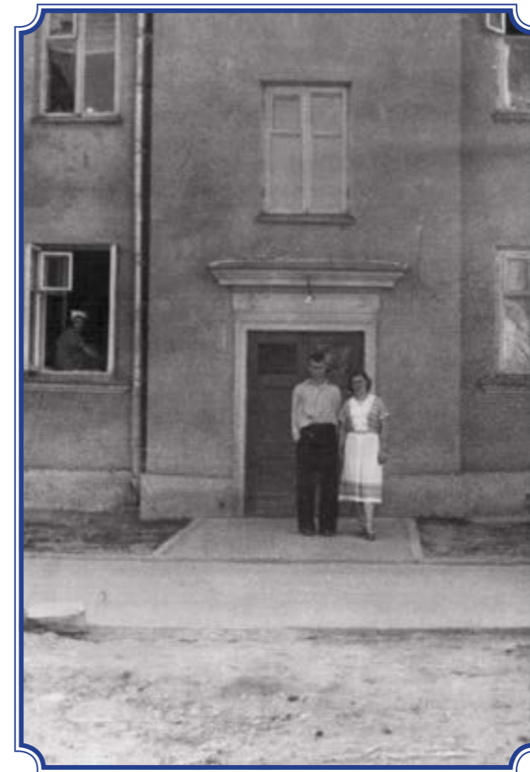
Ул. Лётчика Пилютова, д. 22, корп. 2, 1950-е годы