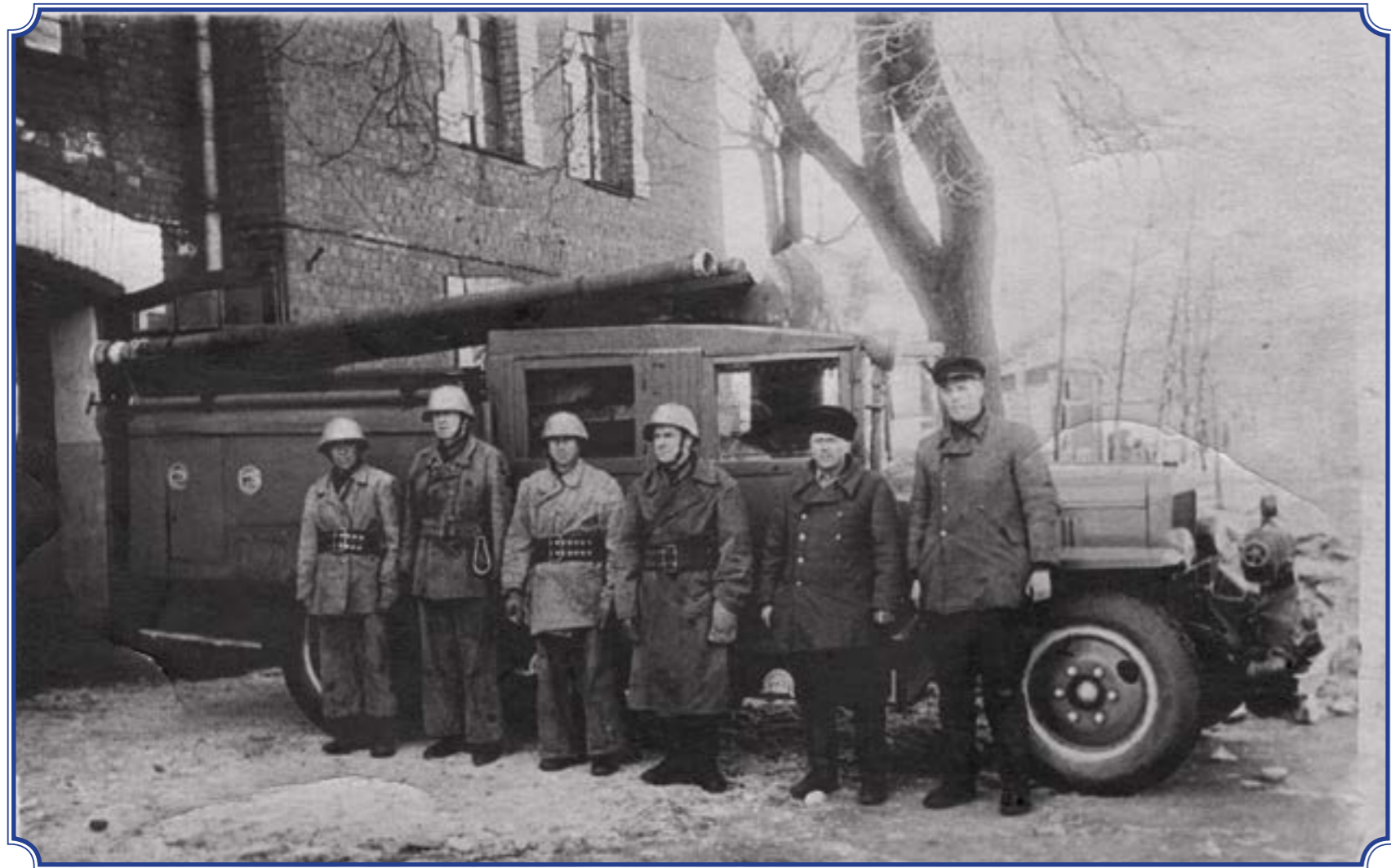
Пожарная часть Красного Села. 1950-е годы