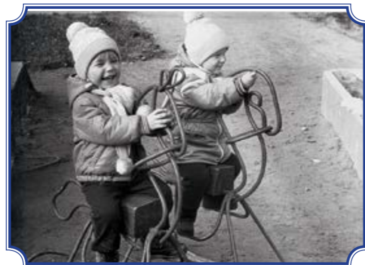
На детской площадке около дома по адресу ул. Маршала Захарова, д. 46, 1988-1989 годы