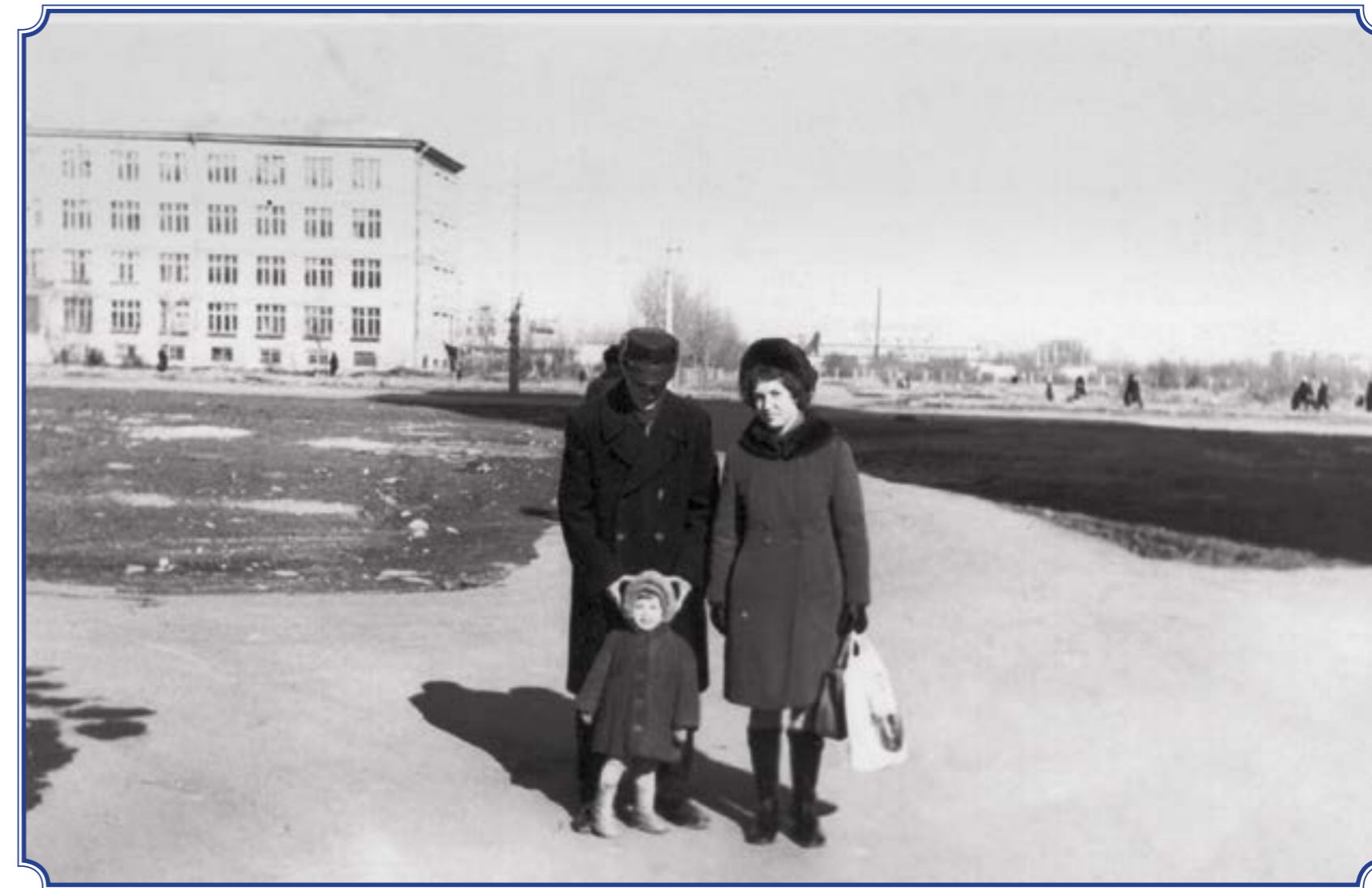
Сосновая Поляна, 1975 год