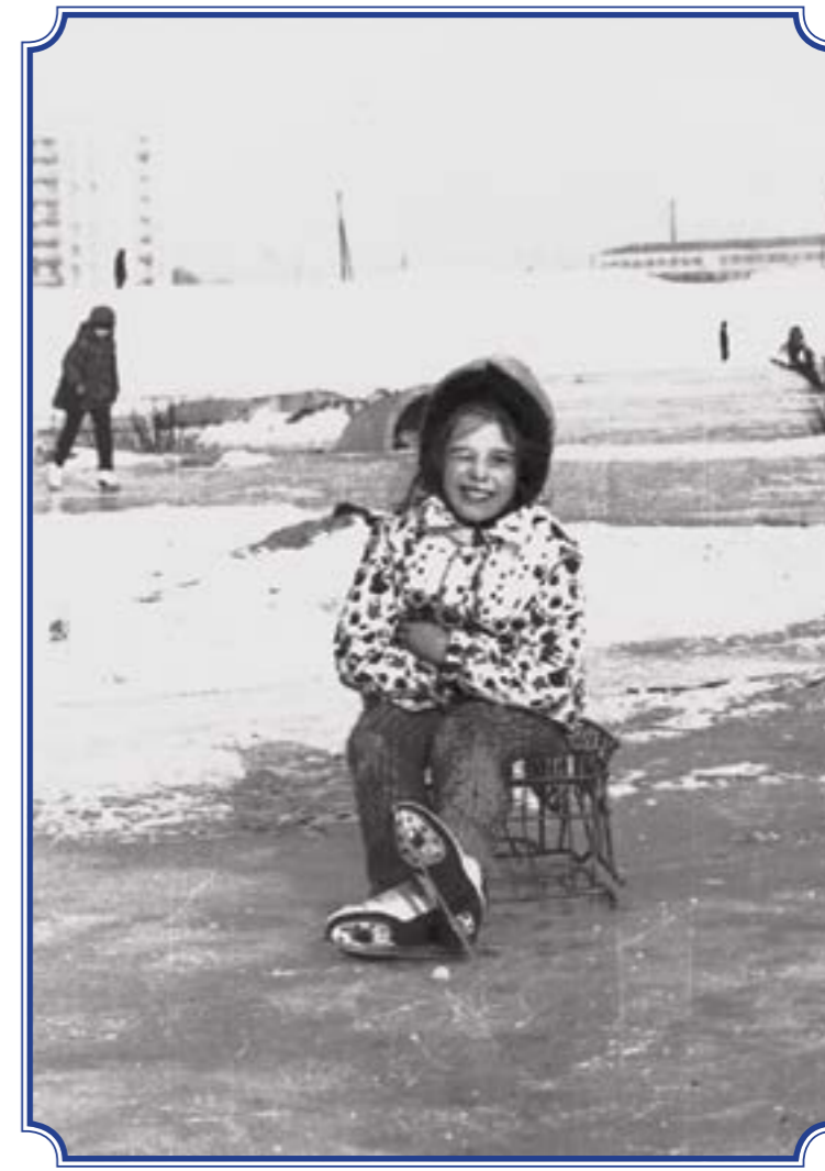
Река Ивановка, ул. Здоровцева, 1981-1982 годы