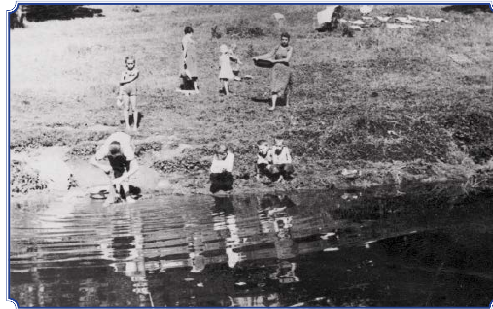
Стирка белья на пруду. Театральная долина. Дудергоф, 1960-е годы Фотография со школьной экспозиции школы-интерната №289 Фото предоставила Мария Михайловна Воскресенская