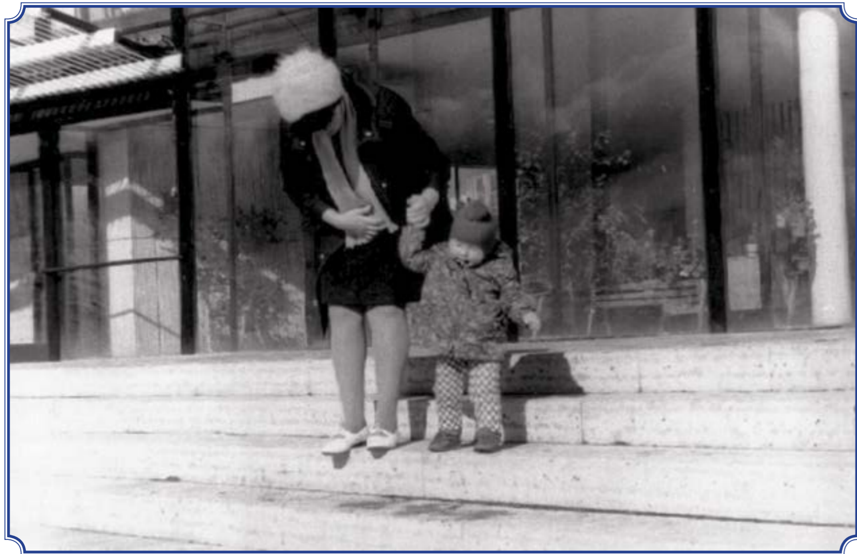
У кинотеатра «Рубеж», 1975 год