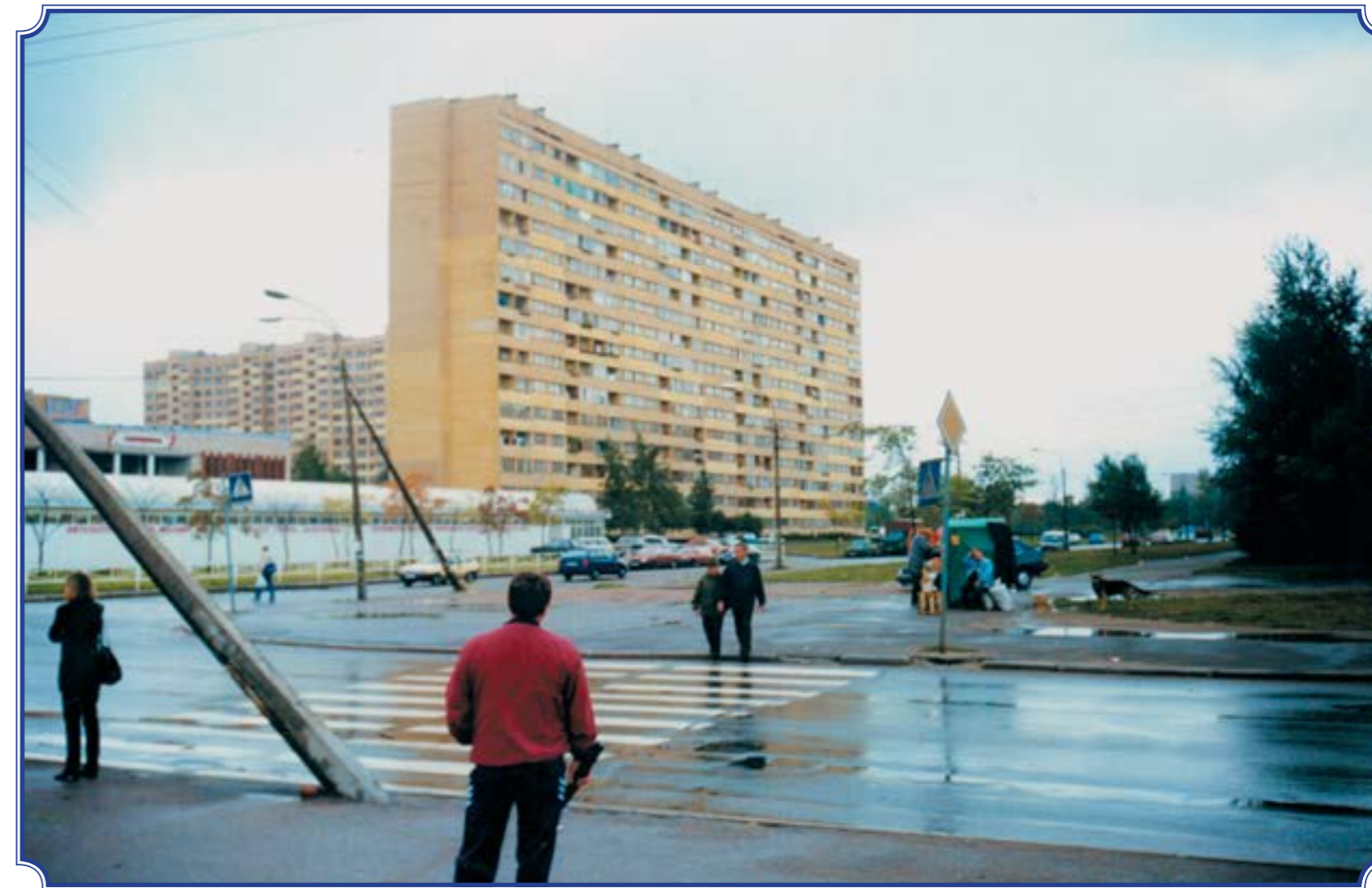
Угол пр. Кузнецова и ул. Рихарда Зорге, конец августа 1999 года