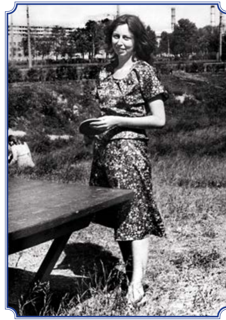
Овраг у реки Ивановки, начало 1980-х годов