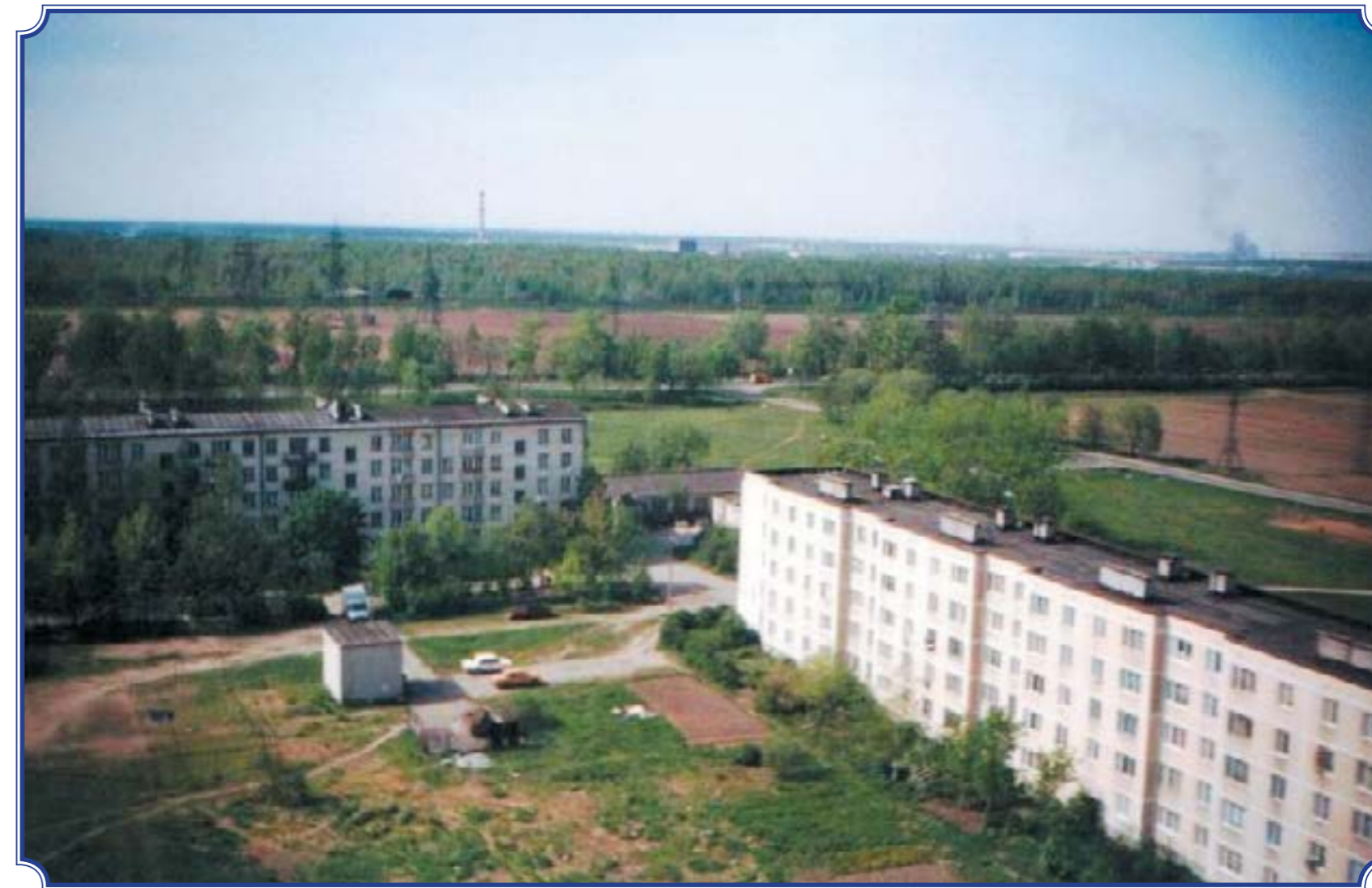
Горелово, 1984 год