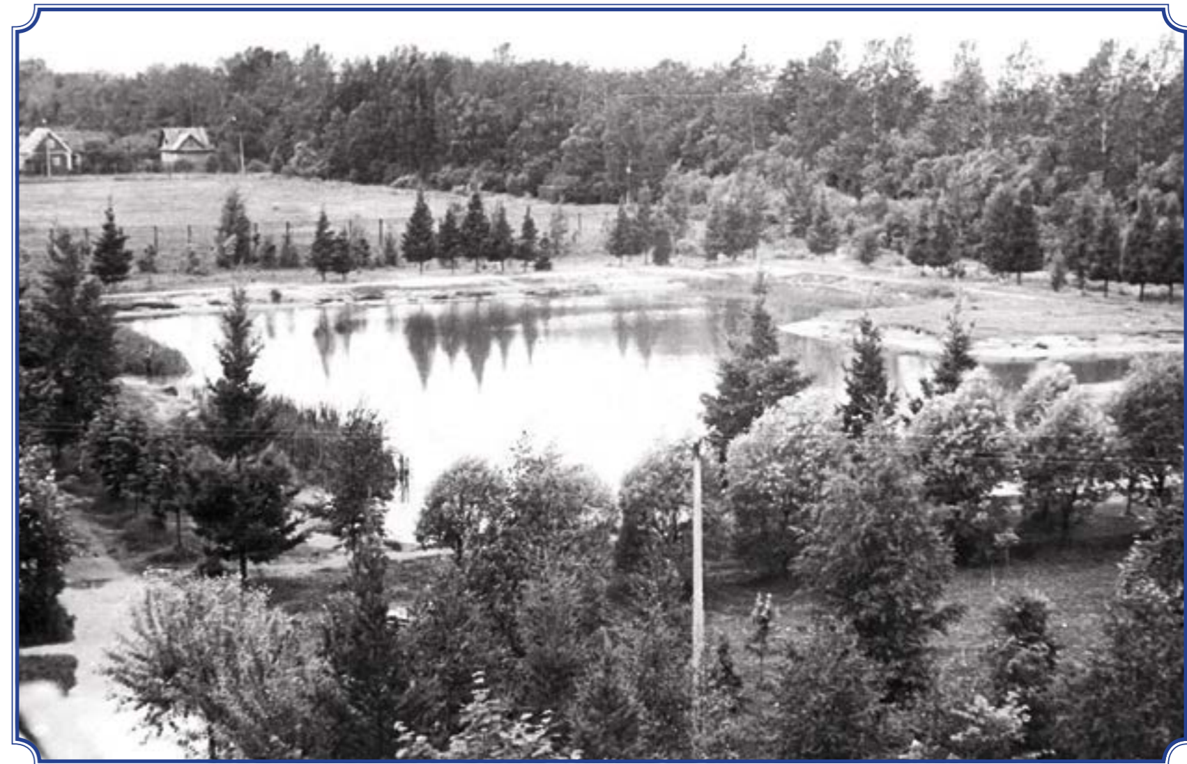
Горелово, пруд, 1970-е годы