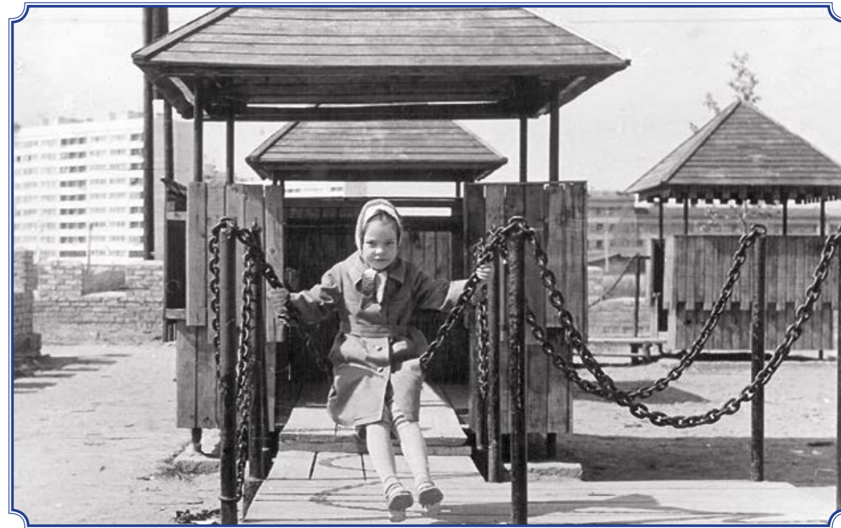
Детская площадка на углу ул. Добровольцев и ул. Отважных, 1983 год Не сохранилась в этом виде