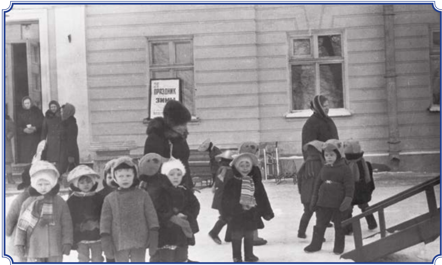
Детский сад Красносельской бумажной фабрики, 1969-1970 года