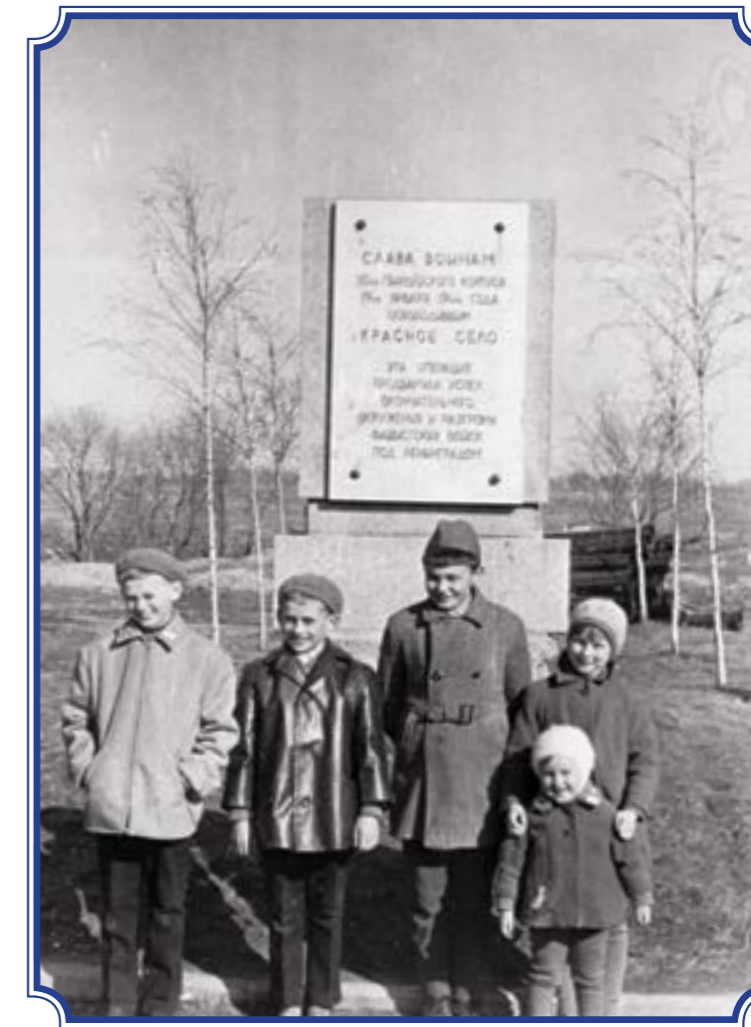
Сквер у Троицкой церкви на площади. Позже эта доска висела на доме по адресу пр. Ленина, д. 75, 1969 год