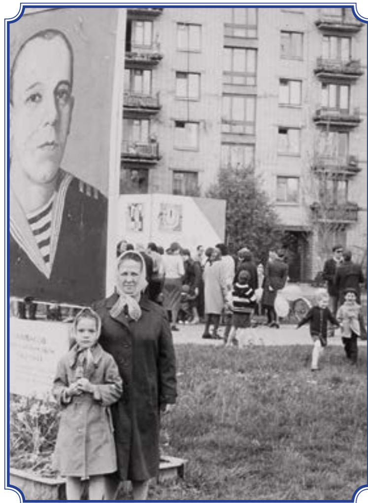
На углу ул. Тамбасова и пр. Ветеранов, 9 мая 1983 год