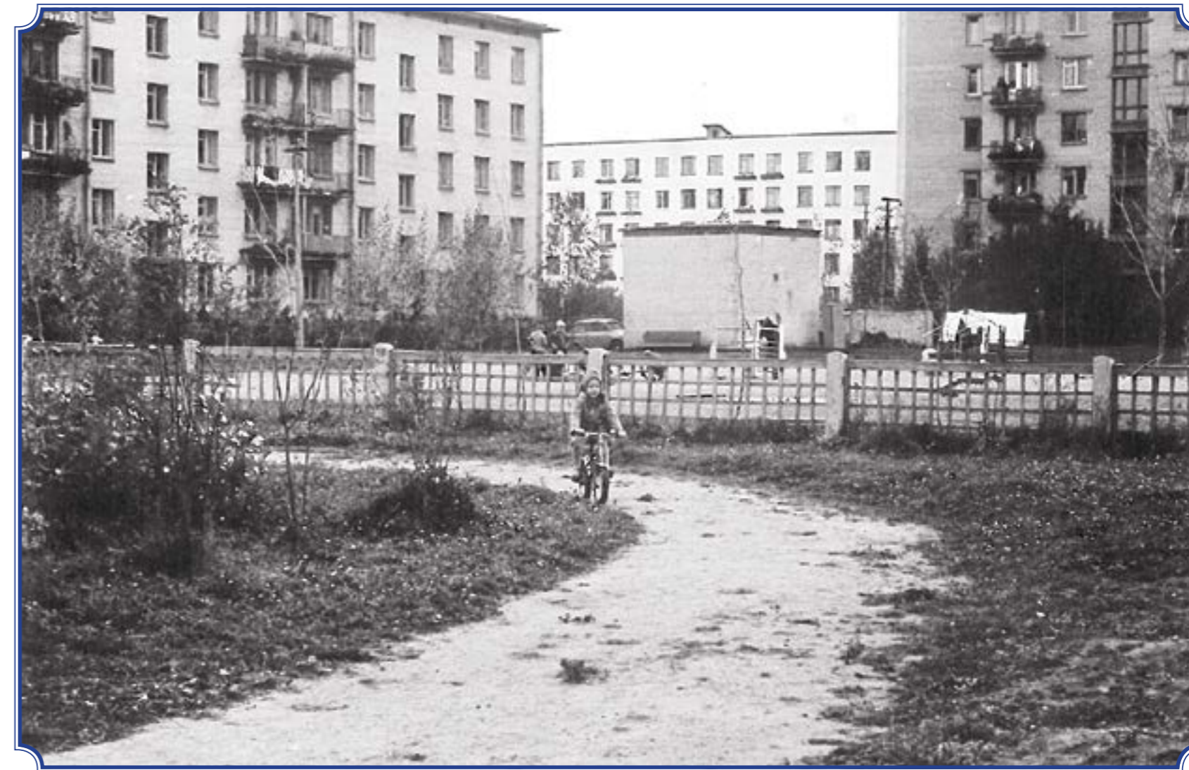
Во дворе садика №27, ул. Тамбасова, д. 28, 1980 год