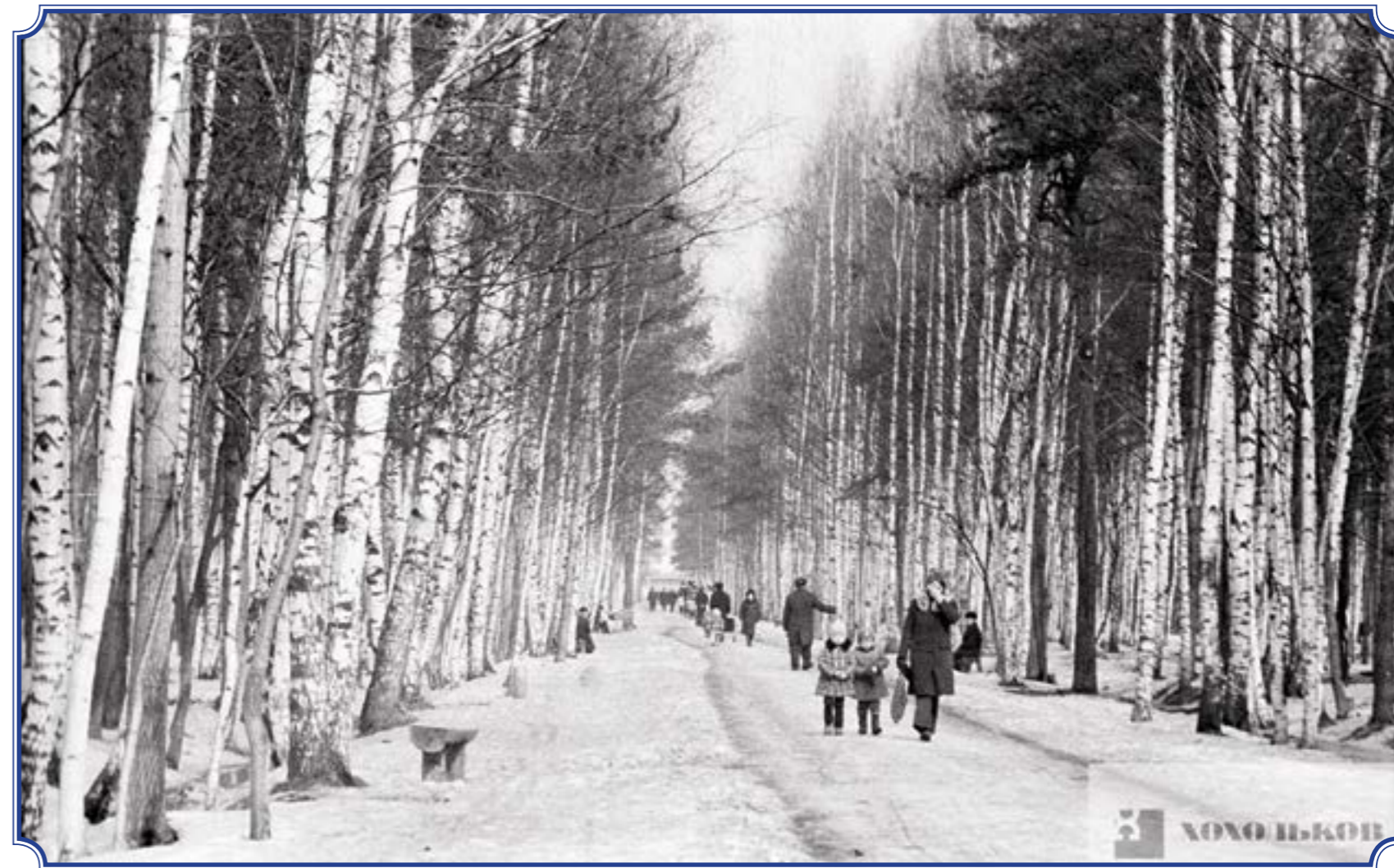
Парк «Сосновая Поляна», 1980-е годы