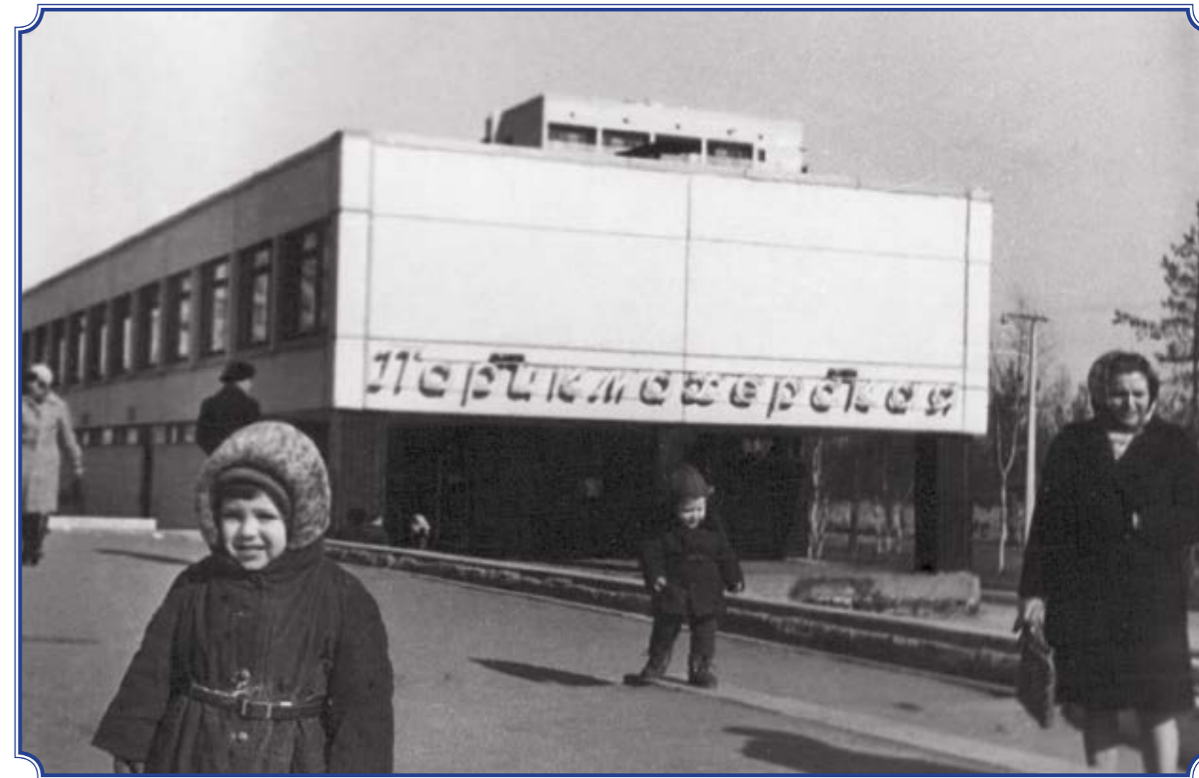
Пр. Ветеранов, д. 147, 1975 год