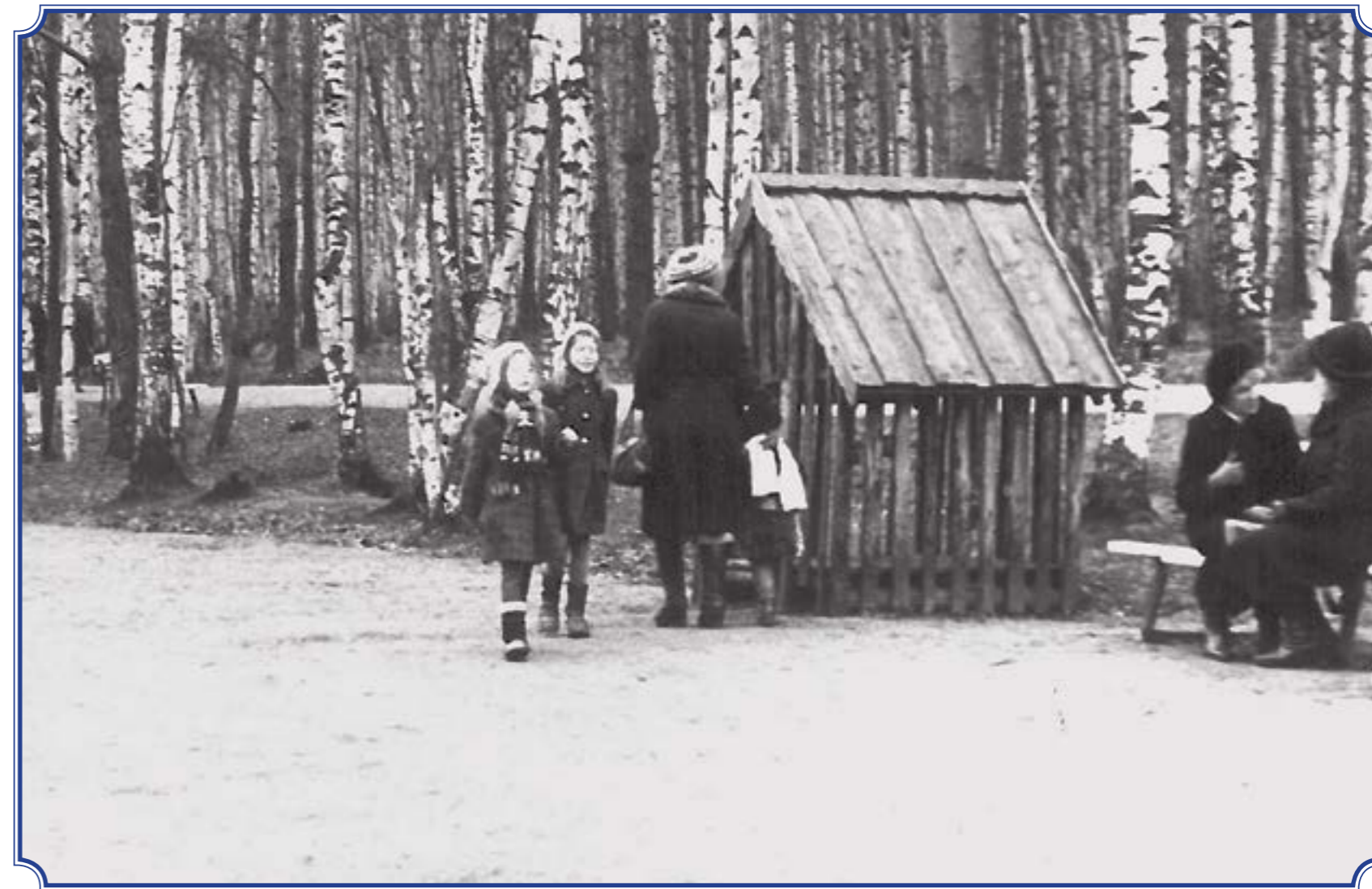
Детская площадка в парке «Сосновая Поляна», 1983 год. Не сохранилась до наших дней