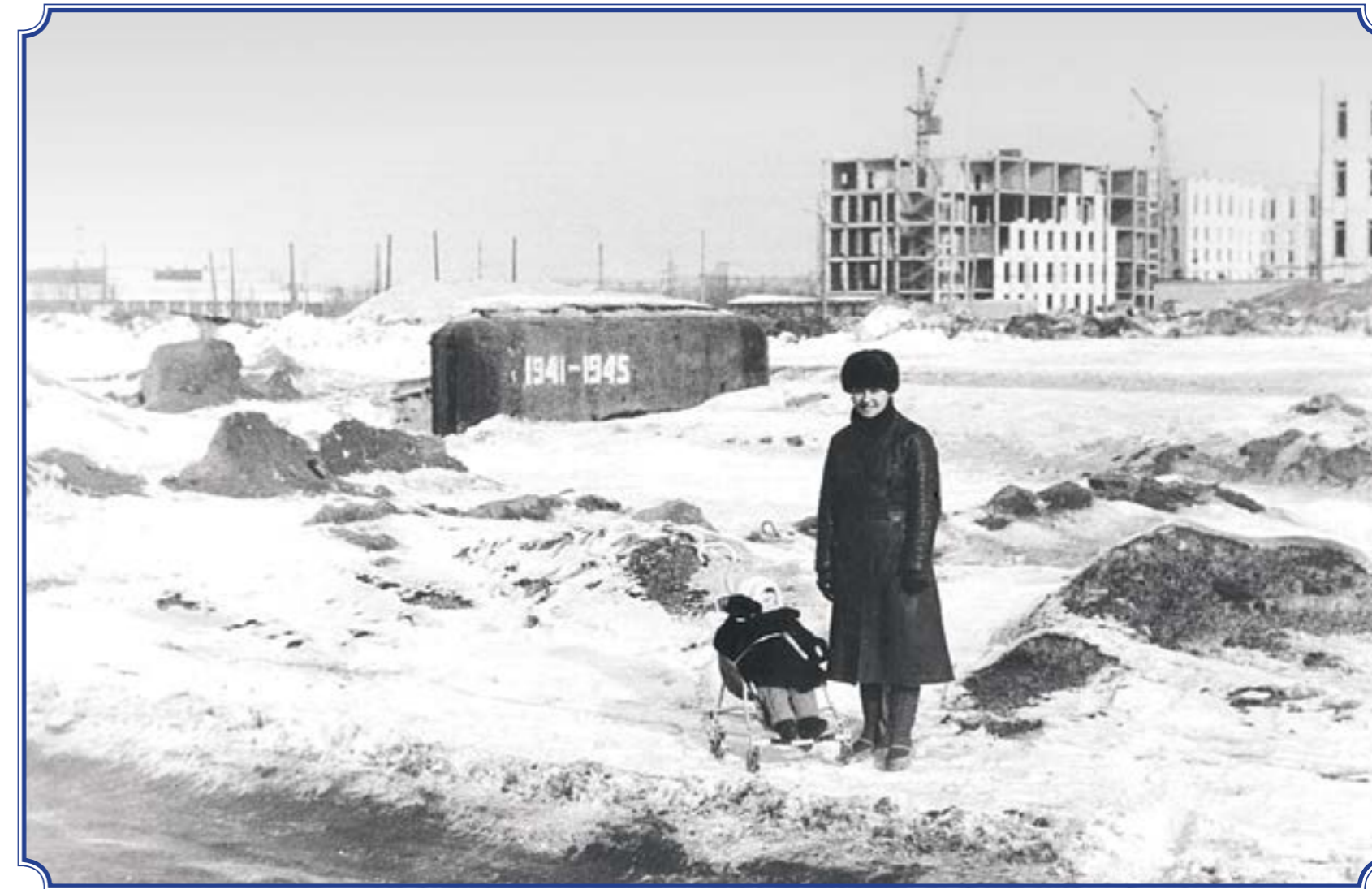
Ленинский пр., Дот (Кировский район), 1986-1988 года