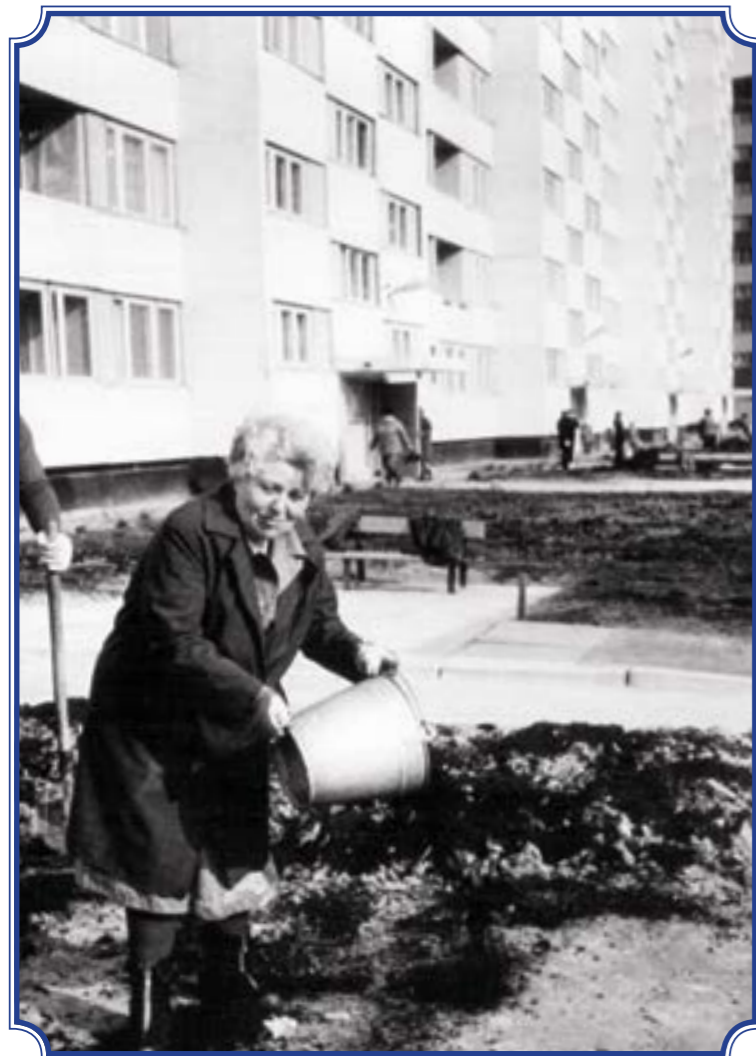
На субботнике около дома по адресу ул. Маршала Захарова, д. 17 корп. 2, весна 1983 года