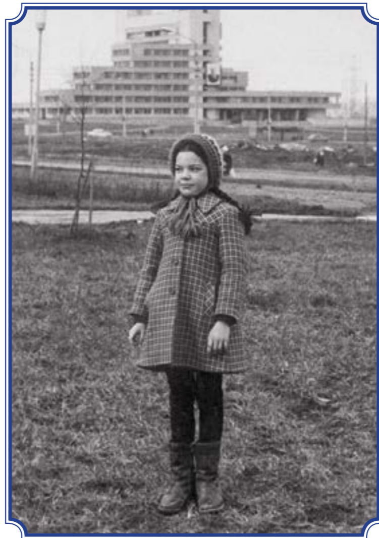
Пустырь недалеко от здания администрации Красносельского района, 1985 год