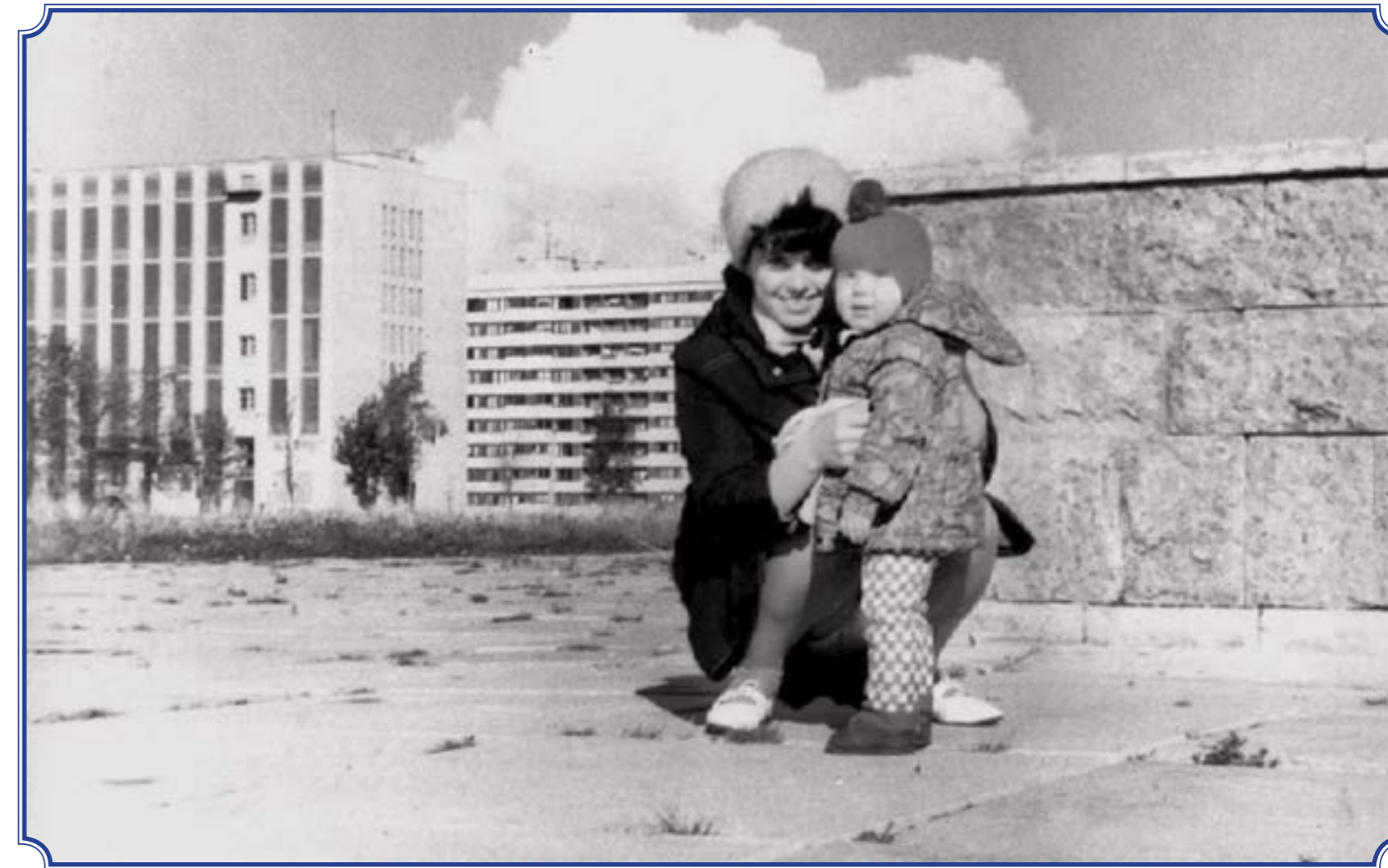
У кинотеатра «Рубеж», 1975 год