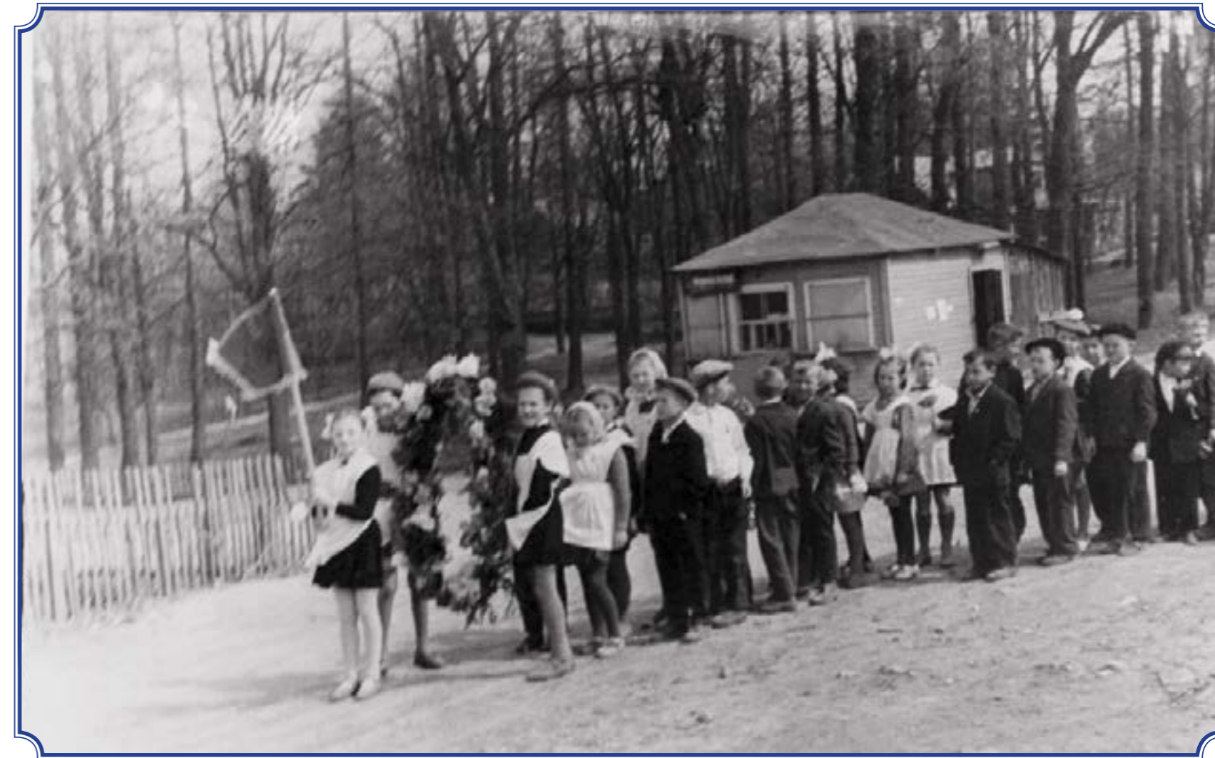
Колонна школьников на фоне продуктового ларька и Дома учителей на пр. 25 Октября, 1960-е годы. Фотография со школьной экспозиции школы-интерната №289

Фото предоставила Нина Сергеевна Эшимова