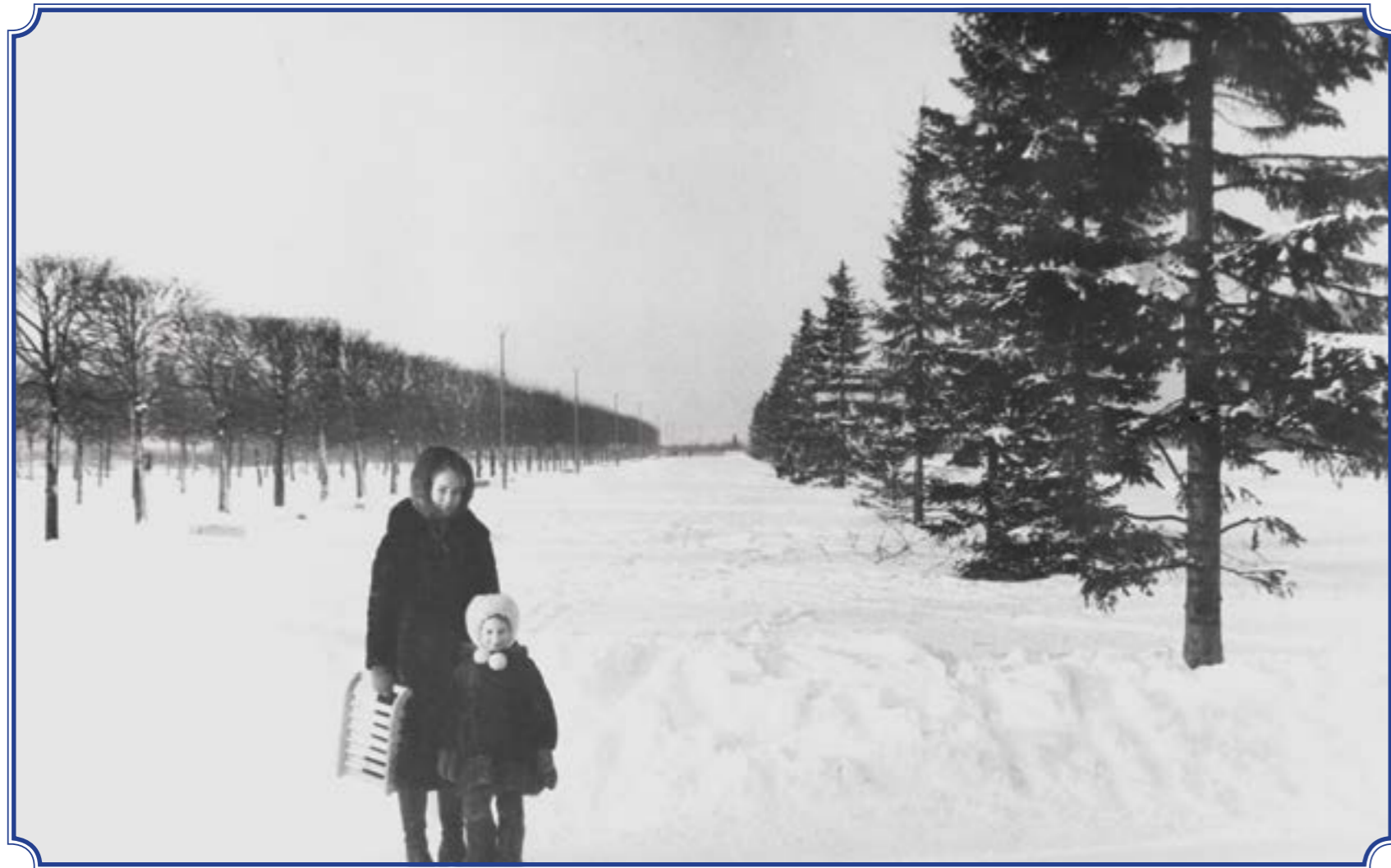
Прогулка по аллее Южно-Приморского парка им. В.И. Ленина (на месте парка аттракционов «Планета лета»), январь 1989 года