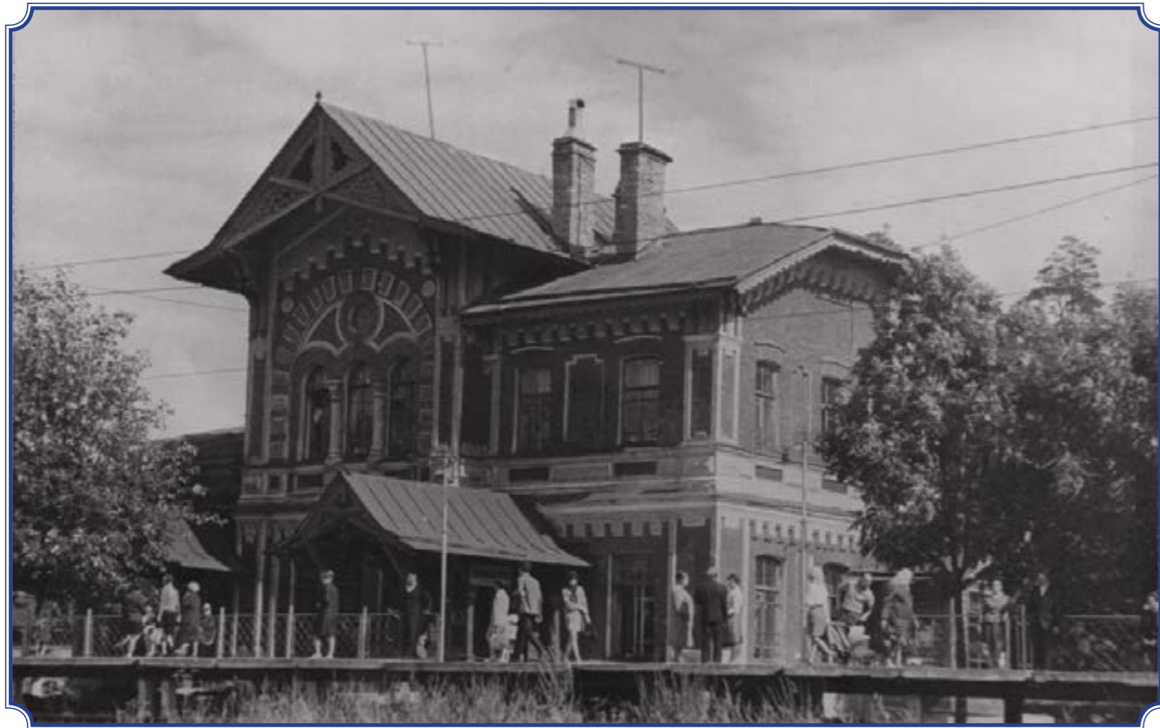
Здание вокзала, платформа Дудергоф, 1960-е годы. Фотография со школьной экспозиции школы-интерната №289