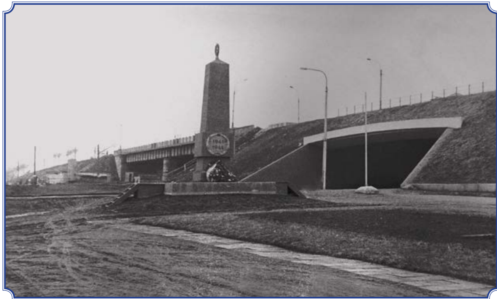
Путепровод через пр. Народного Ополчения и Мемориал «Кировского вала» до реконструкции 1979 года. Вид со стороны набережной реки Дудергофки от бокового проезда пр. Маршала Жукова