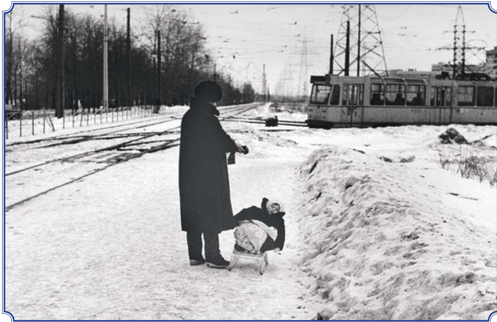
Петергофское шоссе, около 1988 года