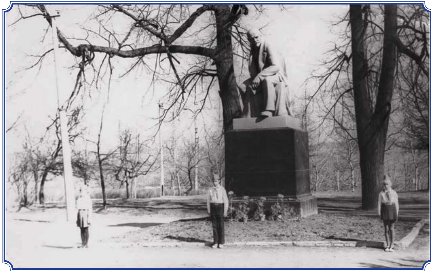
Памятник В.И. Ленину в парке, пионеры стоят в карауле, 22 апреля 1978 года