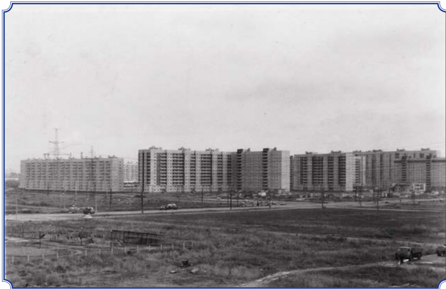
Вид на угол Ленинского пр. и ул. Десантников из дома 79, корп. 2, осень 1991 года