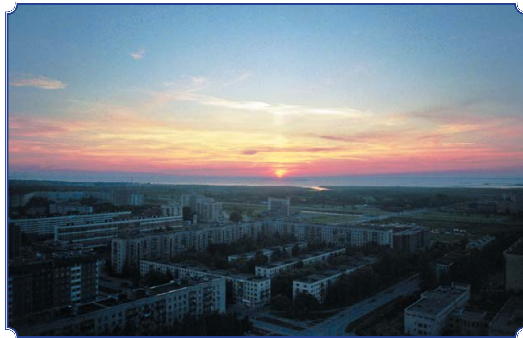
Съёмка с трубы котельной на ул. Авангардной, июль 2001 год