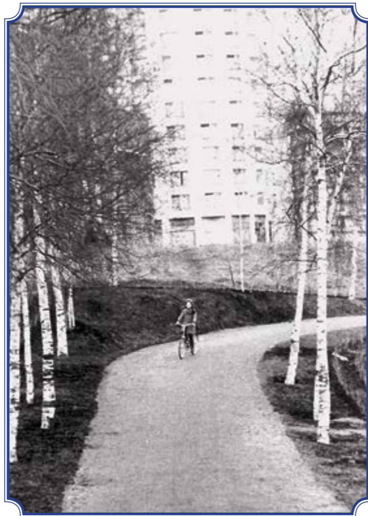
Аллея Славы, апрель 1985 года