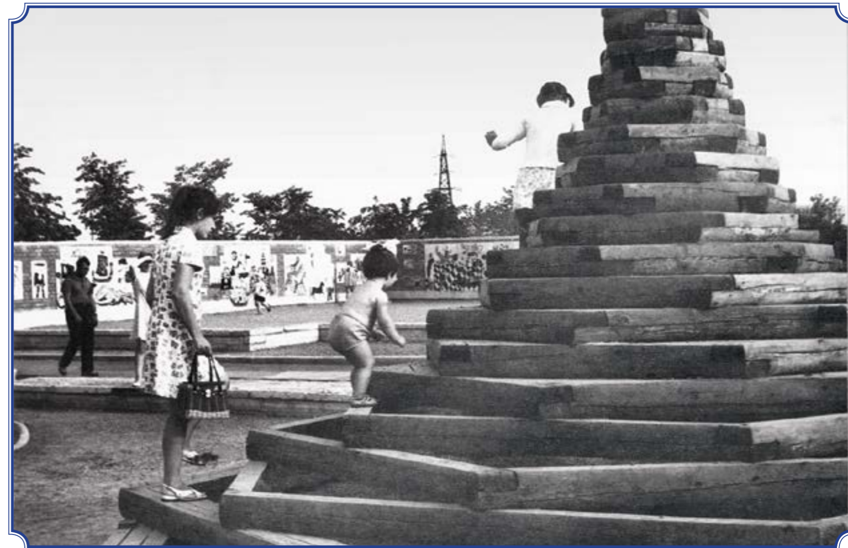
Южно-Приморский парк им. В.И. Ленина, 1980-е годы