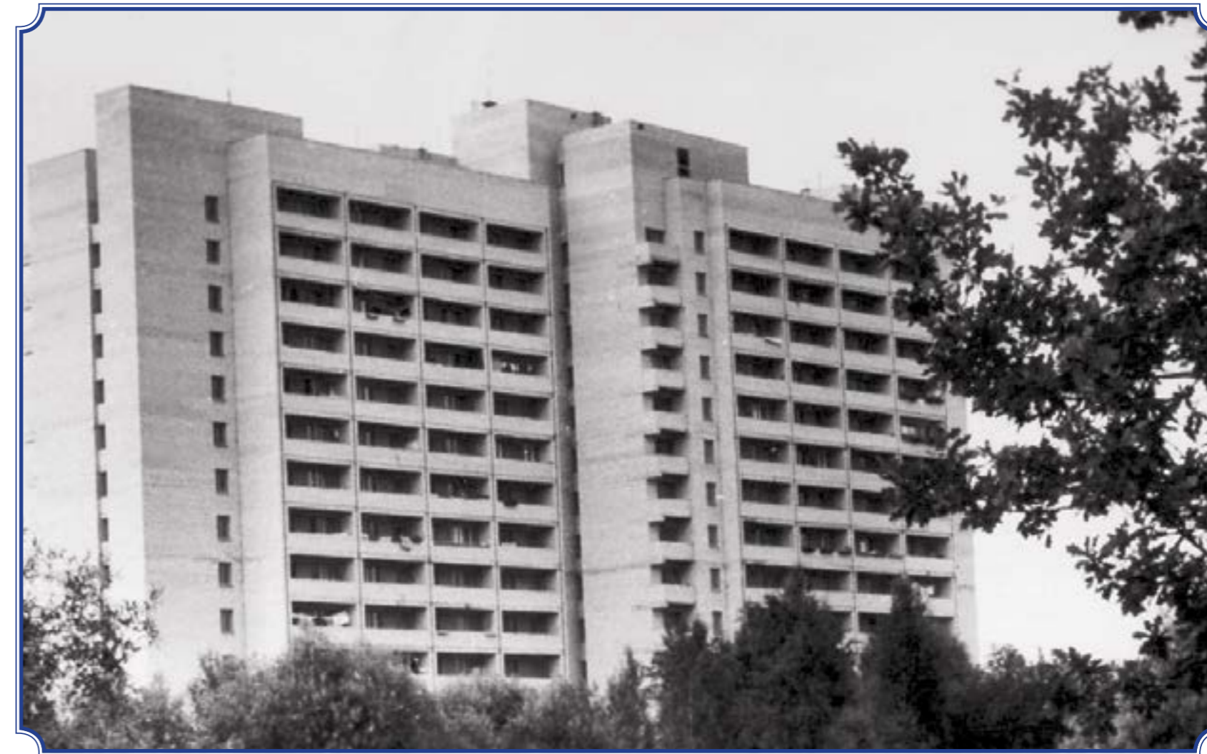
Вид с аллеи Славы на дом, пр. Ветеранов, д. 118, корп. 1