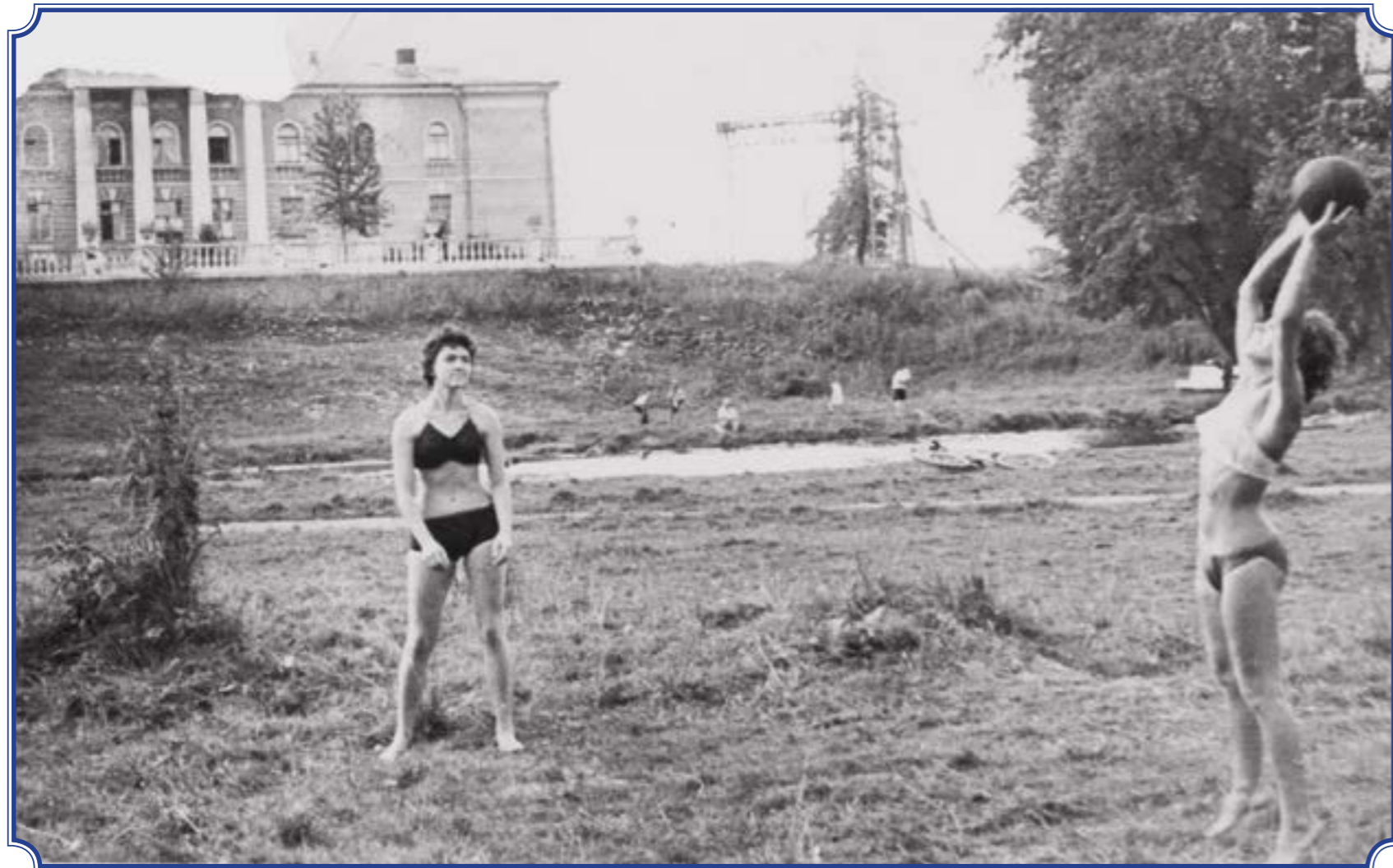
В парке «Знаменка», 1960-1962-е годы