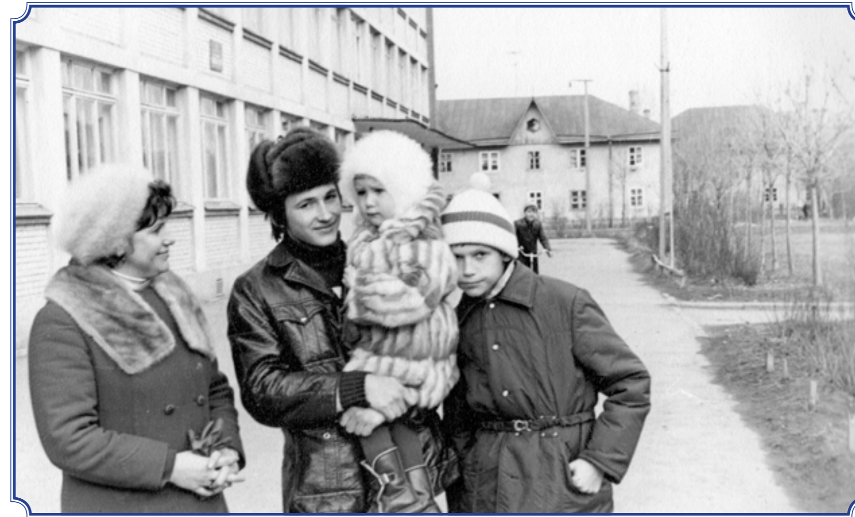
Снимок сделан по адресу ул. Пограничника Гарькавого, д. 46, корп. 4, 285 школа, 1975 год