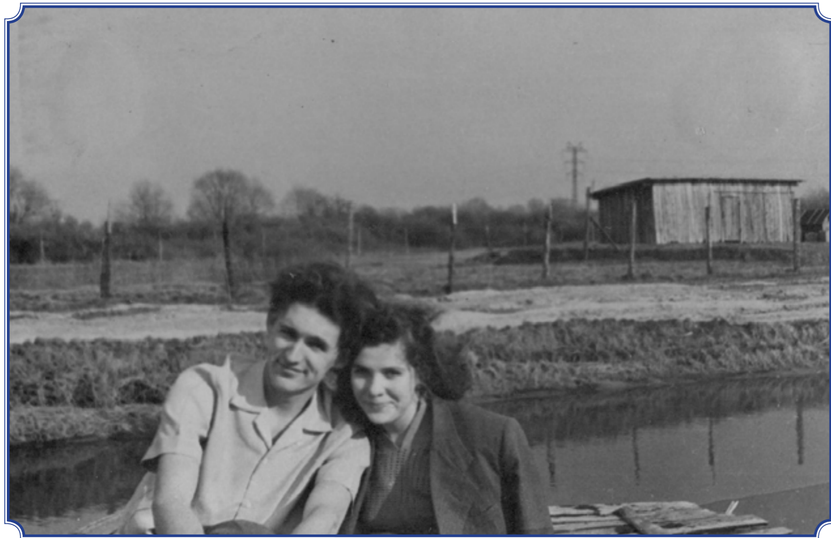
Матисов канал, 1959 год