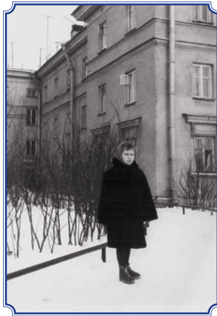
Ул. Лётчика Пилютова, д. 16, корп. 2

Фото предоставила Тамара Николаевна Филатова