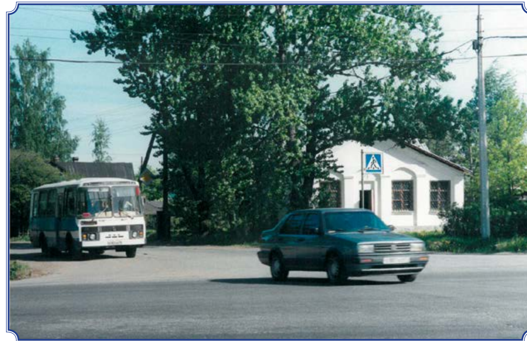
Перекресток Аннинское шоссе – Таллинское шоссе, 1995 год