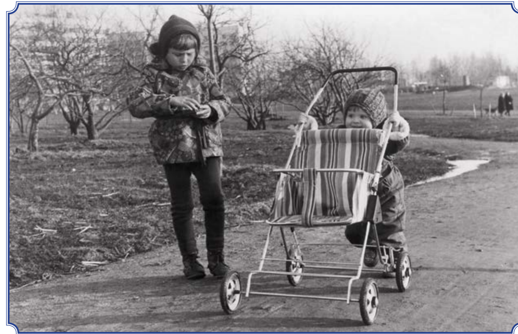
Аллея Славы