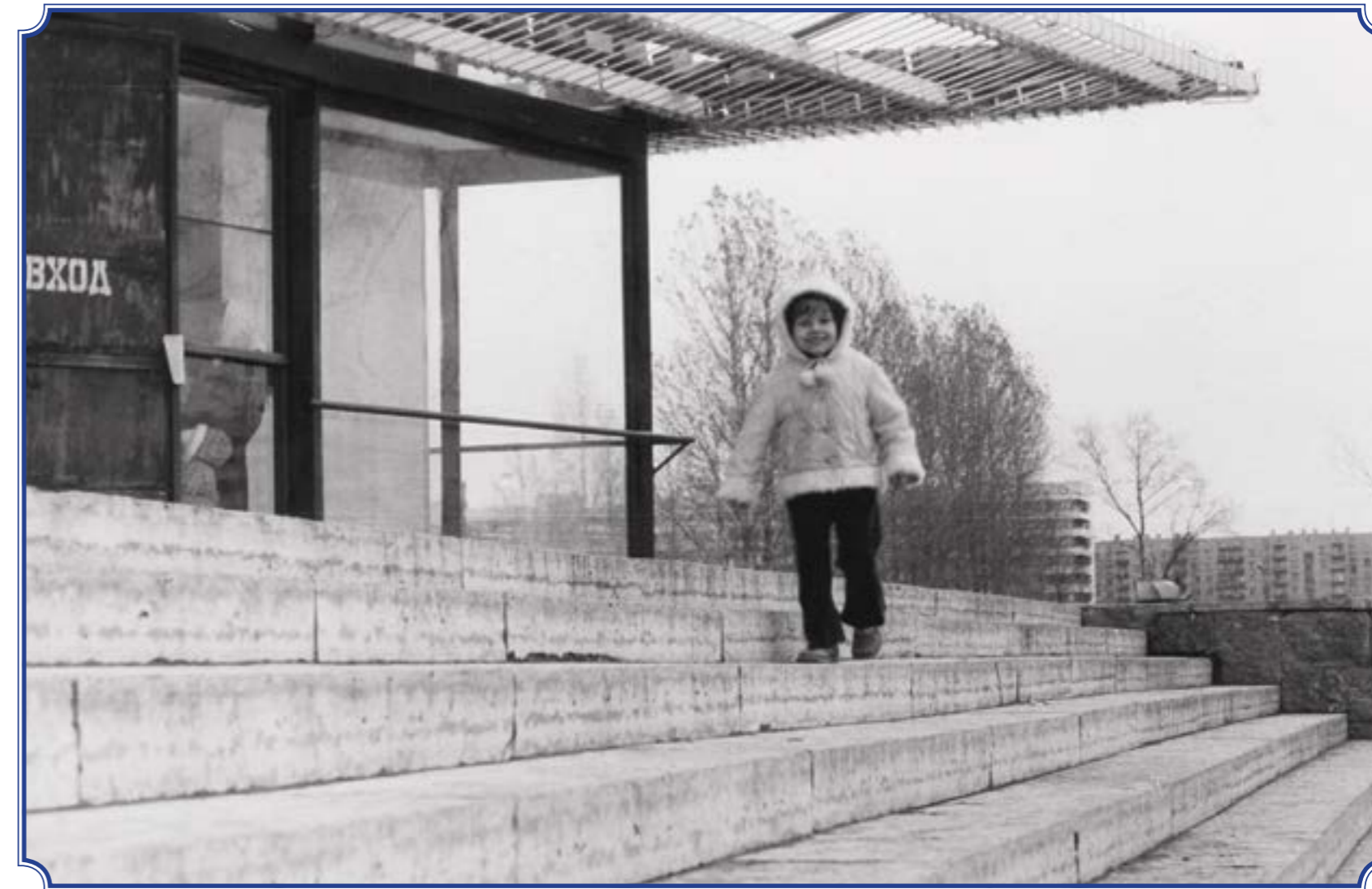
Ступеньки кинотеатра «Рубеж», октябрь 1979 года