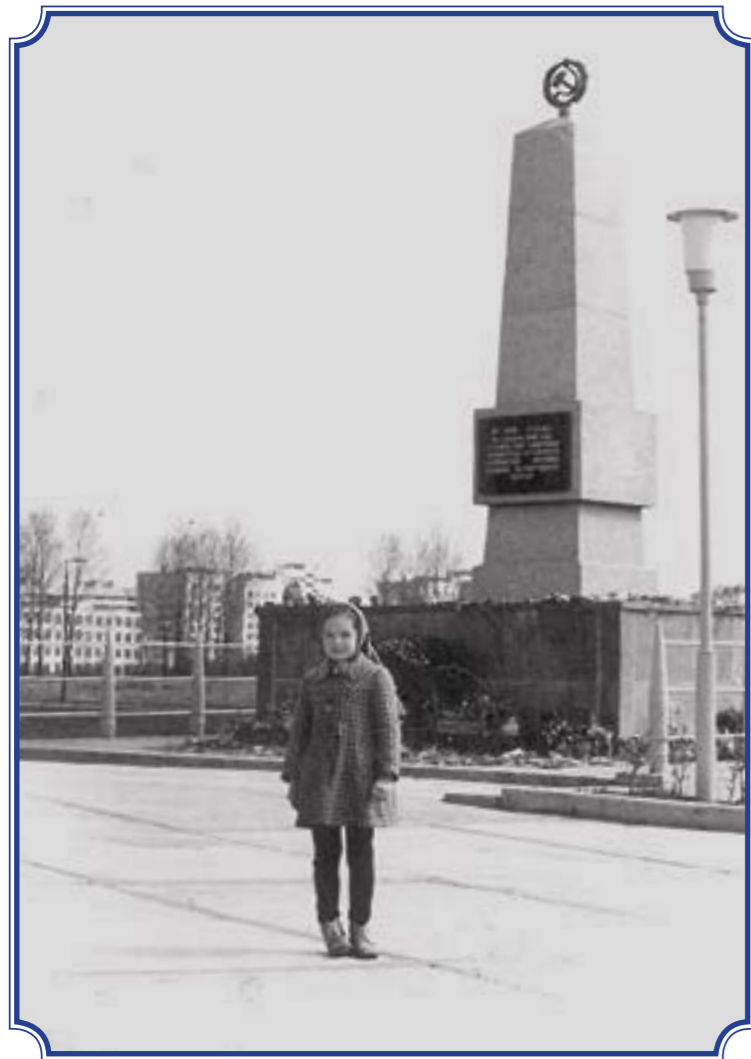
Обелиск воинского захоронения «Лигово», май 1985 год