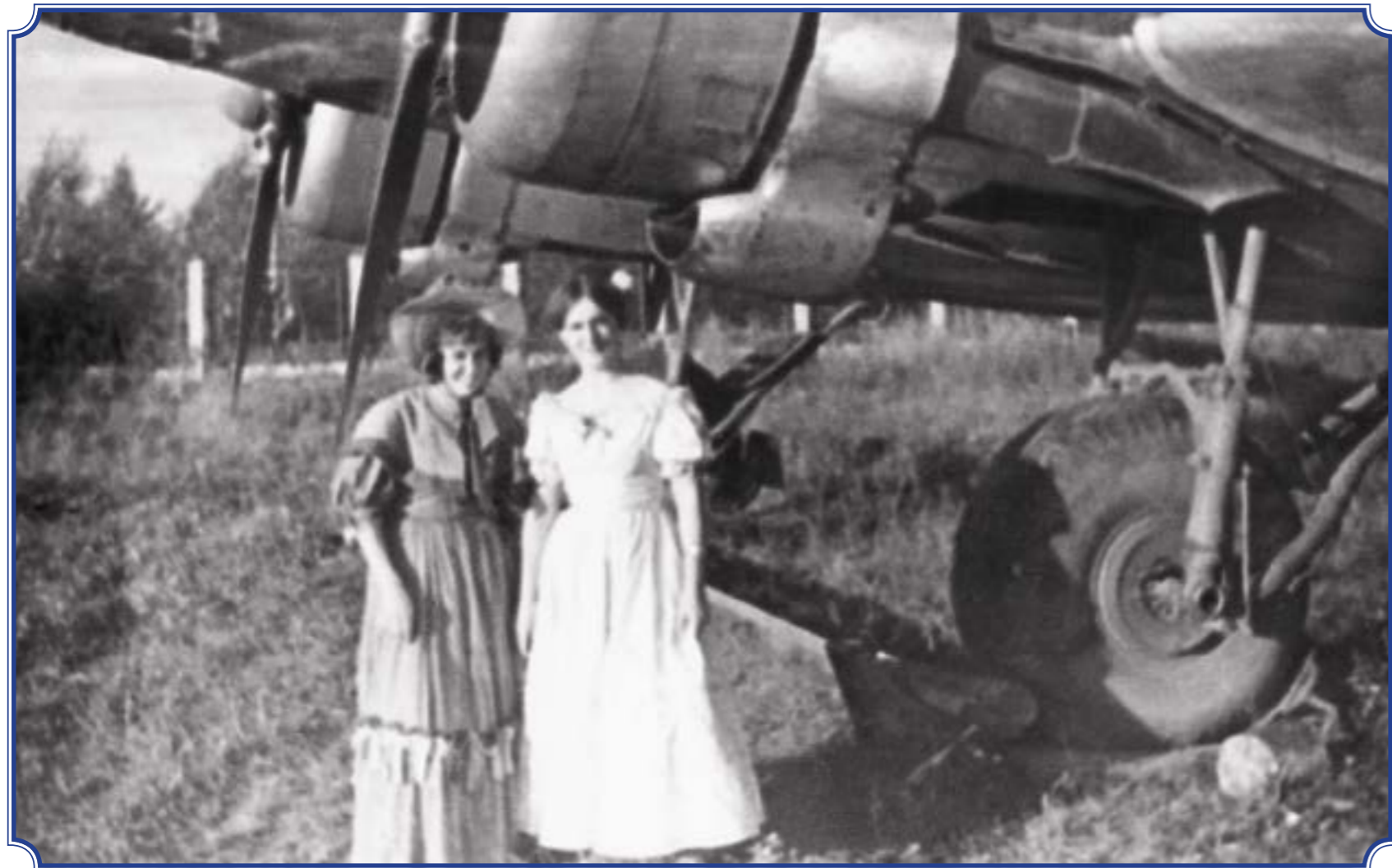
«Ленфильм», ул. Тамбасова, д. 5 В Съёмки фильма «Три толстяка», 1965 год