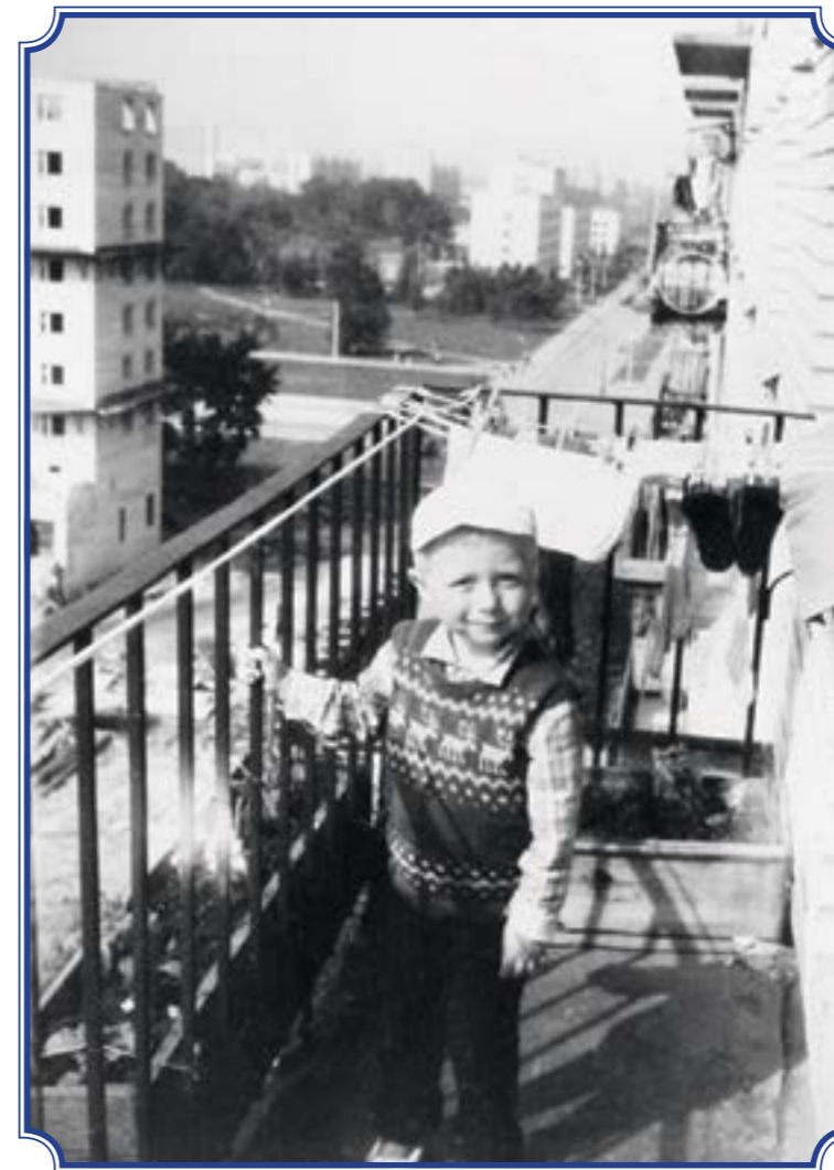
Ул. Партизана Германа, д. 14, 1984 год