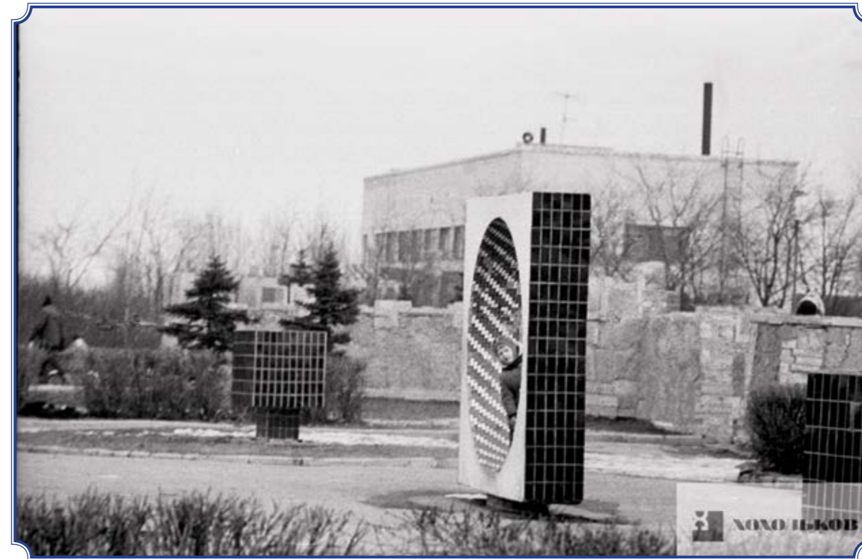
Южно-Приморский парк им. В.И. Ленина, 1980-е годы