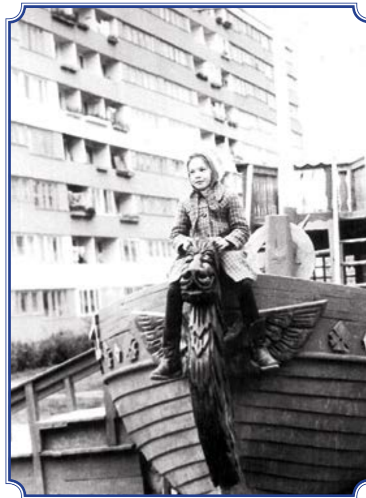
Детская площадка между домами 8, корп. 4 и 4, корп. 2В по ул. Тамбасова, 1984 год Не сохранилась до наших дней.