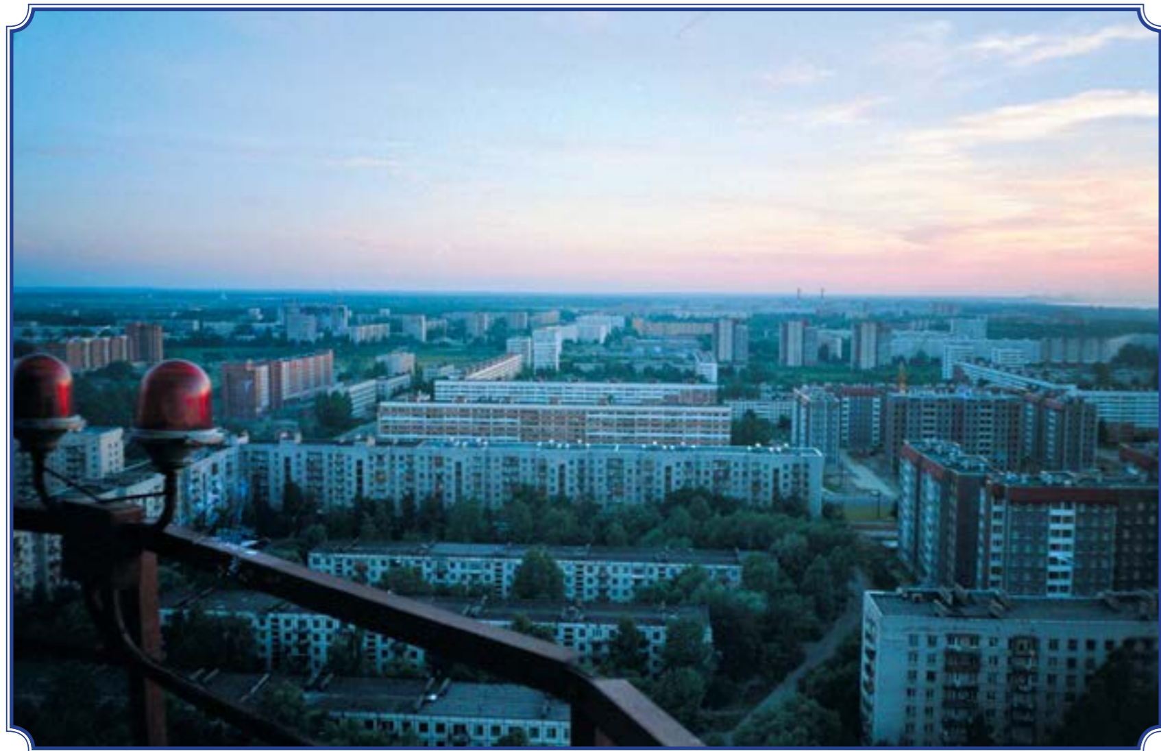
Съёмка с трубы котельной на ул. Авангардной, июль 2001 год