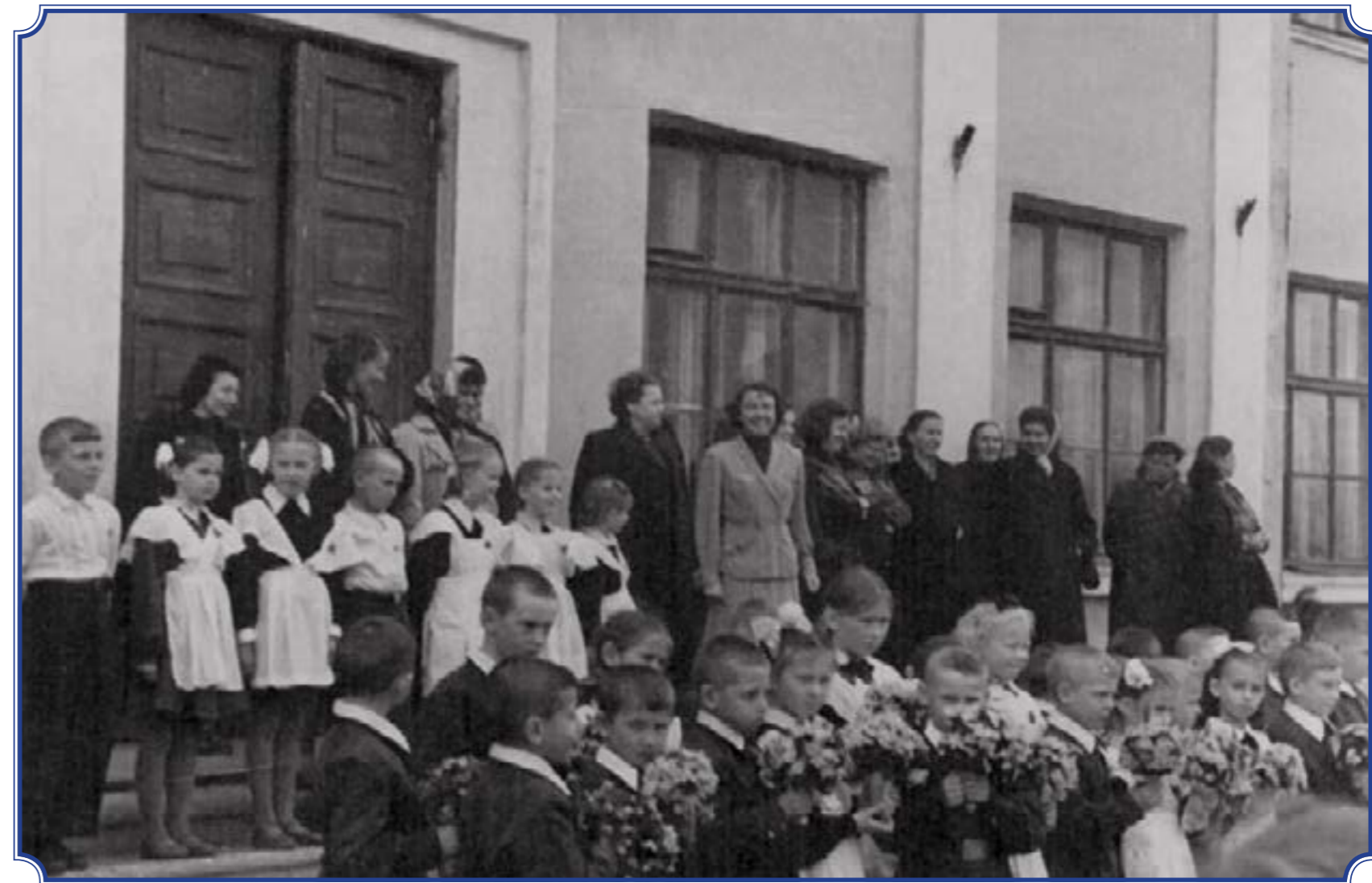
ПГТ Горелово Военный городок, старая школа 1 сентября, конец 1950-х годов