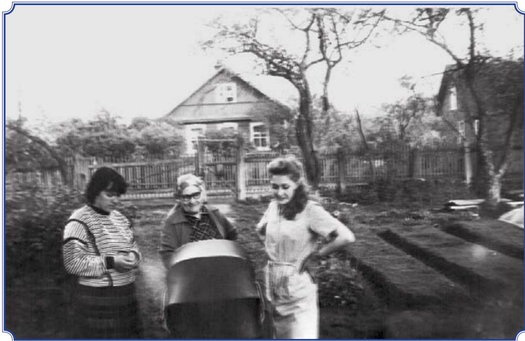
Горелово, ул. Школьная, д. 26, 1986 год