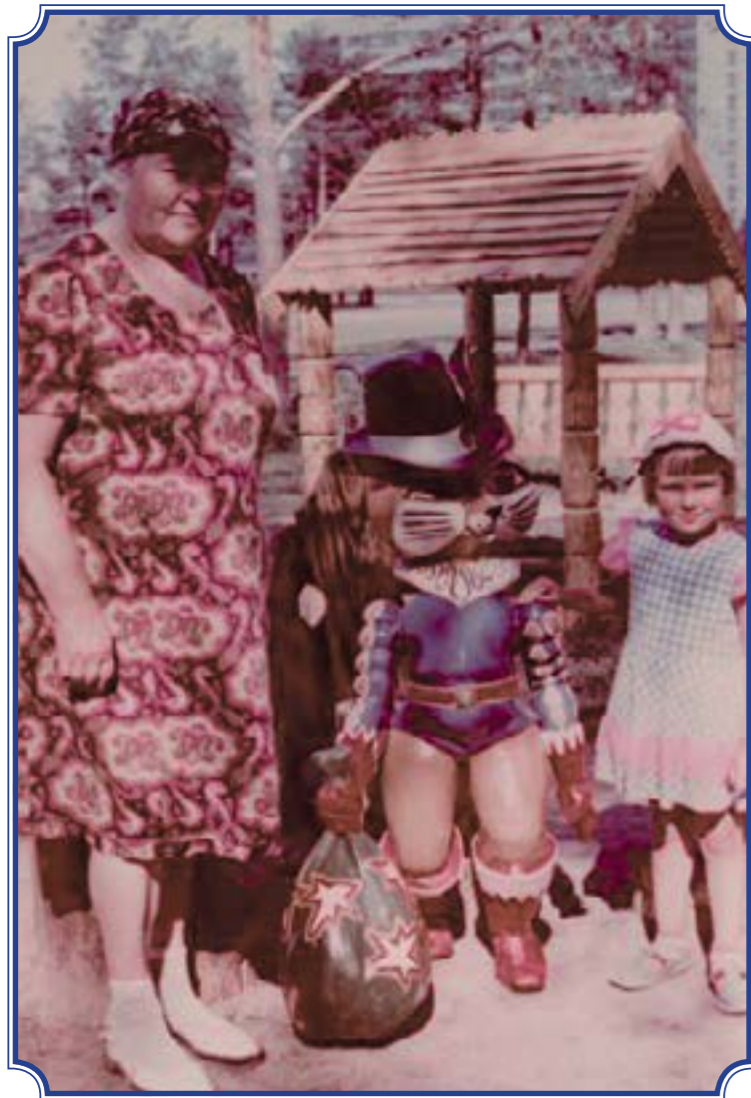
Парк «Сосновая Поляна», 1989-1990-е годы