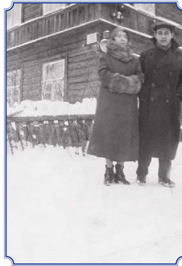
Дом в Лигово, ул. Урицкого, д. 83