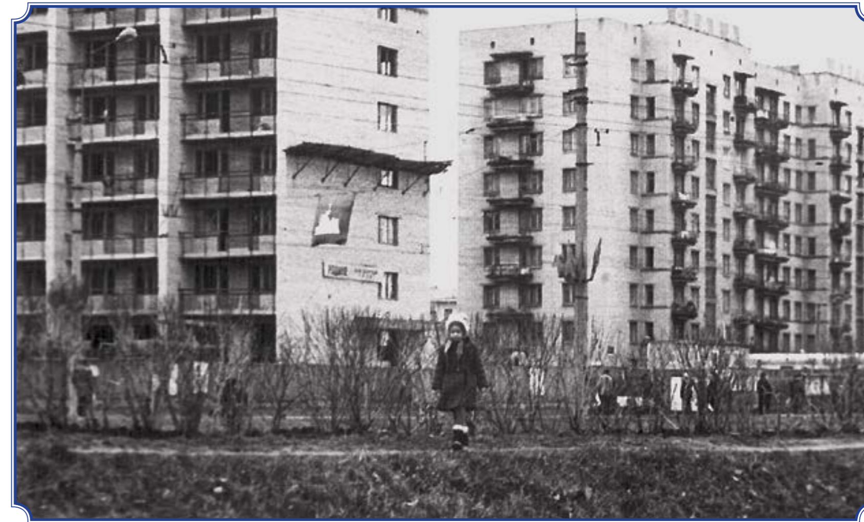
Дом по адресу пр. Ветеранов, д. 146/22, где сейчас находится библиотека №12 «Информационно-сервисный центр», еще не был достроен.