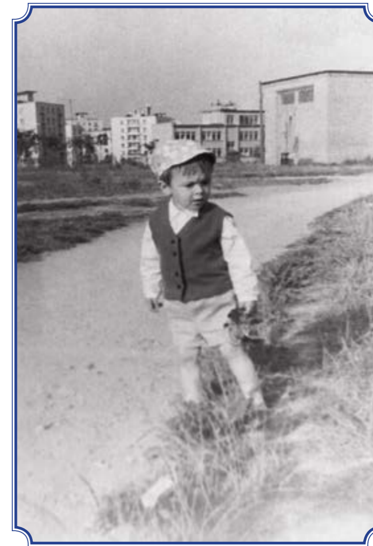
Лигово, 1971 год