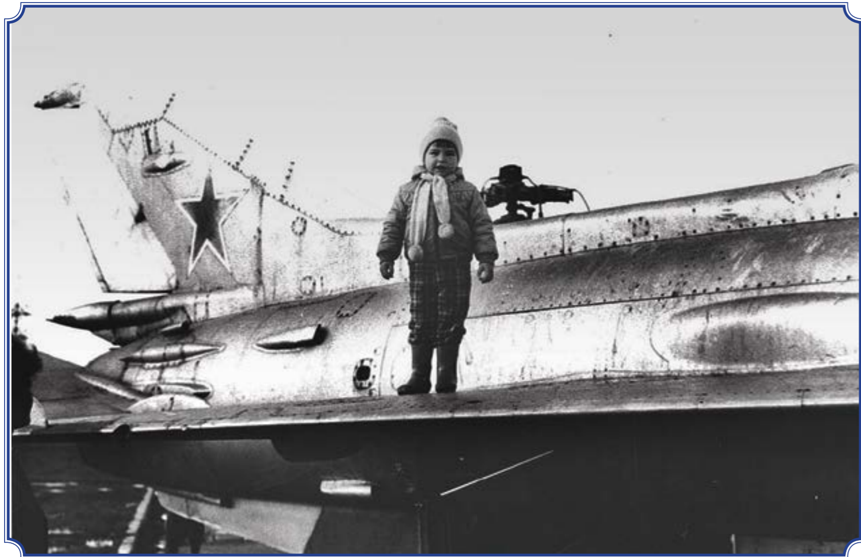
Старая военная техника около Южно-Приморского парка им. В.И. Ленина, 1989 год