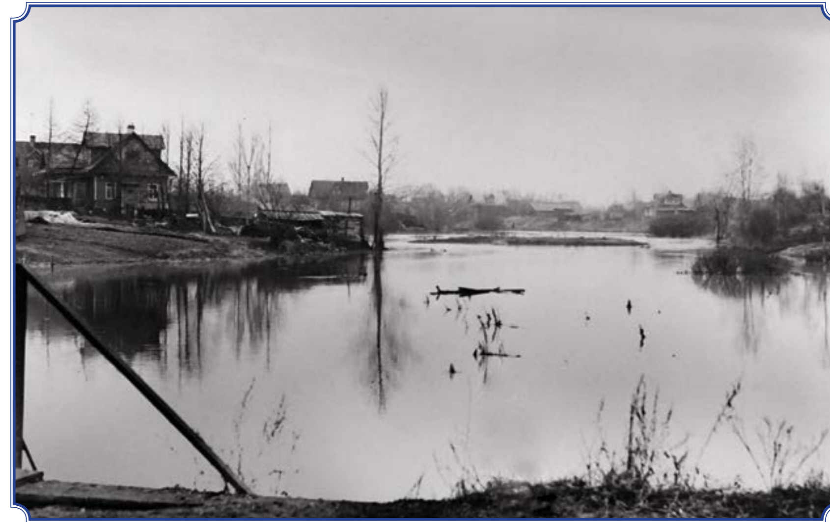
Посёлок Старо-Паново, река Дудергофка разлилась, вид со стороны ж/д, весна 1979 года