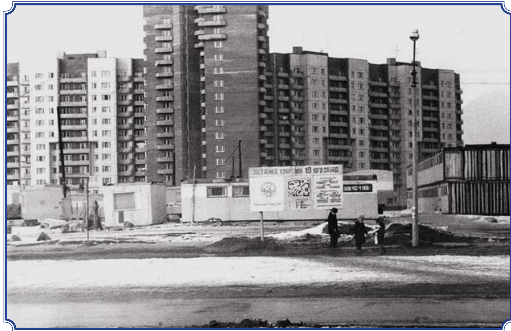
Ул. Маршала Захарова. Новостройки, 1986-1988 года

Фото предоставил Александр Сергеевич Макаров