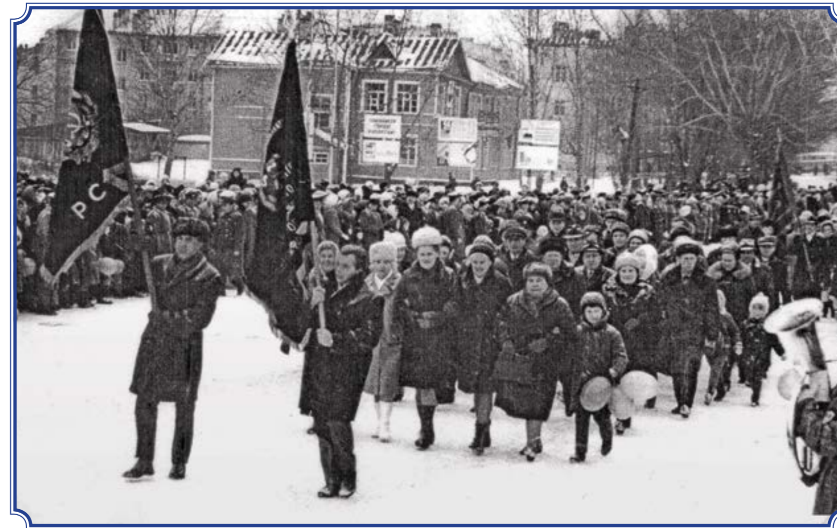
Демонстрация 7 ноября, 1970-е годы. В первом ряду – работники горсовета, идут со стороны горсовета. Ближайшее здание – школа №2.