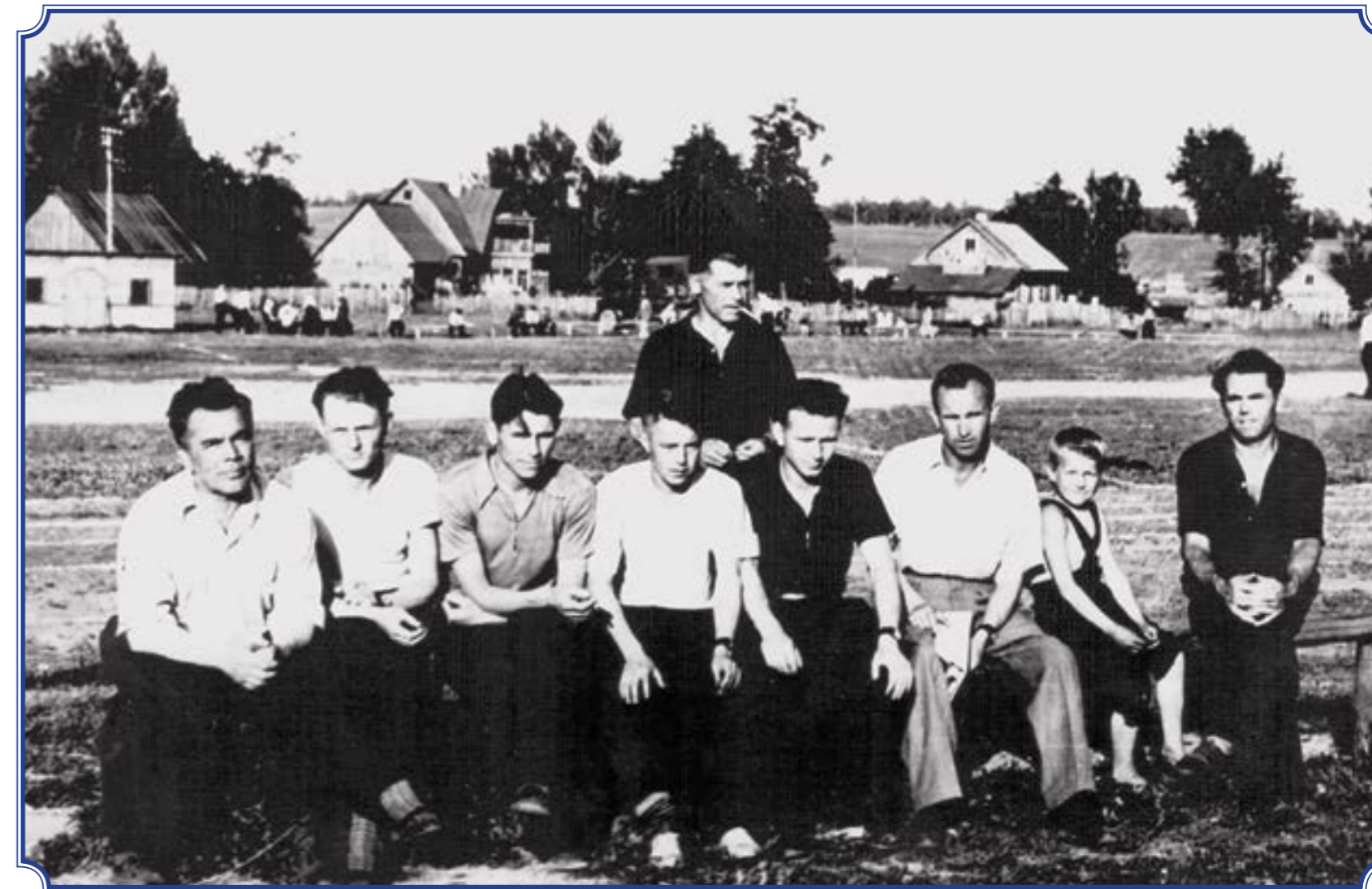
Стадион в Красном Селе. Рабочие электроцеха Бумажной фабрики. Конец 1950-х годов