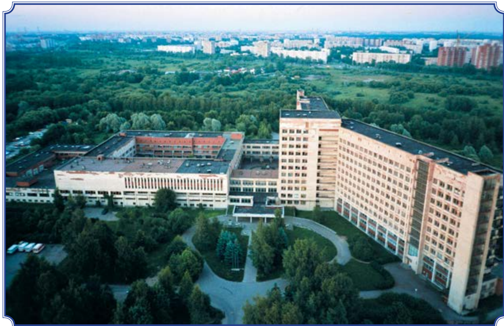
Съёмка с трубы котельной на ул. Авангардной, июль 2001 год