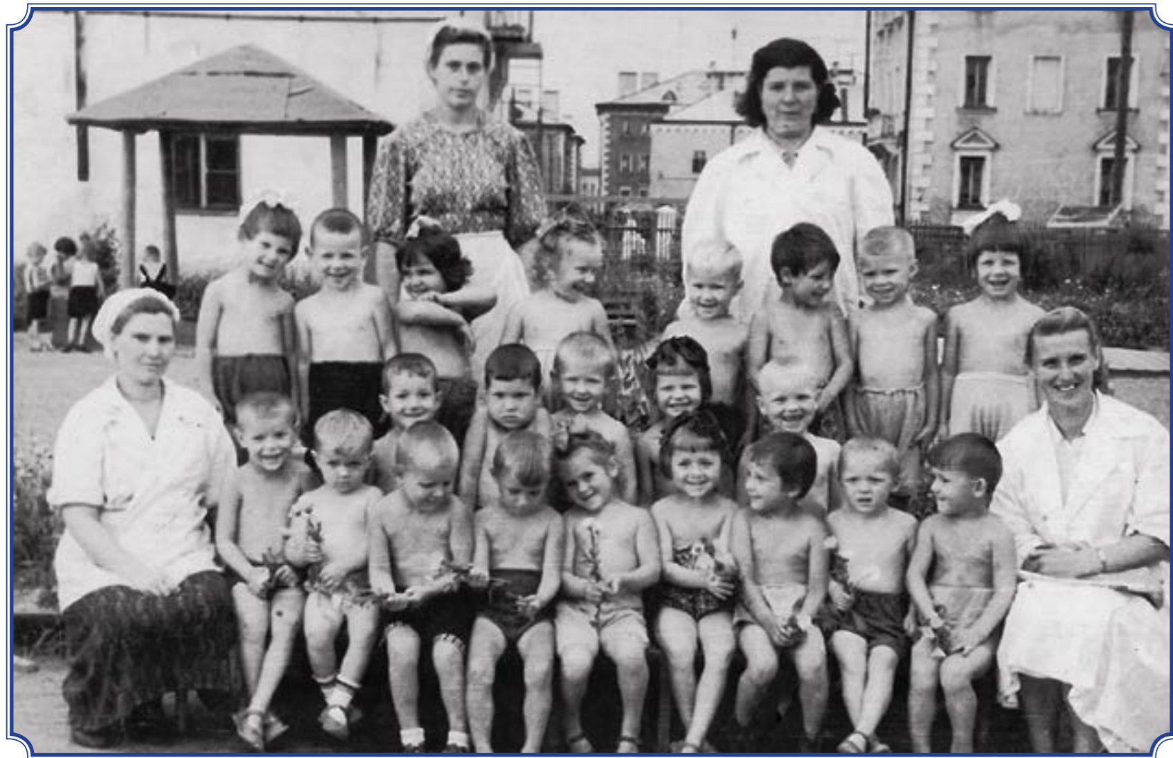
Детский сад №18 на ул. 2-я Комсомольская. Младшая группа. Здание сохранилось, 1955 год