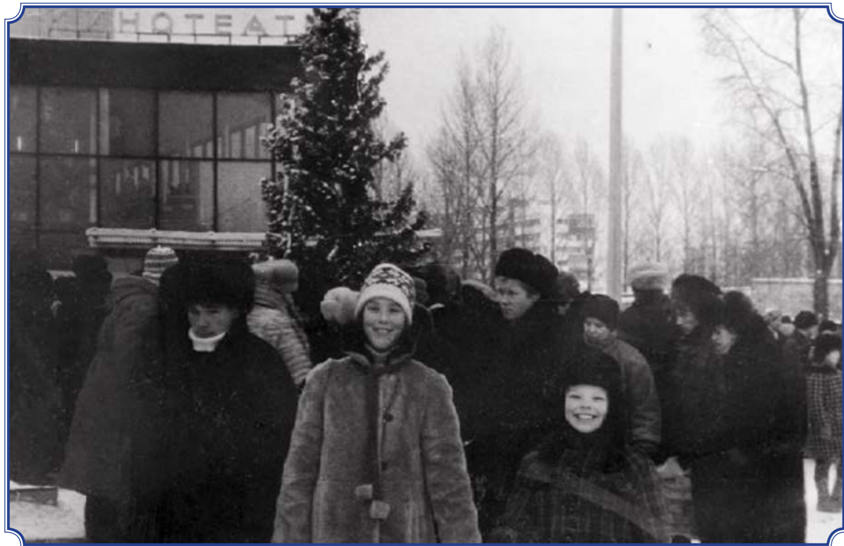
У кинотеатра «Рубеж», Новый 1987 год