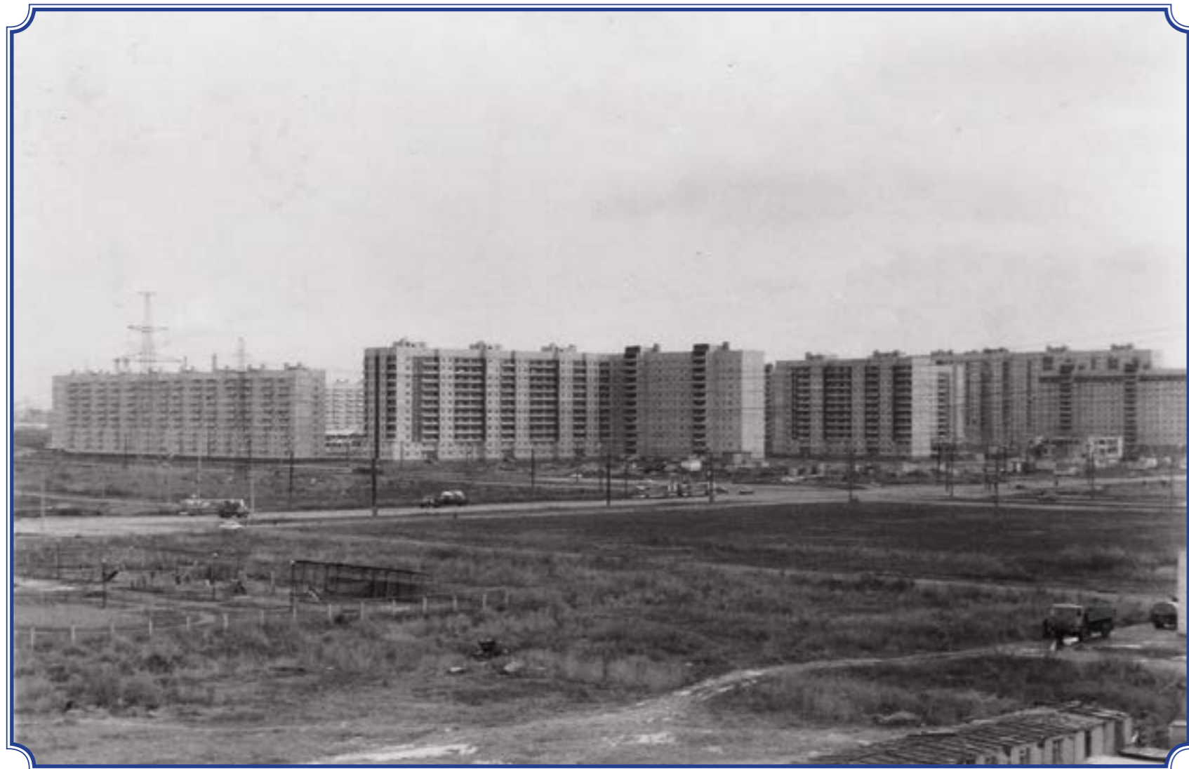
Вид на угол Ленинского пр. и ул. Десантников из дома 79, корп. 2, осень 1991 года