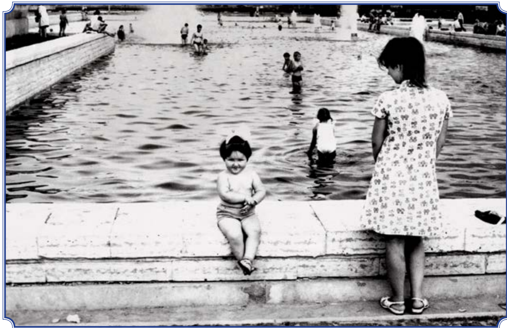
Южно-Приморский парк им. В.И. Ленина, 1980-е годы