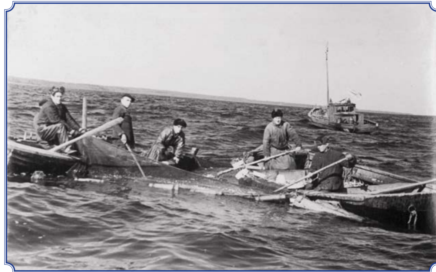
На Финском заливе во время рыбной ловли