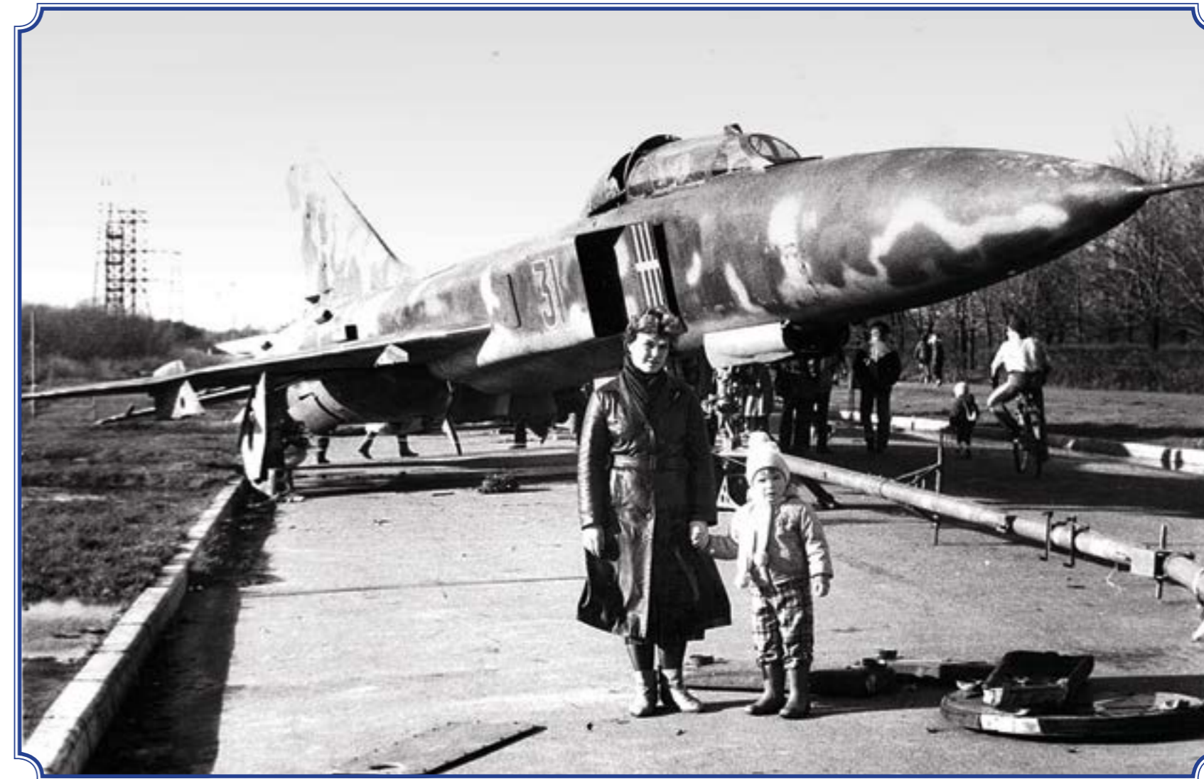
Старая военная техника около Южно-Приморского парка им. В.И. Ленина, 1989 год