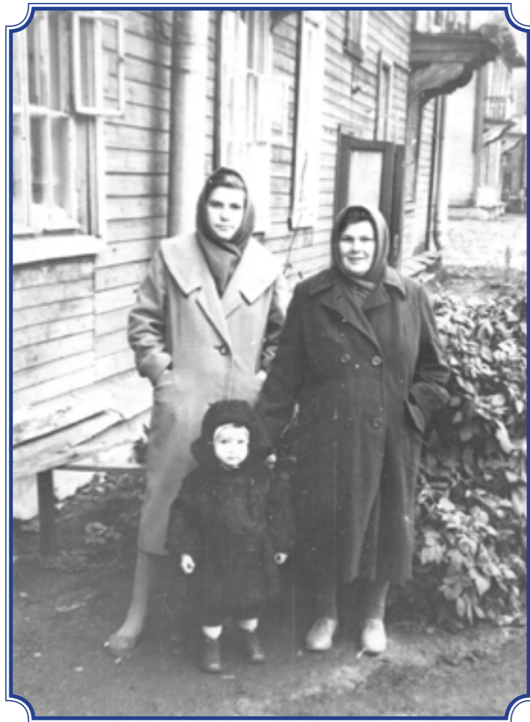
Снимок сделан на ул. Пограничника Гарькавого, 1963 год