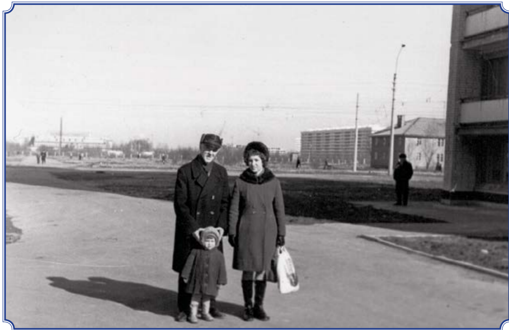
Сосновая Поляна, 1975 год