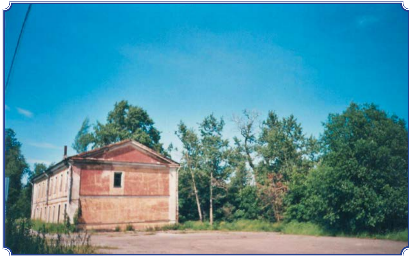
Здание у подножия Кадровой горы, после революции в этом здании была фабрика по производству зеркал, 1998 год