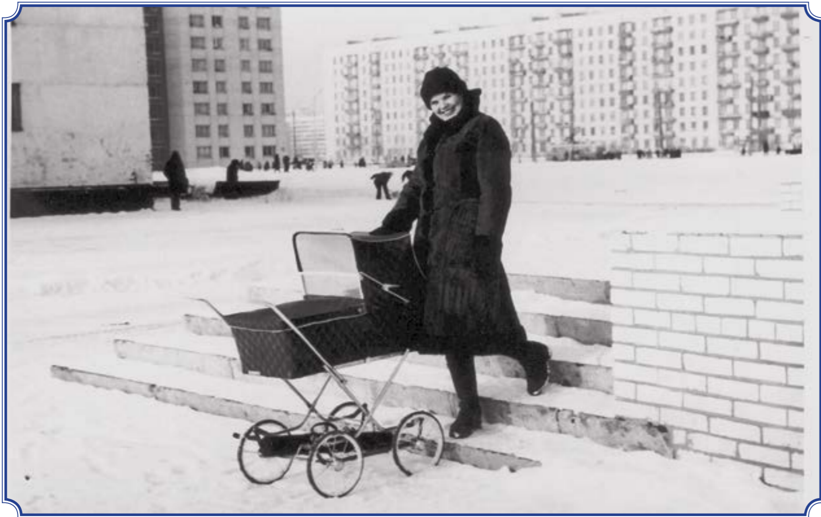
Вид с пр. Ветеранов, д. 118, корп. 1, ещё нет дома по адресу пр. Ветеранов, д. 120 (виден перекрёсток проспекта Ветеранов и Авангардной улицы), 1980 год