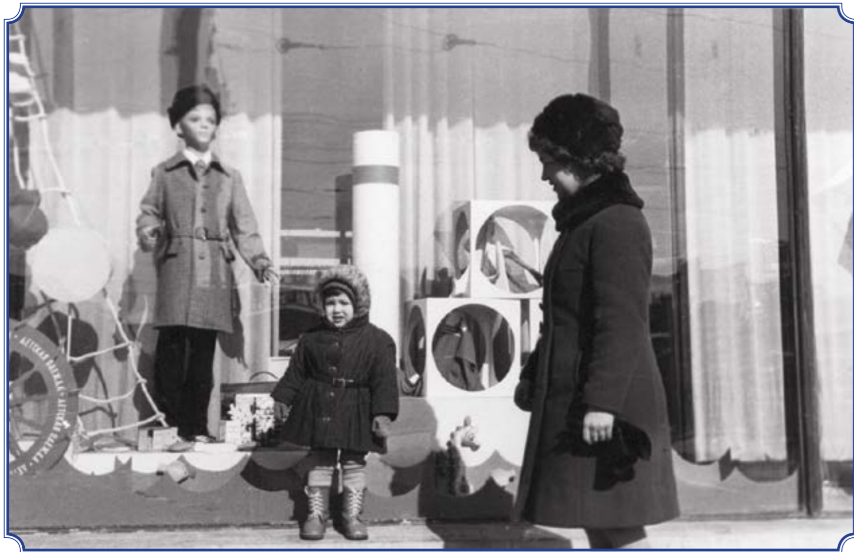
Сосновая Поляна, у витрины магазина «Детский мир», 1975 год