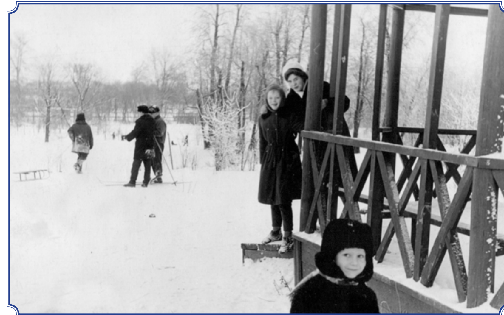
Беседка на ул. Чекистов при входе в парк, 1965 год