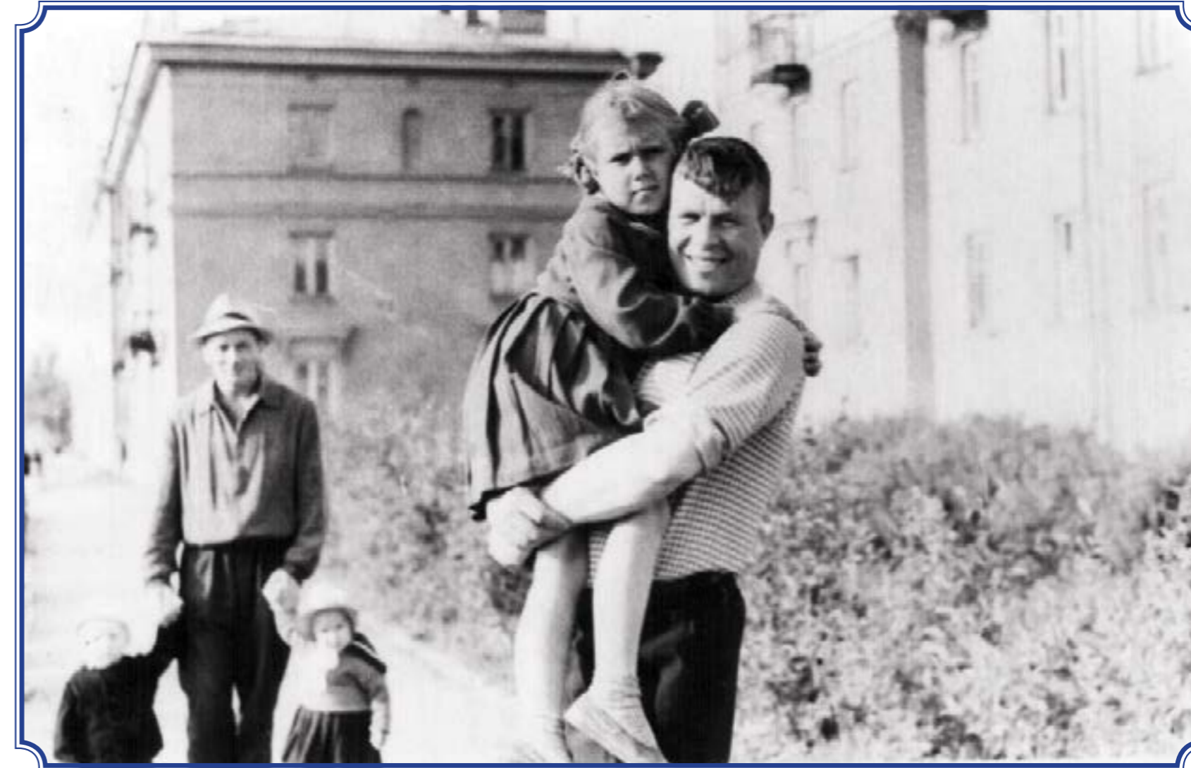
Ул. Лётчика Пилютова, 1959 год