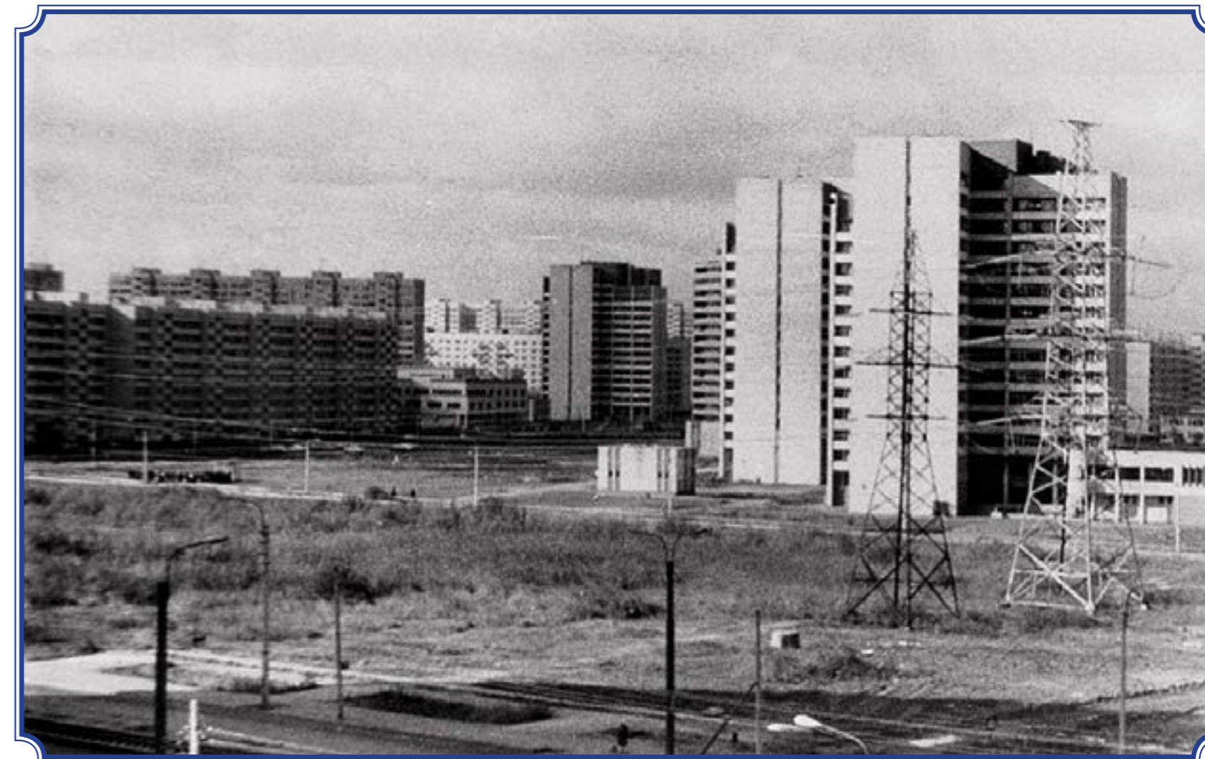
Снимок сделан из общежития, расположенного на ул. Маршала Захарова, д. 46, сентябрь 1986 года