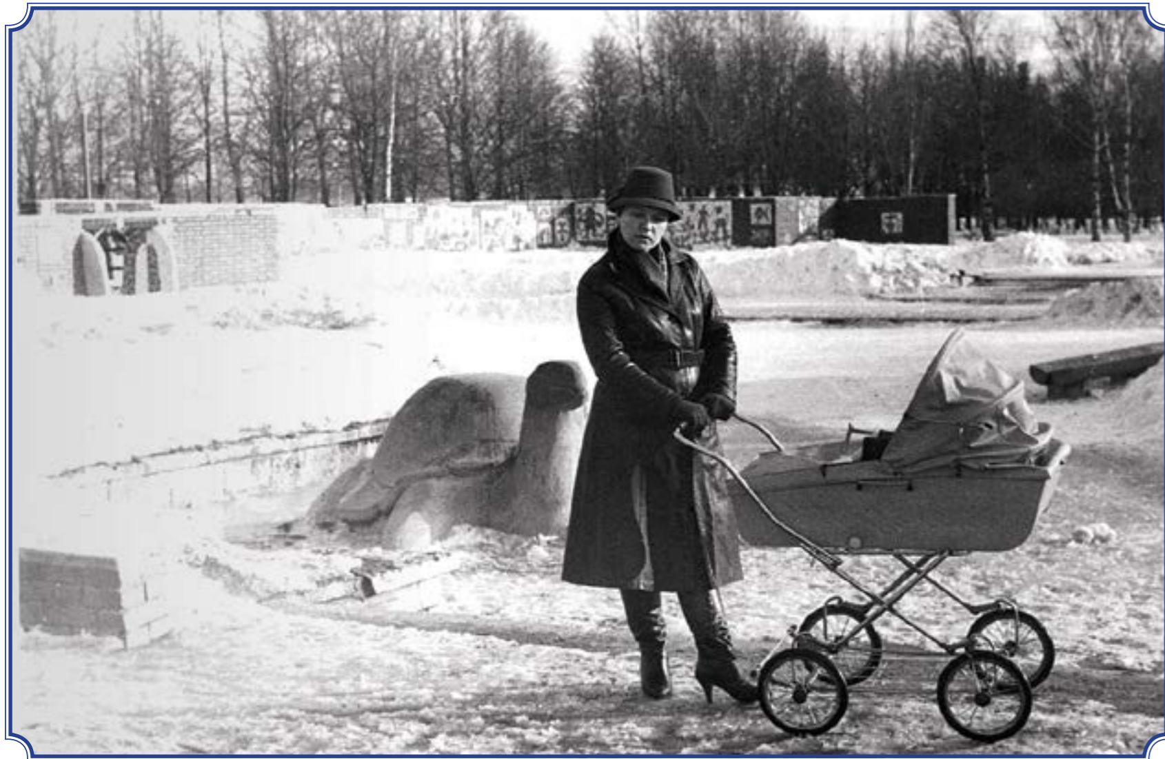
Южно-Приморский парк им. В.И. Ленина, март 1987 года