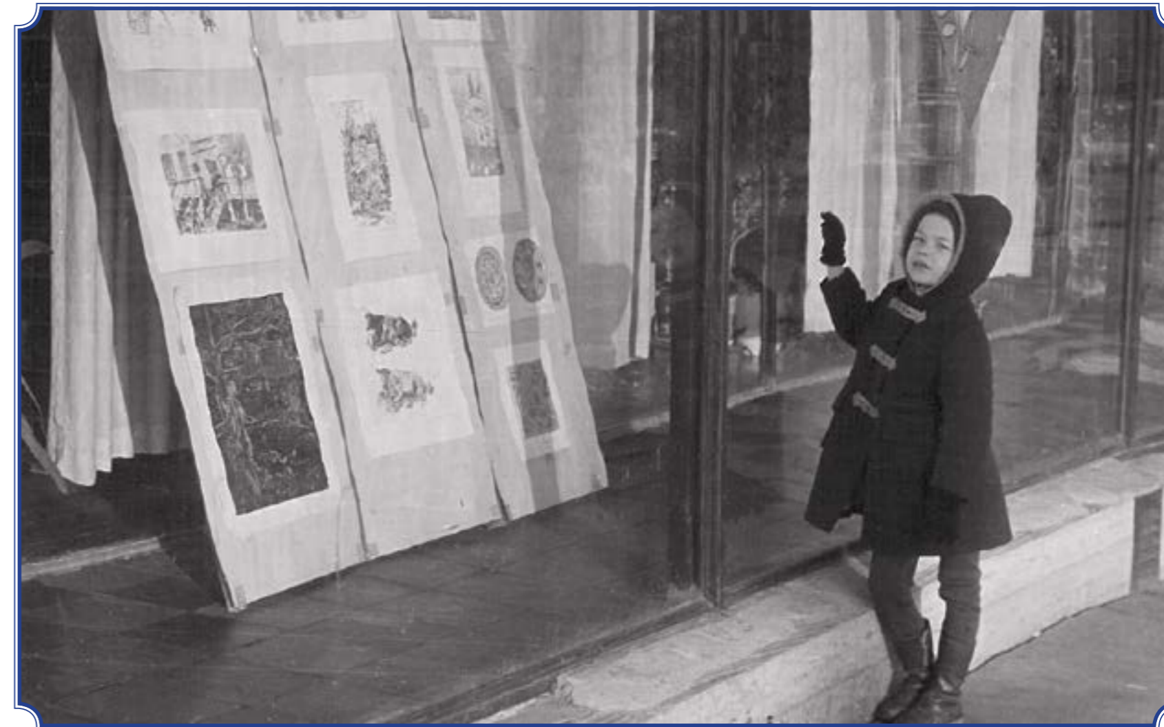
У витрины Центральной районной детской библиотеки «Радуга» ЦБС Красносельского района, 1982 год