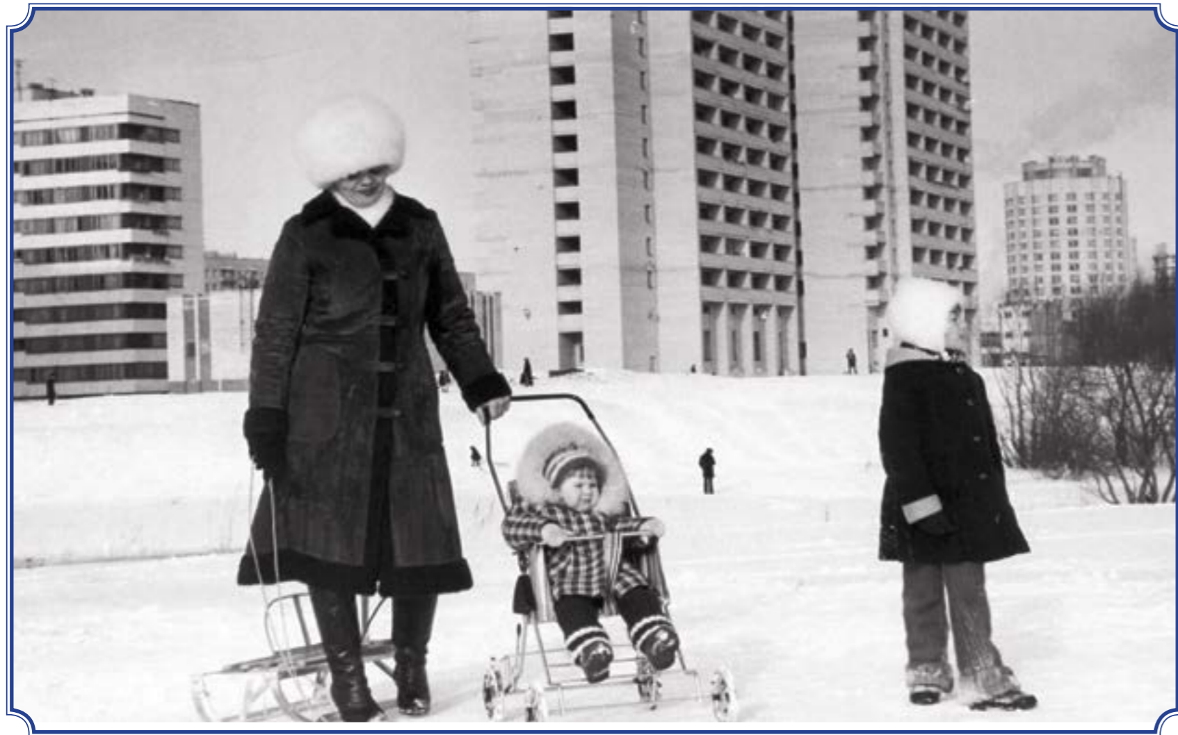
Вид с аллеи Славы на дом по ул. Авангардная, д. 20, корп. 2 и пр. Ветеранов, д. 118, корп. 1 (корпуса 2 ещё нет)