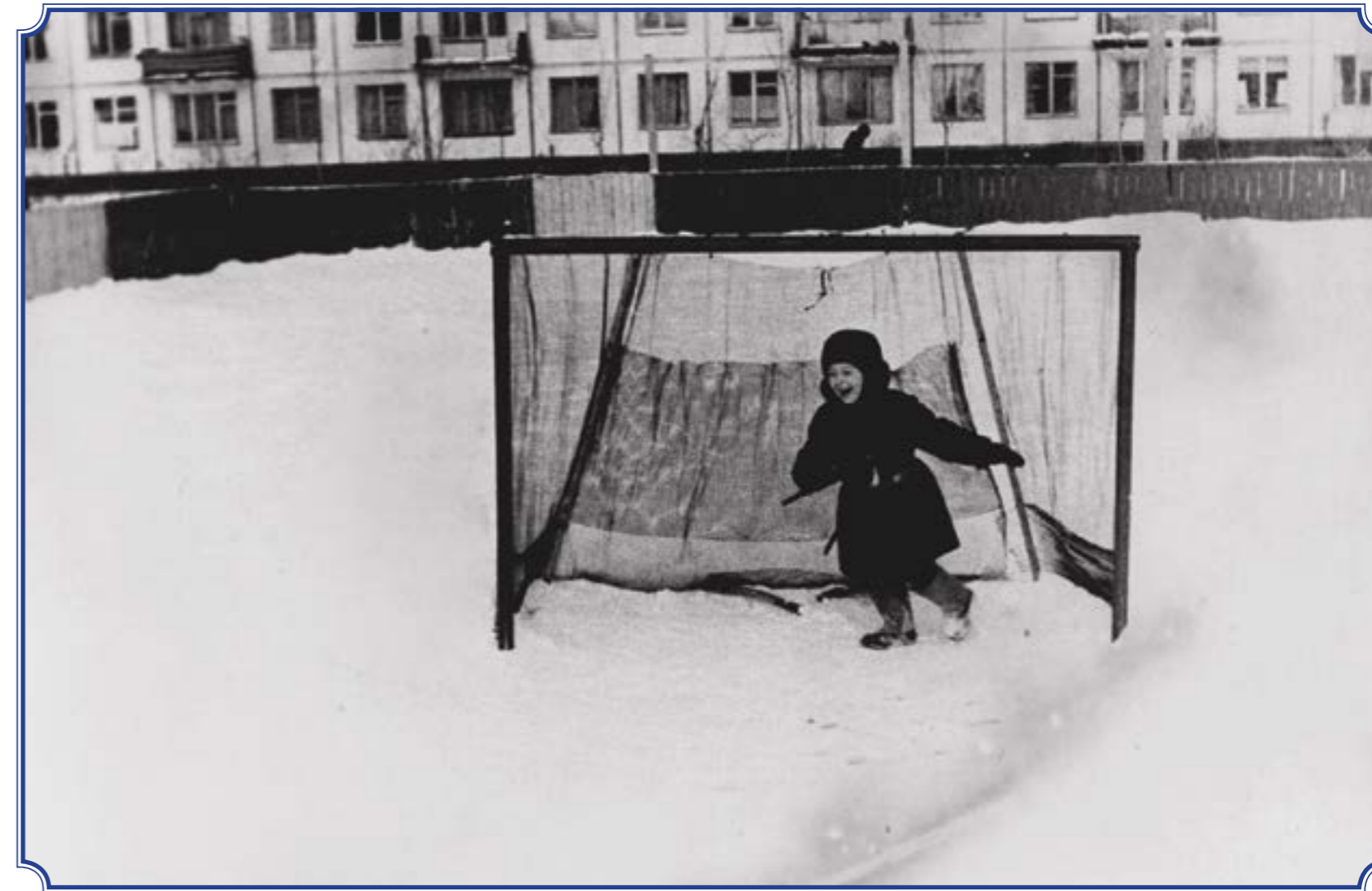
Пр. Народного Ополчения, д. 207, 1978 год