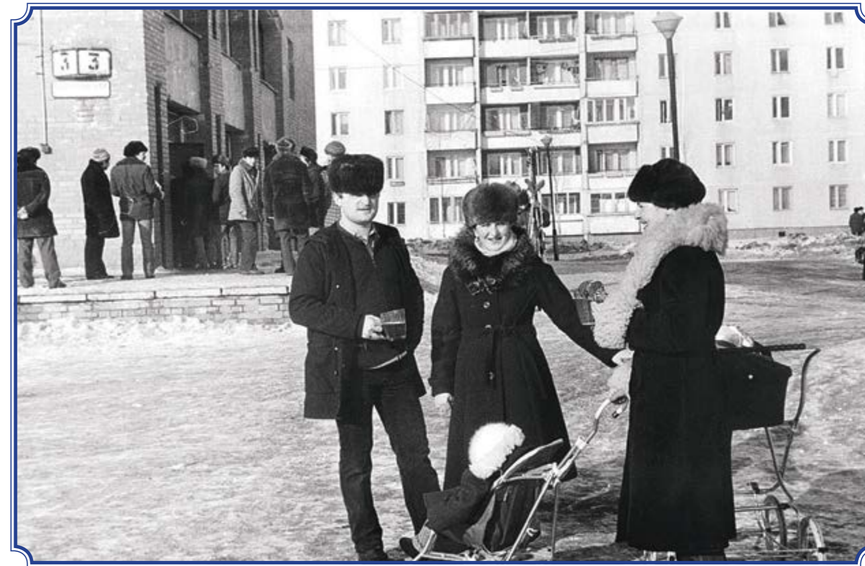
Петергофское шоссе, д. 3, 8 марта 1987 года