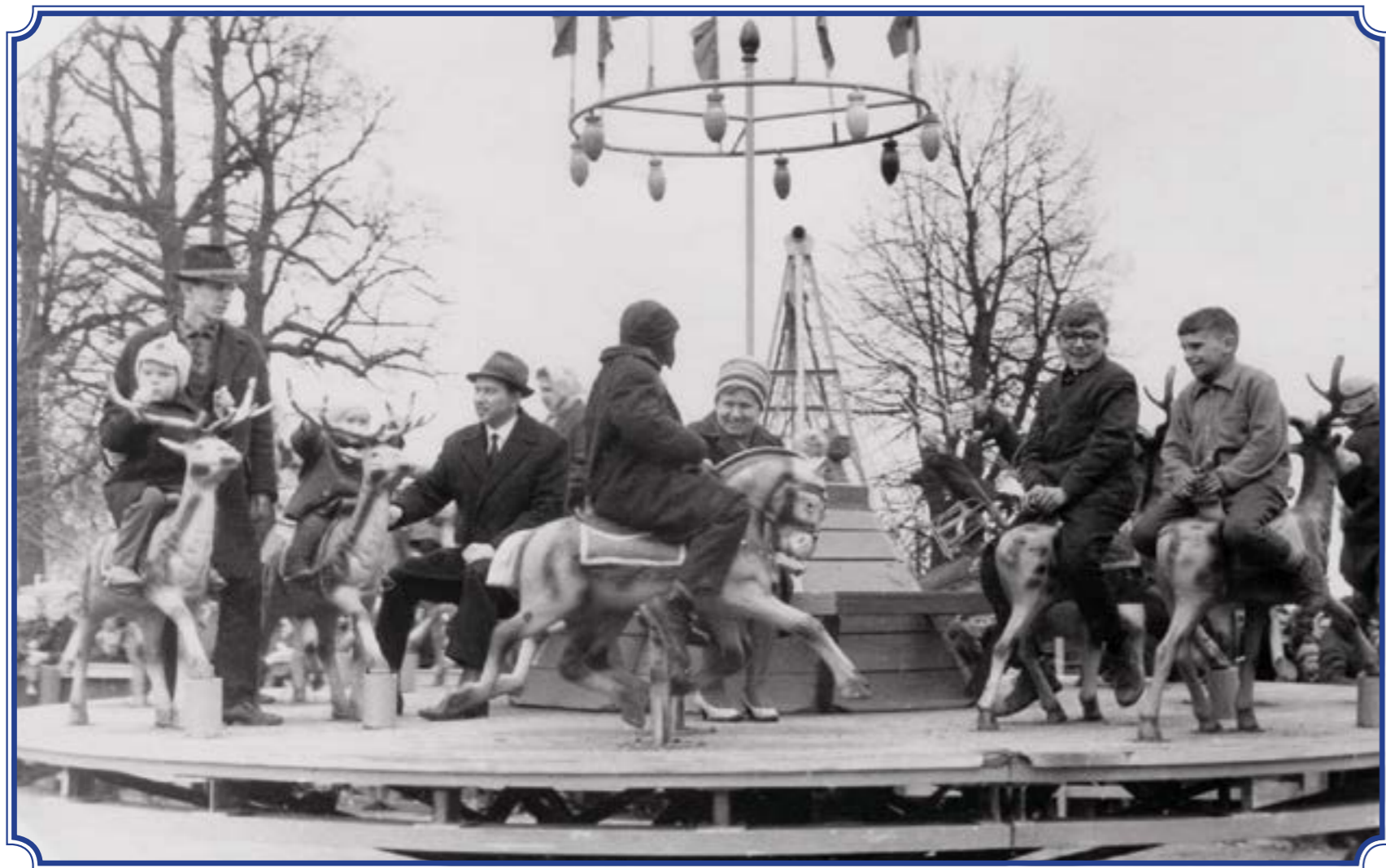
Красное Село, парк. Детские карусели, май 1967 года