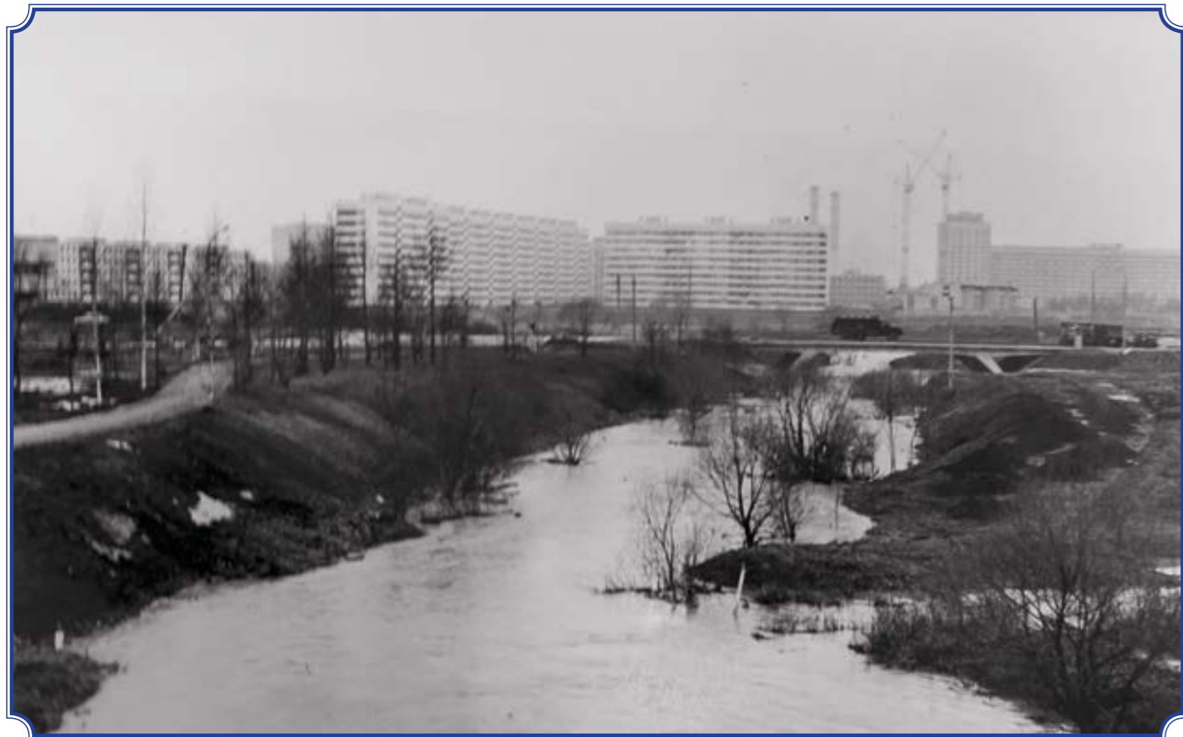
Вид на реку Дудергофку с насыпи Таллинского ш. в сторону ул. Авангардная. Слева видна аллея Славы, 1979 год