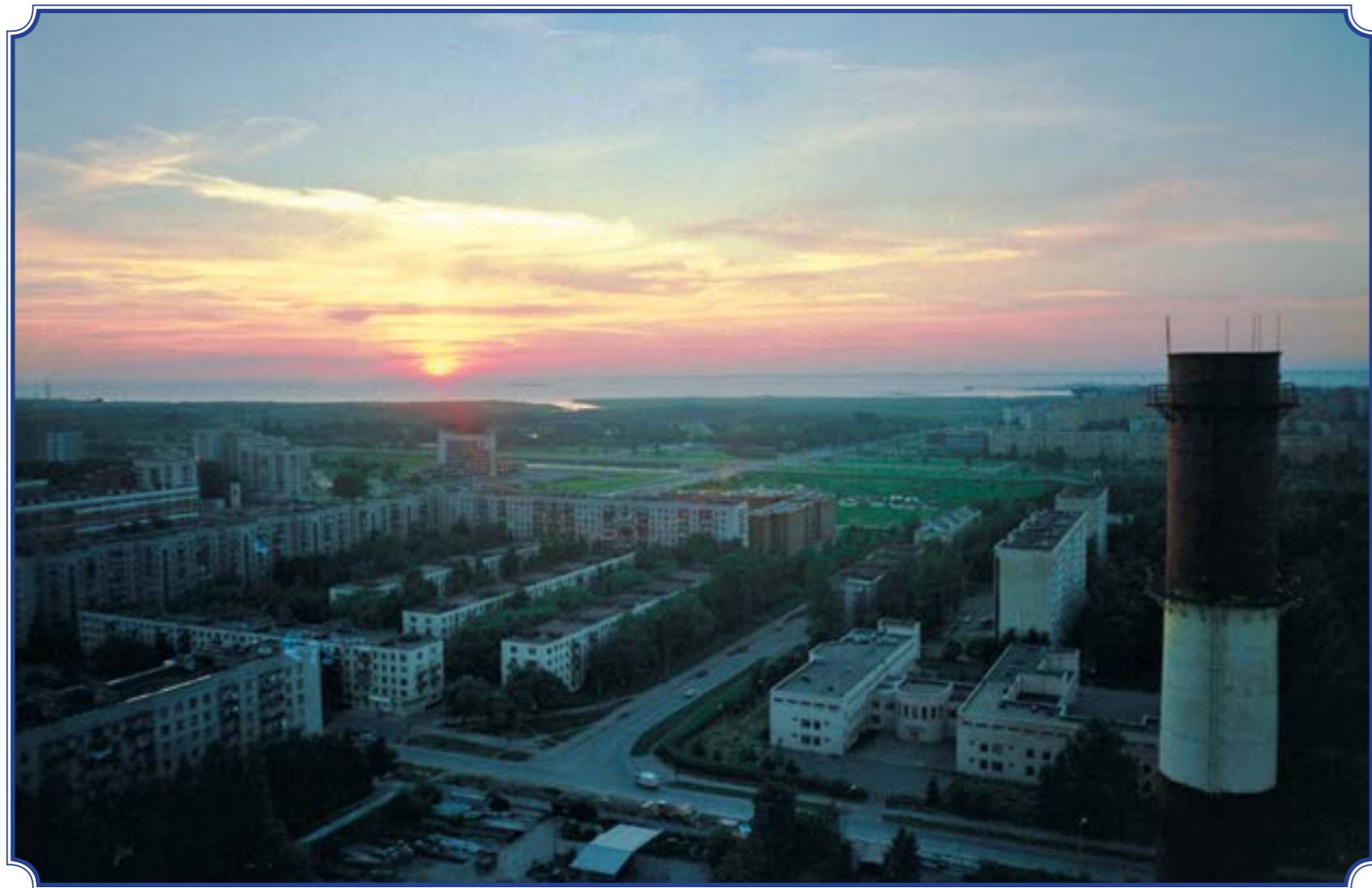
Съёмка с трубы котельной на ул. Авангардной, июль 2001 год