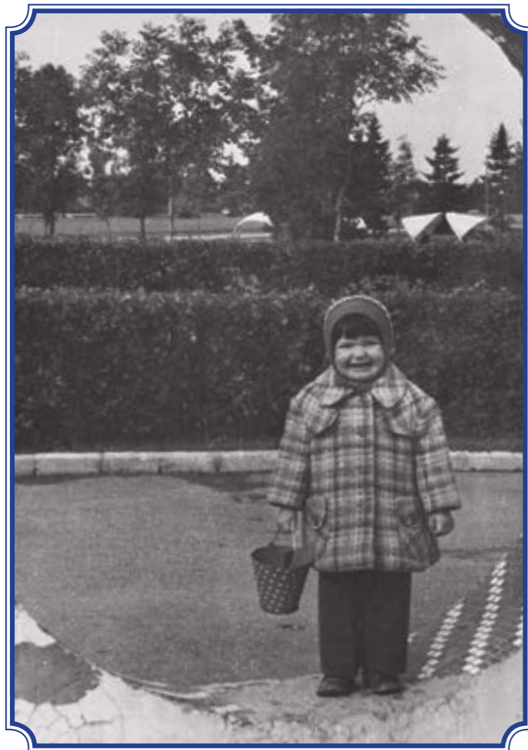
Южно-Приморский парк им. В.И. Ленина, 1978 год