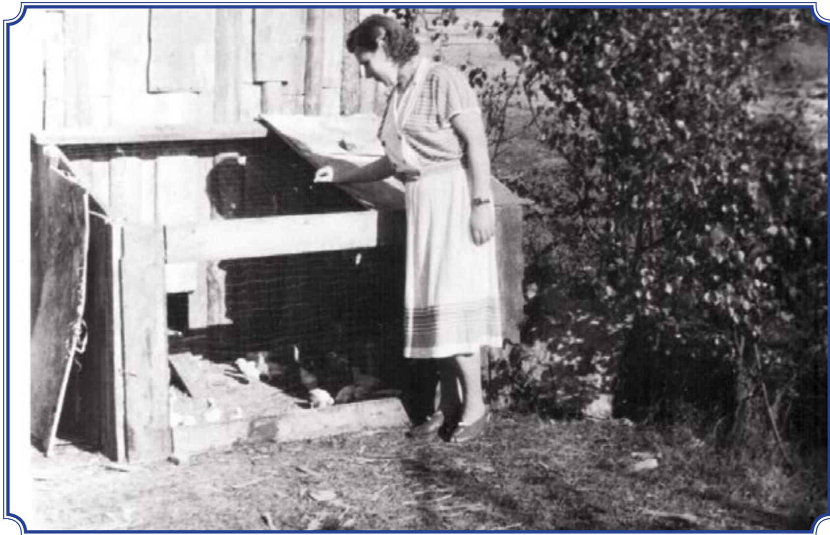
Ул. Лётчика Пилютова в районе дома №11, 1950-е годы