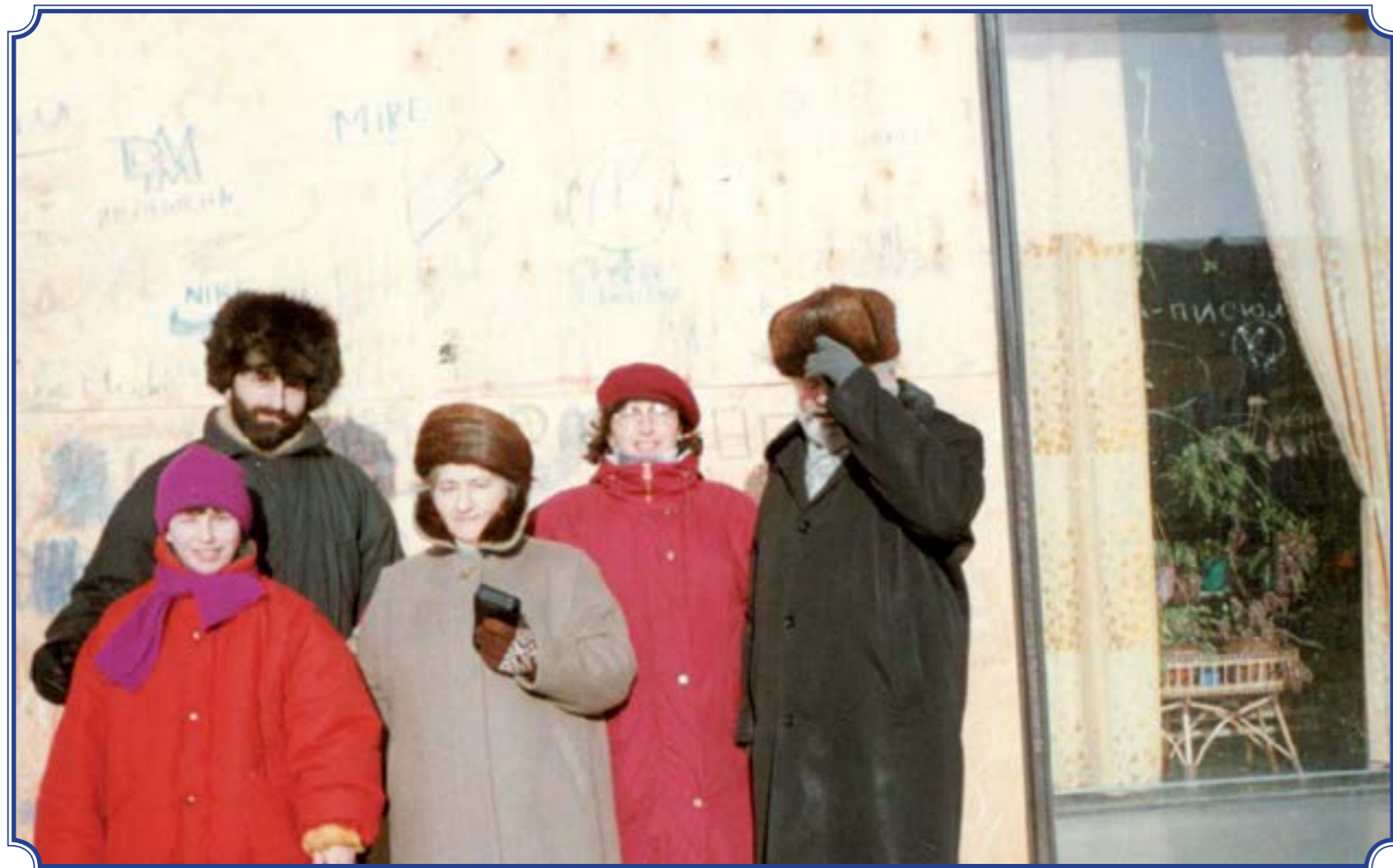
Пр. Ветеранов, д. 155 (у витрины Центральной районной библиотеки), 1990-е годы