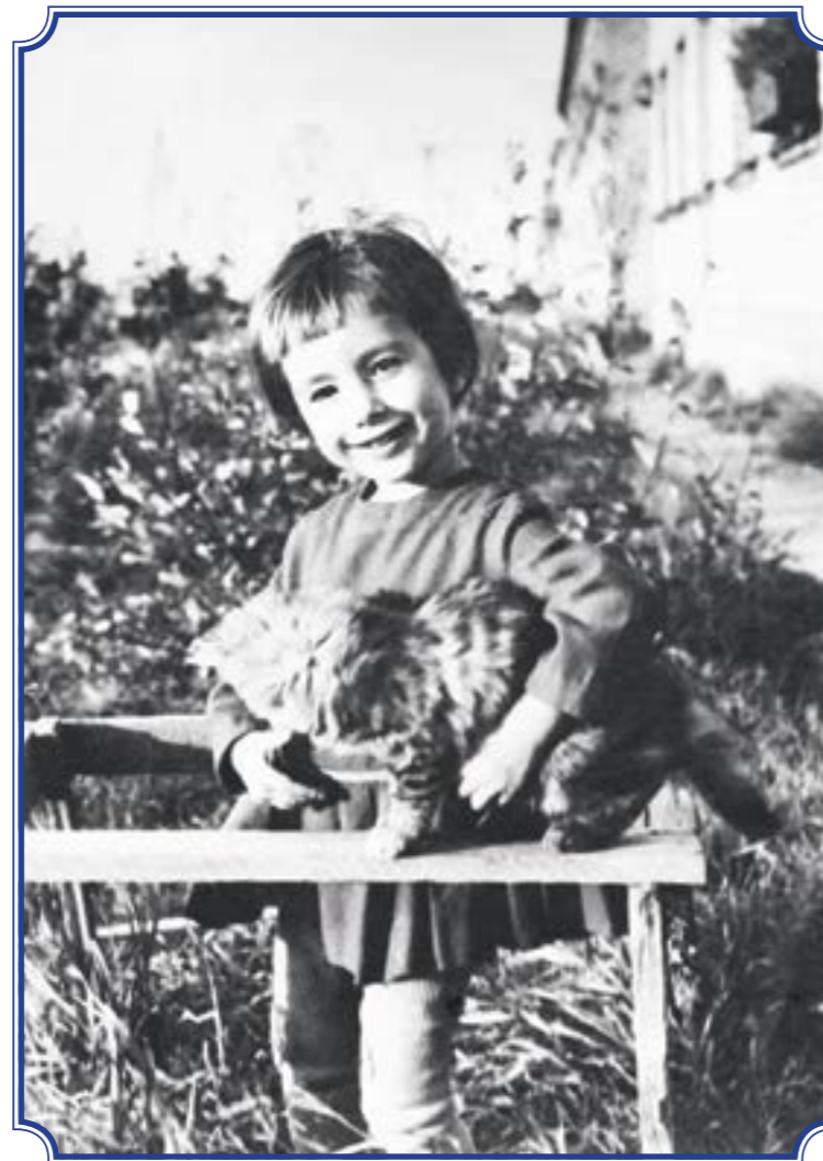
Горелово. ул. Заречная, д. 10, 1972 год