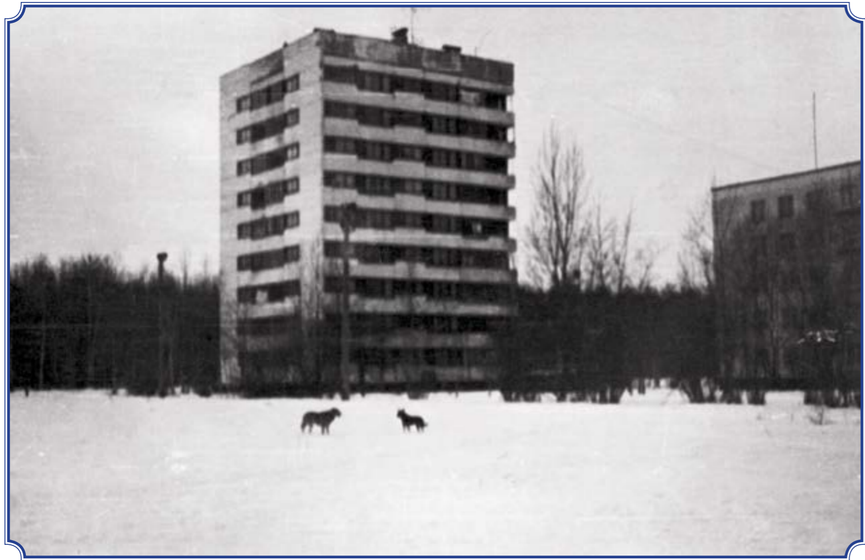
Ул. Лётчика Пилютова, д. 48, 1990 год