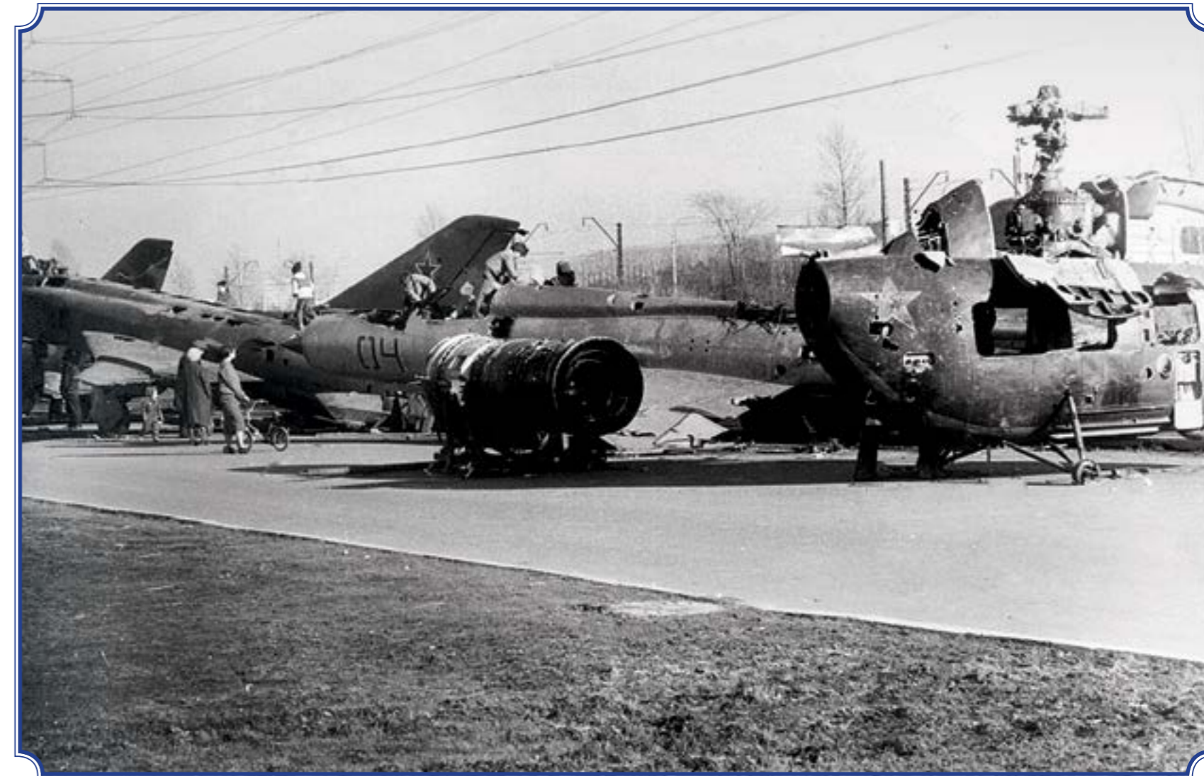
Петергофское шоссе под ЛЭП рядом с Южно-Приморским парком им. В.И. Ленина