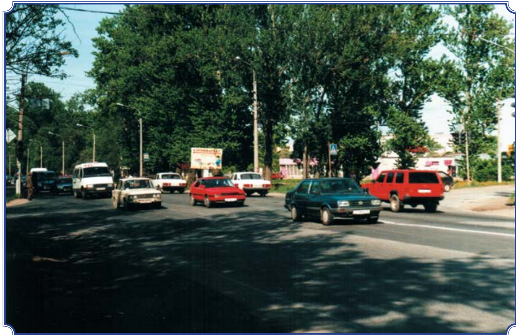
Остановка Горелово, 1995 год