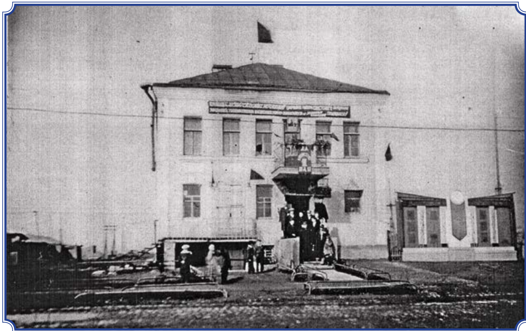
Красное Село, здание Горсовета, 1970 годы