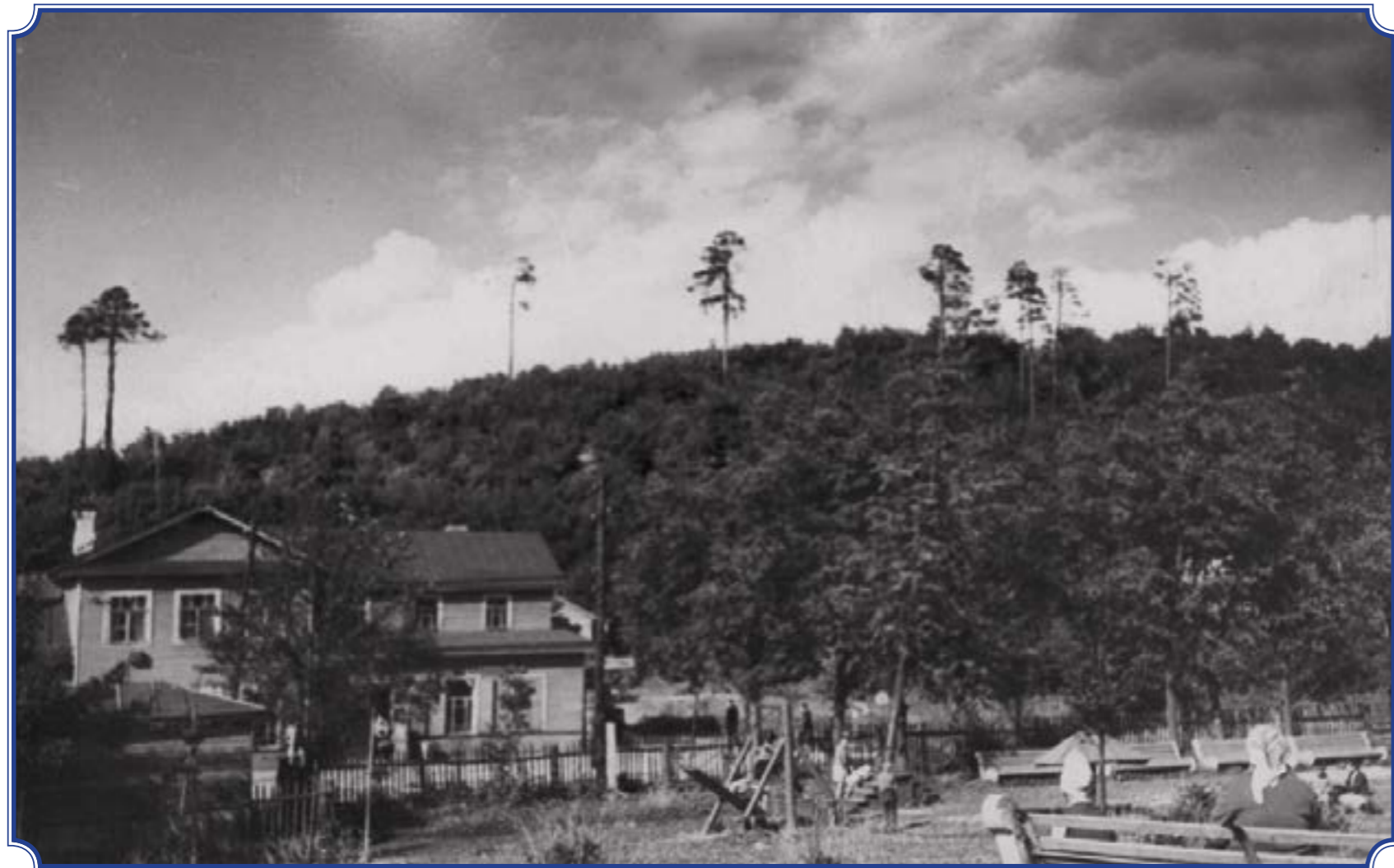
Детская площадка, здание с магазинами на фоне Вороньей горы, 1960-е годы. Фотография со школьной экспозиции школы-интерната №289 Фото предоставила Мария Михайловна Воскресенская