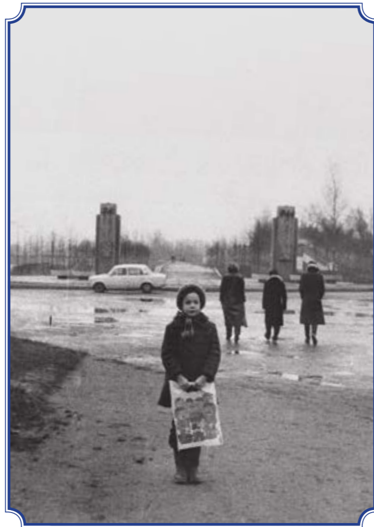
Памятные стелы-пилоны рядом с аллей Славы, 1985 год